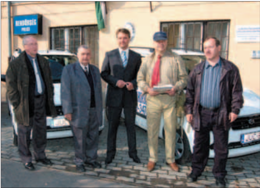
A rendőrség és a polgárőr egyesületek sokat tesznek a kerületi lakosok biztonságáért.

nem hagynak nyugodni: elindult egy mozgalom, nem is olyan régen, szinte csak itt, Magyarországon. Sok gyanakvás kísérte a polgárőrök első lépéseit, cselekedeteit. Má-