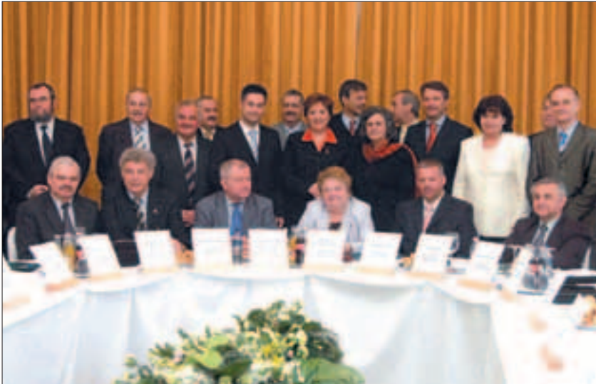
Kerekasztal: A jövőben rendszeresen találkoznak a budapesti polgármesterek.

zősen támogatják Budapest pályázatát az „Európa Kulturális Fővárosa 2010” cím elnyerésére, és siker esetén együttműködnek egymással. Megállapodtak abban is, hogy a téli időszakban szüneteltetik a kilakoltatásokat, és nem teszik utcára a díjat