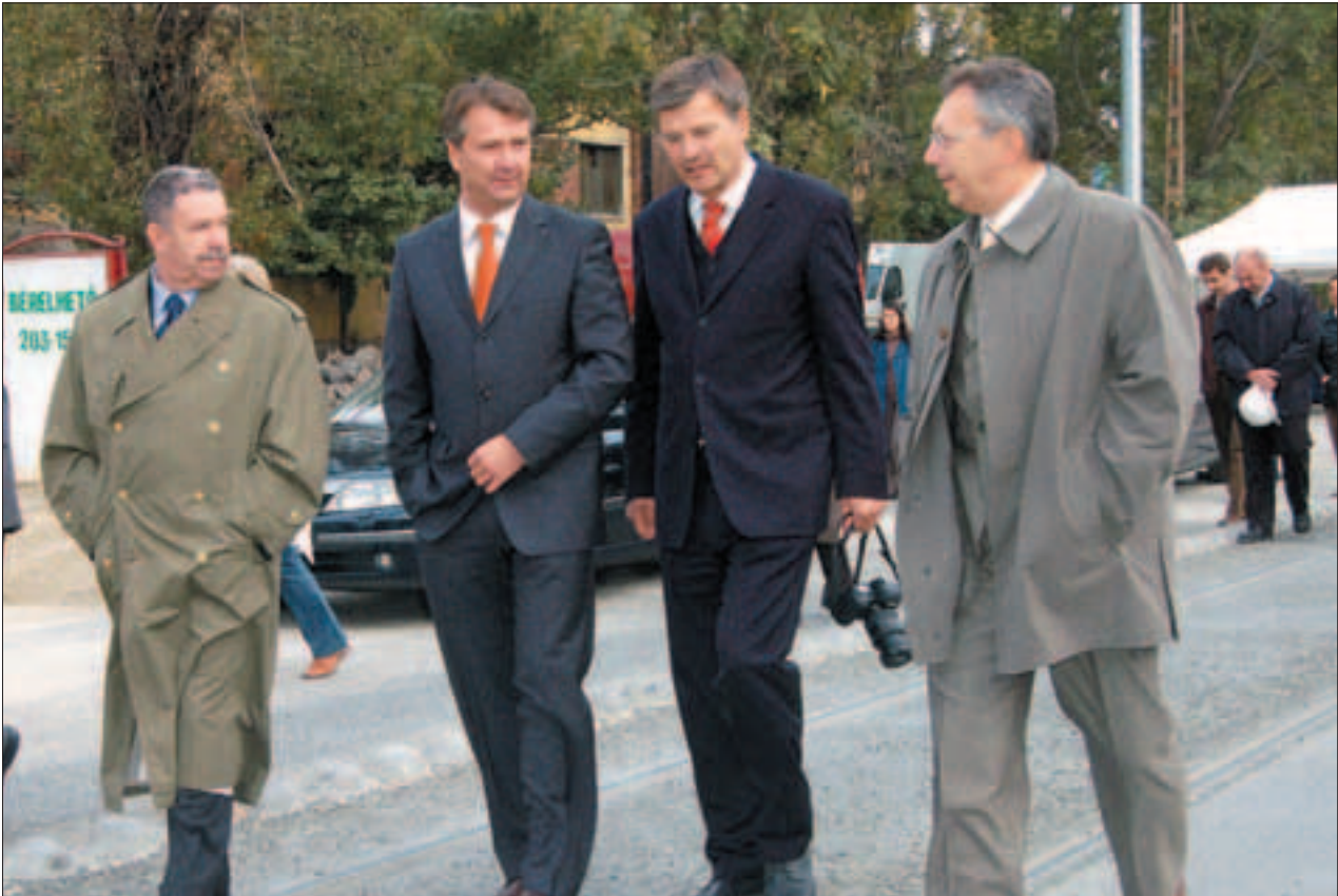
Két és fél milliárd forintért épült át teljesen az első ütem.

A nagy fejtáadás cégek adatbázisába ingyen regisztráltathatták magukat