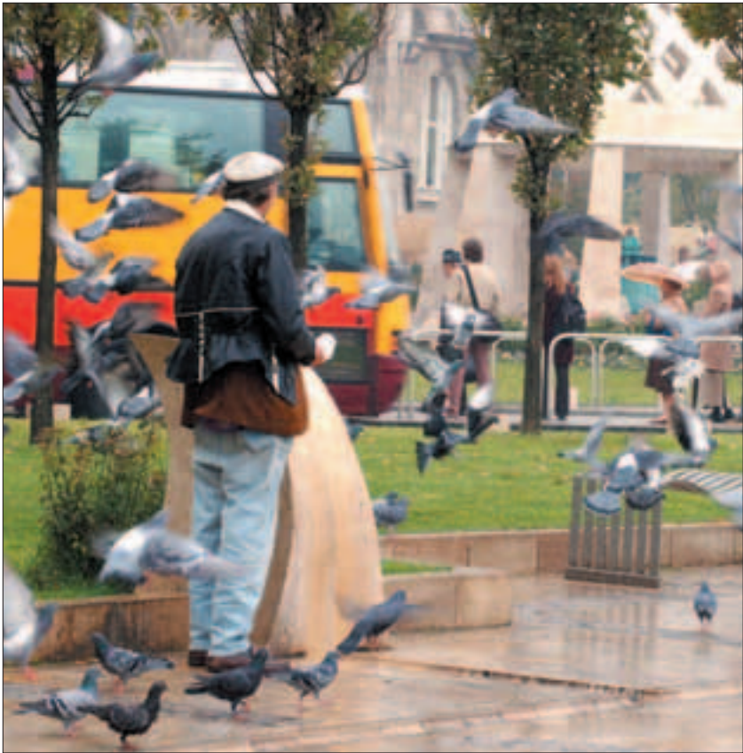
Visszajárnak a galambok, pedig már nem etetik őket.

A galambok igencsak szapora állatok. „Sirig tartóan” párban élnek és szaporaságára jellemző, hogy évente akár kilenc pár fiókát is költenek. Finom húsa miatt elsőrendű étékként szerepel az étlapokon, ezért tenyésztik is őket – korábban a mainál jóval nagyobb mértékben –, de elszaporodtak jócskán maguktól is. Elsősorban mezei magvakkal táplálkoznak, ám a város aszfaltján, a parkokban, a kertekben is megtalálják a napi betevőt, és jó néhányan etetik is a madarakat. Ahol pedig élelmet lelnek vagy kapnak, oda rendszeresen visszajárnak.