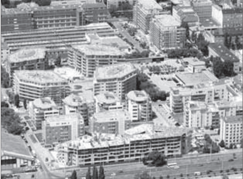
A rozsdadovezeti fejlesztések egyre népszerűbbek a beruházók körében

lakások száma meghaladja a háromezret. Ezek az István Lakópark, a Malomdomb Lakókert és a Marina Part III. üteme. A második félévben kezdődik a Sissy Lakópark, valamint az Orient Apartmanház tömbjének építése a Rákóczi úton.