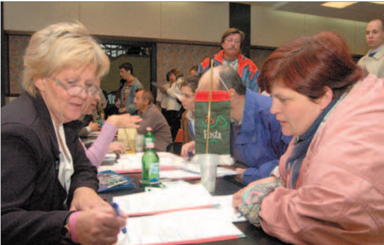
Bár a felmérések szerint összel nehezebb elhelyezkedni, az első újbudai állásbörze sikeres volt.