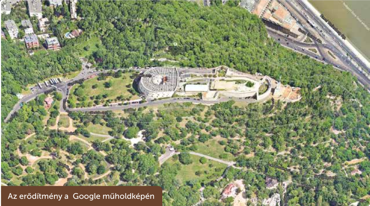
Az erődítmény a Google műholdképen

A tervek szerint a 220 méter hosszú, 60 méter széles, 4 méter vastag kőfalakkal védelmezett erőd lőrésai mögött 60 korszerű ágyút lehetett elhelyezni. Négy esztendő múltán már bevonulhattak kazamatáiba az osztrák katonaság, melynek ágyúi fenyegetően néztek a túlpárti Pest városára. Az erődrendszert többi része soha nem küszört el, mivel a Monarchia hadvezetése végül Komárom városa körül készítette el az „utolsó védőbástyát”. A Citadella a zsarnokság és az abszolutizmus szimbóluma lett főként a pestiek, de az egész magyarság szemében is.