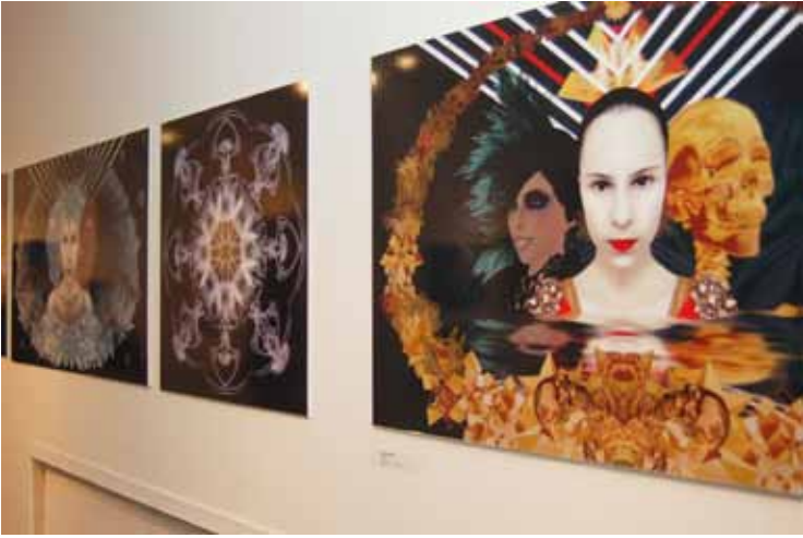
A kiállítás a ma élő ember életvitelét is szimbolizálja, bemutatva, hogy a digitális világ mennyire részévé vált az életünknek. (T.D.)

Igazán üde színfolt Szabó Amanda : Medúza című interaktív installációja, melyben a fémszálakból alkotott tengeri állatkára vetítenek egy projekciót, amitől a csápos lény életre kel. – Ha közel állsz hozzá, és megszólítod, a kis medúza mozogni kezd, de csak látszólag. Az iskolában azt kellett bemutatnom, hogyan lehet nem valós, tehát csak virtuális mozgást előidézni – tájékoztatott a fiatal művész.