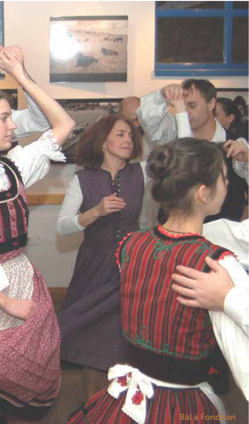
Bál a Fonóban

Téli időszakban különösen fontos, hogy fokozott figyelemmel legyünk az utcán tartózkodó hajléktalan embertársainkra. A Menhely Alapítvány diszpécser-szolgálat (Tel.: +36-1/338-4186) éjjel-nappal fogadja a bejelentéseket.