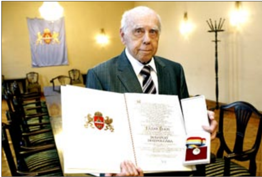
A színházkedvelő gazdasági szakember 2010 novemberében, a díszpolgári oklevél átvételekor

Csehovot játszani éppen ezért nem kis vállalkozás, hisz a színészeknek úgy kell elmesélniük a történetet, hogy nem elsősorban szavakkal, hanem viselkedésükkel mondják el a lényegét. A celtalan fecsegésben örömet lelő, élehetetlen Gajev és a valósággal szembenézni képtelen hú-