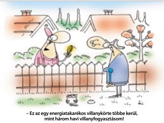
– Ez az egy energiatakarékos villanykörte többre kerül, mint három havi villanyfogyasztásom!