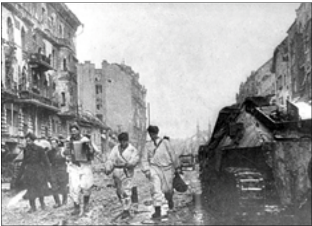
Orosz katonák a romos Bartók Béla úton. Háttérben a Szabadság híd.