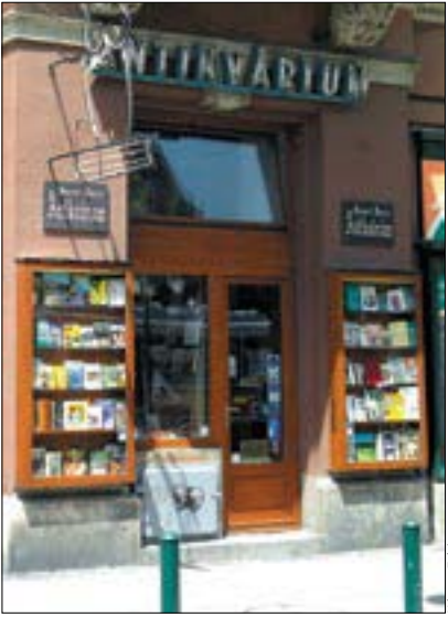
Egy pozitív példa: egyszerű, ápoltság, kulturált

A rendelet Az Önkormányzat 38/2009. sz. rendelete értelmében az Újbuda kulturális városközpont övezet területén található üzlethelyiségek utcafronti kirakatának megjelenésének rendezettnek, gondozottnak és tisztának kell lennie. Ennek érdekében kerülni kell a kirakatban a zsúfolt árukihelyezést, a kihelyezett áruk által elfoglalt, a kirakat utcafrontról látható felületére vetített összterület nem haladhatja meg a szabad bemutató felület 50 százalékát. A termékek bemutatását úgy kell megoldani, hogy az ehhez felhasznált anyagok, polcok, rácsok stb. jó minőségűek és esztétikusak legyenek, álljanak összhangban az Újbuda kulturális városközpont koncepcióval.