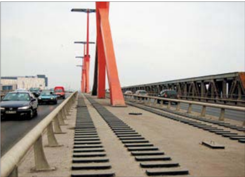
A híd építéseinél már előrelátták, hogy egy nap a villamos átmegy a budai oldalra is

A fejlesztéshez uniós támogatást szeretne nyerni a főváros, ezt az állam is támogatja: már tavaly nyáron úgynevezett kiemelt nagyprojektté nyilvánította a beruházást. A pályázatot június végéig be kell nyújtani a Nemzeti Fejlesztési Ügynökséghez, ezért volt fontos, hogy döntsön a mostani közgyűlés. A tervek szerint a több mint 40 milliárd forintos beruházás háromnegyedét állná az unió.