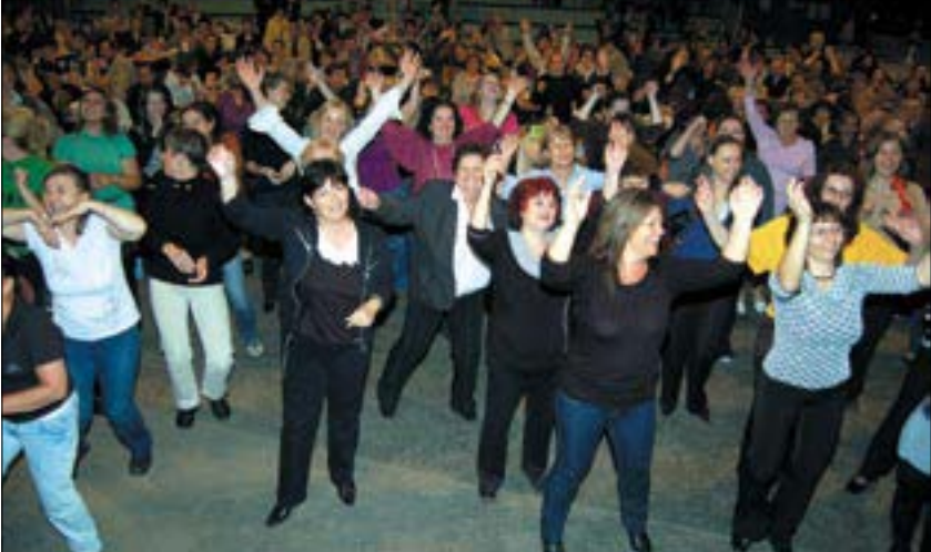
A tanévzáró pedagógus-esten jókedvből sem volt hiány