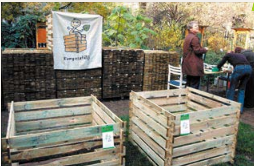
A Zöld Újbudához kapcsolódik a több év óta nagy sikerrel megvalósított komposztálási program. A program során komposztkeretek kerülnek kiosztásra a kerület lakosainak a zöldhulladék újrahasznosítása céljából.

• Budapesten először tavaly októberben Gazdagréten adták át az ún. Szelektív Panelt, amely radikálisan megváltoztatja a panelházakban élő lakók környezettudatosságát, az épületben keletkező hulladékkezelést. A szintenkénti szelektív hulladékgyűjtő rendszer sikere nyomán idén újabb 5 gazdagréti panelházban alakították ki a szintenkénti szelektív hulladékgyűjtés lehetőségét.