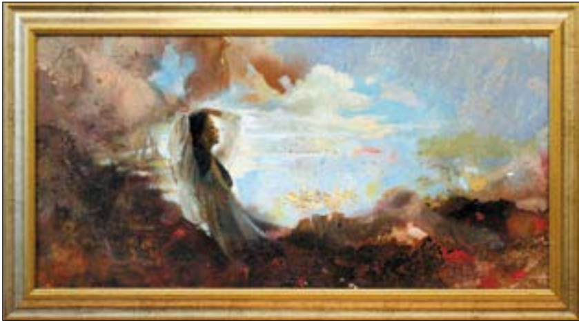
Gaia ébredése, 2007.

Wegenast Róbert karrierje a festésztől indult, majd egy hosszú kitéró után oda is tért vissza. Az Iparművészeti Főiskola grafikai tanszakára járt, aztán átiratkozott az éppen induló színpadművészeti fakultásra. A diploma megszerzése után rögtön díszlettervezőnek állt a Magyar Televízióhoz, ami akkoriban még nem a show-műsorok kartonháttereinek megálmodásával jelentett egyet.