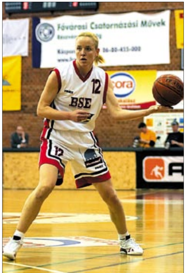
Csapatkapitányként a BSE egyik legstabilabb játékosaként