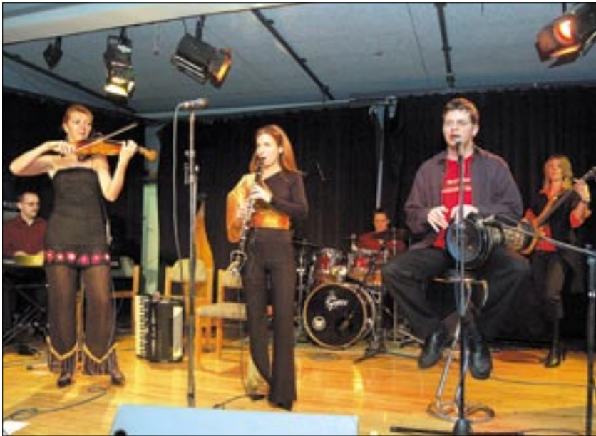
Tradicionális klezmer egy kicsit másképp – kamarazenei és dzsesszes hangszerezésben

Világzenei hangulat a telt házaz MU Színházban