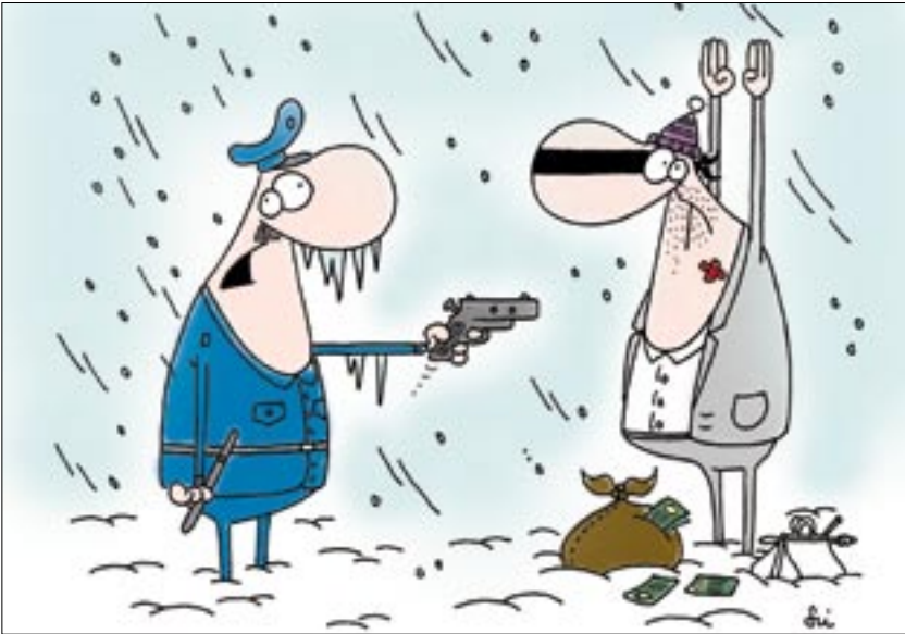
Mackós Tyutyu, most bekísérem, de előbb kicseréljük a sapkánkat!