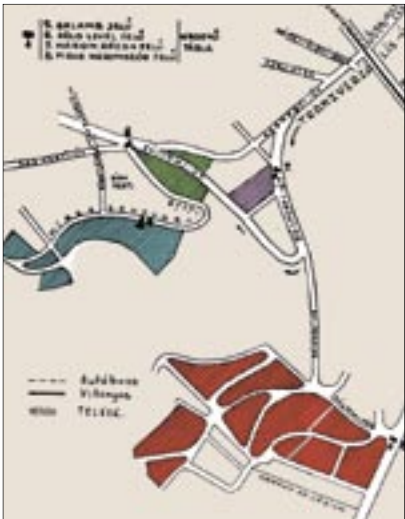
Telektömbök a jelzőtáblák feltüntetésével

hogy igen közel fekszik a város szívéhez, onnan percek alatt elérhető autóval. Az más kérdés, hogy éppen csak megépítették a Tabánon átvezető autótutat, ám gépkocsija csupán a legtehetősebbnek volt. Maradt a Gellért-hegy körbevilamosozása, majd a kaptatás a hegy lejtőire.