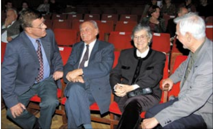
Az előadás szünetében Göncz Árpád és felesége színészekkel, újságírókkal beszélgetett

Emanuel leginkább visszavágyik a rácsok mögé – s vágya teljesül is, mikor bekerül az elmegyógyintézetbe („ez nem Napóleonnak, ez önmagának hiszi magát!”)... De nem ússza meg a szembesítést az Elnök ( Koncz Gábor ) sem, akinek Emanuel a szemébe vágja: „szóval kényelmetlen