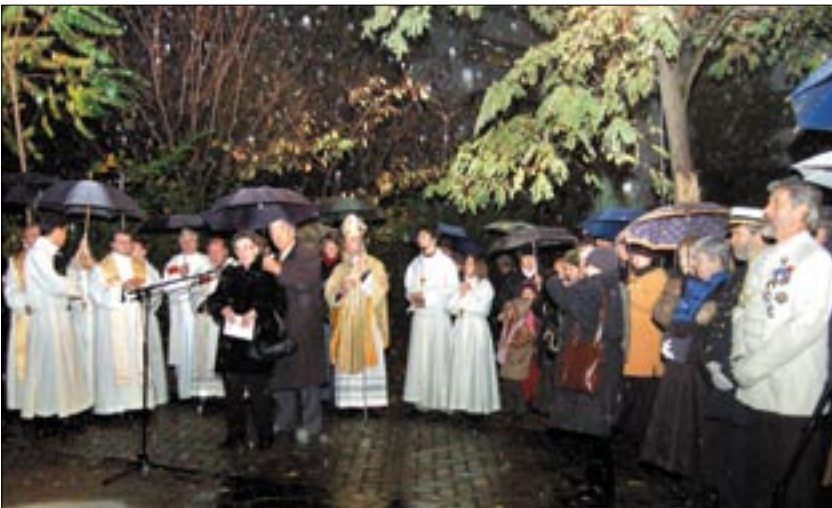
Az ünnepelőket a szakadó eső sem tántorította el