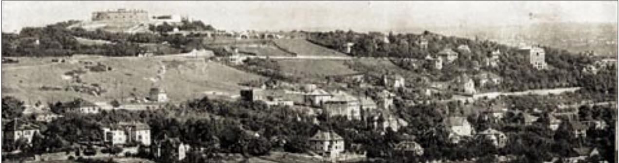
Kilátás a Zólyomi útról délkelet felé

Gazdag program a templomban és a gimnáziumban