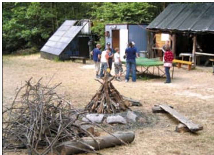
Tábornézés előtt szinte kötelező volt a pingpongzás