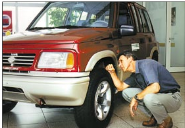
Akárholonnan is nézzük, jó választásnak tűnik

programokkal várták a gyerekeket is. Az akció lényege, hogy az érdeklődők diszkontáron – azaz beszerzési áron – típusonként eltérően, mintegy 150-190 ezer forinttal olcsóbban vásárolhattak Lianát, Jimnyt, Vitarát, Altot, Wagon R+-t és Ignist.