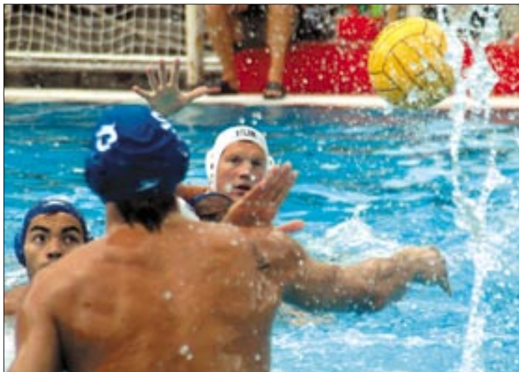
A válogatott keményen edz a Hajós Alfréd uszodában

– Nem vitás, nagy céljaink vannak, s ezért elég sokat meg is teszünk – vélekedett a Dominó-Honvéd hátvédje, a civilben abszolút úriember. – Számos, korábbi részsiker után a közel-múltban az Egyesült Államokban