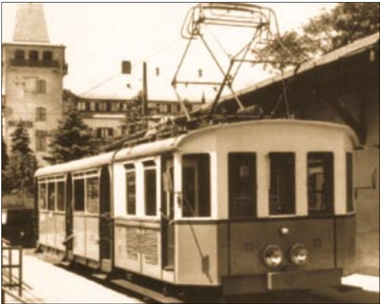
A BSzKRt 1929-ben villamosította a vonalat

Pityu atya, Rezesorrú Drámaíró és Tündérkém