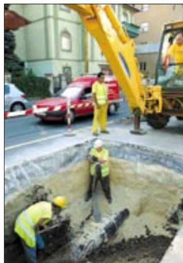
A munka lassan halad, mint a kocsior