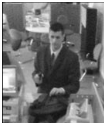
A rabló a biztonsági kamera felvételén

A képen látható ismeretlen tettes 2004. április 1-jén a Flórián tér 3. szám alatti Erste Bank kirendeltségét fegyverrel kirabolta. Az elkövető 175-180 cm magas, 25-28 év körüli, vékony testalkatú, vékony arcú, rövid, fekete, oldalt elválasztott hajú, fehér bőrű férfi. Ruházata: sötétkék öltöny, sötét derék alá érő szövetkabát, fehér ing, sötét nyakkendő, sötét nadrág, fekete cipő, hátizsák. Aki felismeri vagy információval tud szolgálni, értesítse a BRFK rablási osztályát a 443-5000/32-550-es telefonszámon, a 112-es segélykérőn, illetve a 06/80/555-111-es telefonszámon hívószámán. A nyomravezetőnek egymillió forint díjat ajánlottak fel.