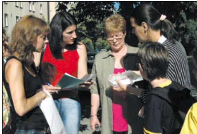
Veresné Krajcár Izabella alpolgármester a táborba induló fiatalokat búcsúztatja