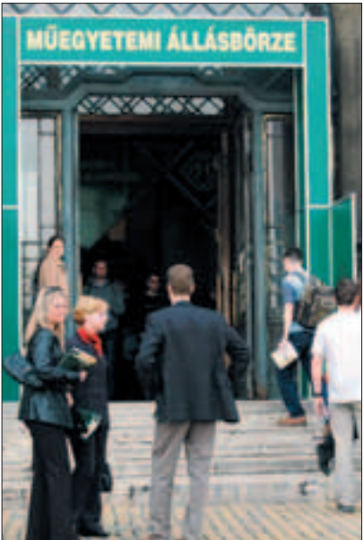
A fiatalok megtanulják érdekeik képviselését

Diákközpontja Karrier Irodájának vezetője lapunknak elmondta, fokozatosan átalakul a gazdasági szegmens: a nemzetközi cégek egyre inkább a tudásigényes ágazatokat telepítik Magyarországra – kutatási, fejlesztési bázisok, európai szintű kiszolgálóközpontok létesülnek hazánk-