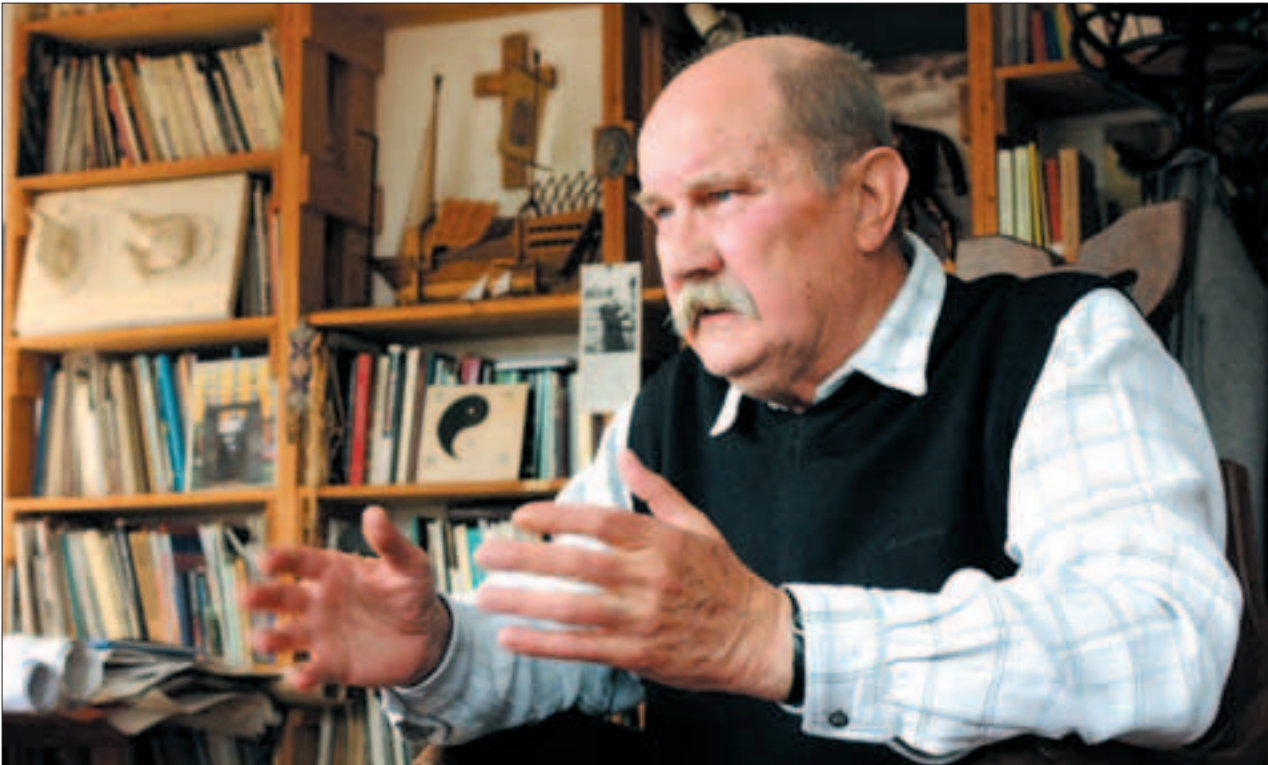
Szeretem ezt a vidéket, de olyan az egész körtér, mint egy nagy pályaudvar. A hatalmas kőtojások viszont tetszenek.

Igen. De jól meg kell szervezni, nem csak beszélni róla, hanem valódi lehetőséget kell biztosítani a részvételre.