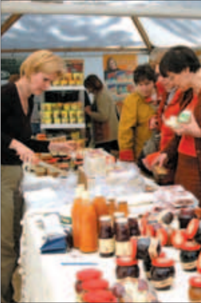
Kissé drágább, de ennyit megér a minőség