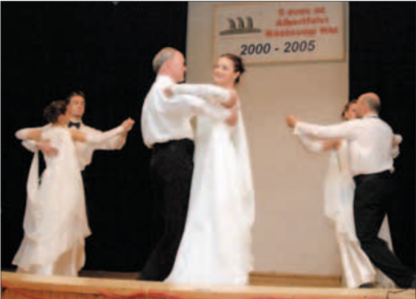
A legnagyobb sikert a táncklub aratta, mint legutóbb ugyanitt (sic!) a locsolóbálon

– Mindenkinnek joga és dolga, hogy megoldja saját és közösségének problémáit! – majd ki is fejtette állítását. Ha az