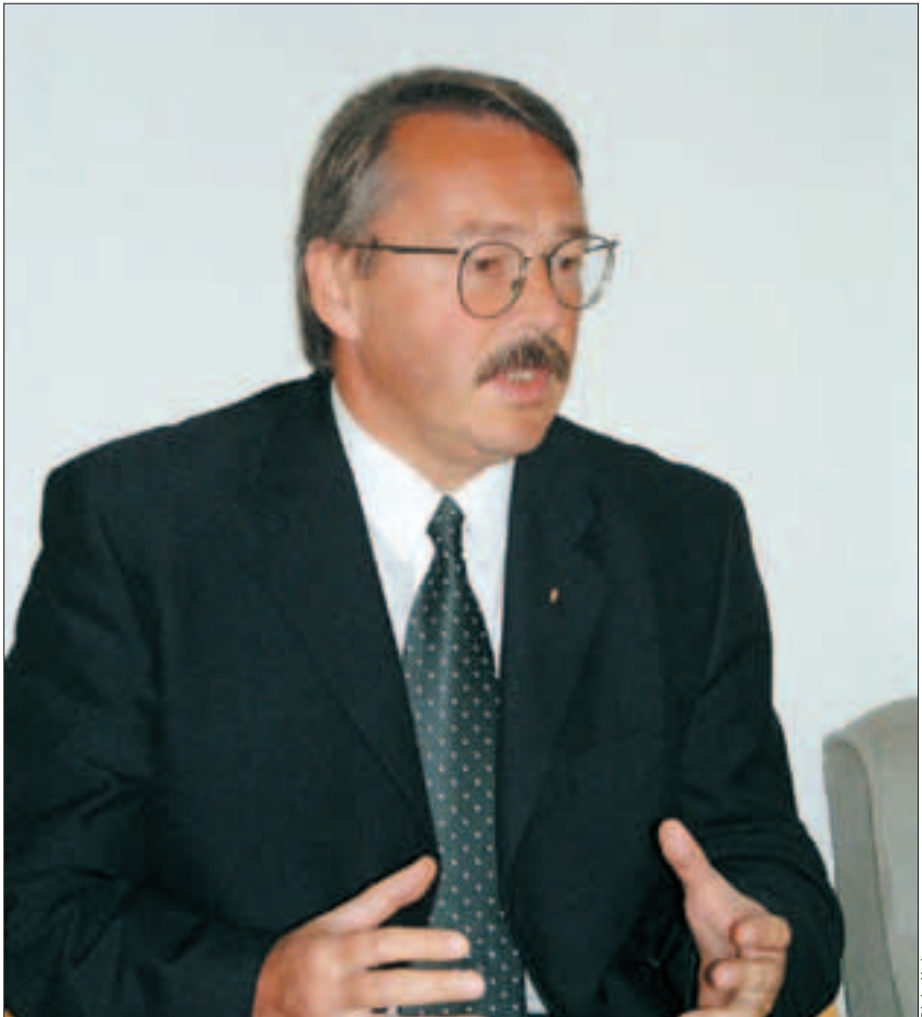
Csapody Miklós: Egyre több gondolkodó ember tanácsalan, hogy kire szavazzon

Ötven főnél kisebb frakció, tehát az MDF, de az SZDSZ sem tud önállóan köztársasági elnököt jelölni. Súlyom Lászlóról az MDF véleménye megegyezik a Védegy-letével, hiszen ő emberi és szakmai teljesítményével megfelel minden olyan kritériumnak, amit az összes párt felsorolt. Úgy pártsemleges és független, hogy bár az MDF oldalán részt vett a rendszerváltozásban, de amikor alkotmánybíró lett, elhagyta pártkötődését, és mivel konser-