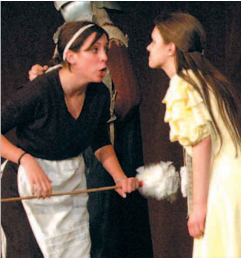
Carlo Goldoni: A régiséggyűjtő (Vörösmarty Gimnázium)

A találkozózn tizenhárom társulat mutatkozott be változatos műsorral. A sepsiszentgyörgyi Osonó Diákszínház ars poeticája szerint az előadás nem lehet kevesebb, mint önmagunk jobb és teljesebb megismerése. Ezt az utat kell feltárnia annak, aki színházzal foglalkozik – mondta a szintársulat egyik tagja. E gondolatok – melyek a nyilvános szakmai megbeszélésen hangzottak el – valóban jól kifejezik az ifjú színjátszók igyekezetét is. A fiatal szintársulatoknak az- zal a feladattal kellett megbirkóznium, hogy életet leheljenek a színjátékok leirt betűjébe. Egyfelől törekedniük kellett arra, hogy egy szervesen fejlődő színdarabot mutassanak be, amely önmagából építkezik, és az a játékidő teljes hosszában valóban lekö- se a nézők figyelmét, ne legyen üresjárat. Másfelől a nézőközönségnek elég szabad- sága legyen a művek befogadására is. „Az arany középut” keresésénél természetesen a színdarabok szerkezeti kérdései merül- tek fel az előadások problémájaként. Volt olyan előadás, amely hamarabb eljutott a végkifejlethez, mint ahogy a műsoridő be- fejeződött. (Osonó Diákszínház: Farsang), és volt olyan is, amelyik 75 perc alatt sem tudta megértetni, kik és milyen indítékok alapján részesei a színpadi történetnek. Az események darabokra hullottak anélkül, hogy a néző alkotó módon kapcsolódott volna be a mű újjászületésébe. (Yorik Tár- sulat Shakespeare átirata, Mindenki mást akar). Mentségükre legyen mondvá, nem