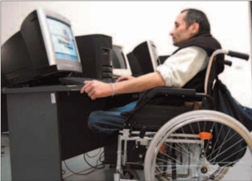
A mozgássérültek számára speciálisan kialakított számítógépeket szereztek be