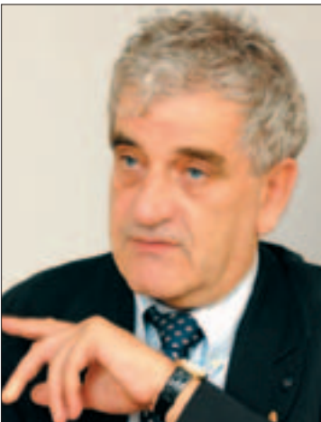
„Mélyen tisztetem Rubik Ernőt...”

Rubik Ernőt mélyen tisztetem. A cégünk egyik tárgyalója tele van számunkra fontos tárgyakkal, és a Rubik