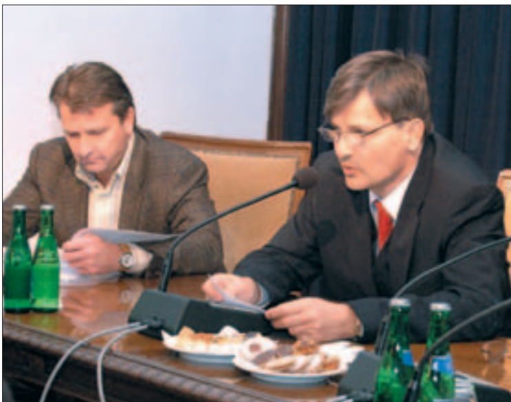
Molnár Gyula Újbuda polgármestere és Demszky Gábor főpolgármester