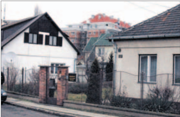
Felépültek a házak, visszafizették a kölcsönt, törölték a jelzálogot

A történet 1952-ben kezdődött, amikor a 2052/17/1952 sz. minisztertanácsi rendeletben meghirdették a bányász saját ház építési akciót, amely két évig tartott. A Nehézipari, a Bányászati és az Építésiügyi Minisztérium-