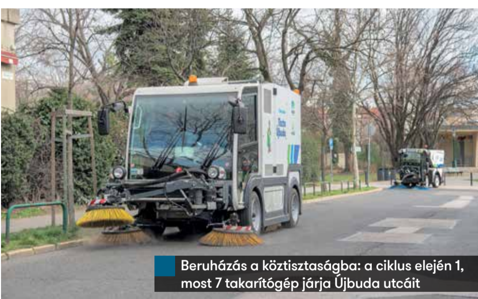
Beruházás a köztisztaságba: a ciklus elején 1, most 7 takarítógép járja Újbuda utcáit

biztosító Gyermekegészségügyi Központot. Büszkék vagyunk, hogy a budapesti kerületek között messze nálunk zajlott a legtöbb egészségügyi beruházás. Építettünk és felújítottunk játszotereket, az Ulászló utcában rehabilitáljuk a Saroktelket, ahol a korábban tervezett hatermeletes házak helyett parkot építettünk, pályázati forrásból bölcsőde, játszótér, rendelő létesül. Ez a lényeg, hogy a szép szavak, a színes lufik helyett a tetteinket kell, hogy elbírálják az emberek.