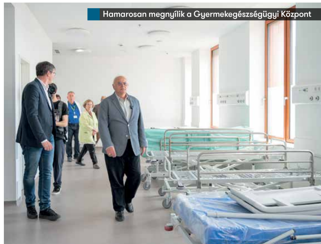
Hamarosan megnyílik a Gyermekegészségügyi Központ