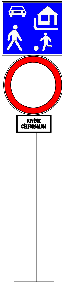
Sasad-Sashegy vizsgált terület határán elhelyezendő tábla a behajtók számára