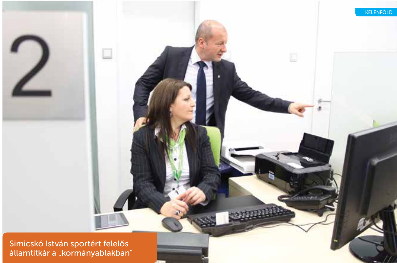
Simicskó István sportért felelős államtitkár a „kormányablakban“

a hipermarketben közvetlenül a pénztárakkal szembeni üzletsoron kapott helyet, így mostantól a bevásárlóközpontba látogatók az esti nagybevásárlás alkalmával is elintézhetik hivatalos ügyeiket. Rétvári Bence