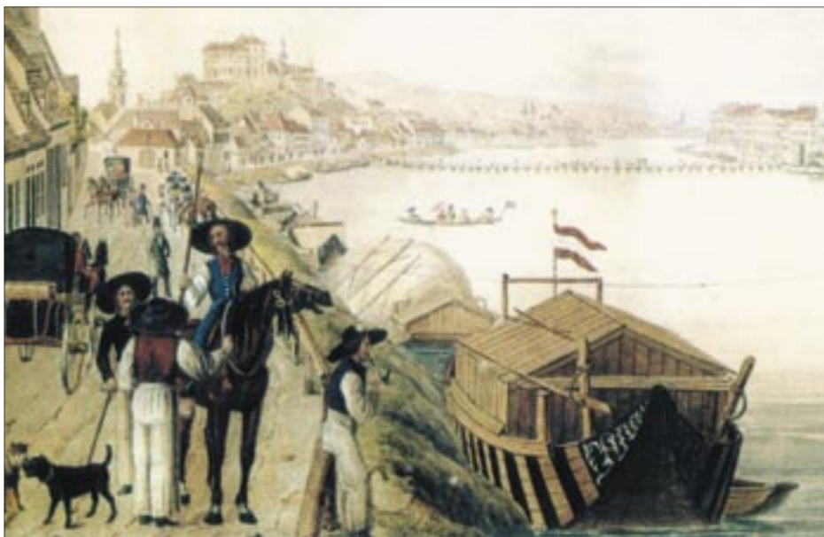
A Gellért-hegy lábánál élő rákok borkészítéssel és -kereskedéssel is foglalkoztak

A tatárjárást követően IV. Béla a vár megerősítése mellett a budai szőlők újratelepítéséről is gondoskodott. Ekkor már több, ma is ismert fehérborszőlő-fajta, a góher, a serbajor és a mézesfőér is termelt Gellért-hegy és a Sas-hegy lankáin. Buda történetével foglalkozó kutatók rámutattak arra, hogy az 1405 táján készült „Budai jogkönyvben” pontosan szabályozták a szőlőművelést, a bor mennyisége után kivetett adót pedig szigorúan beszedték. Ezzel egy időben azokat a kedvezményeket is rögzítették, amelyekkel a szőlőkertek művelését ösztö-