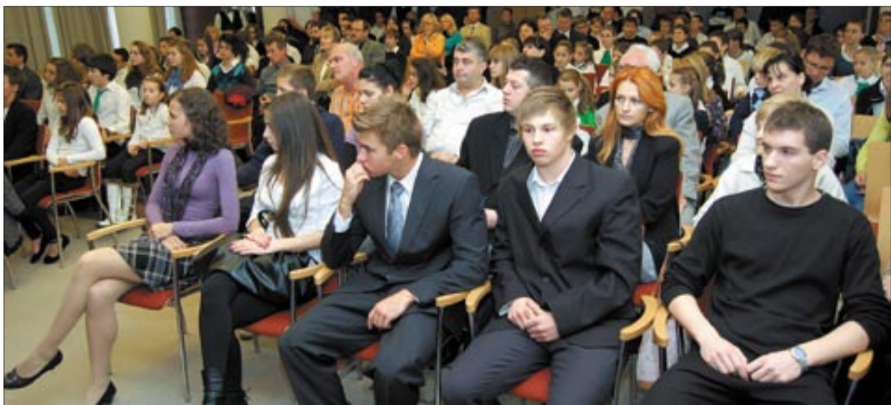
Az ösztöndíjasok és kitüntetettek