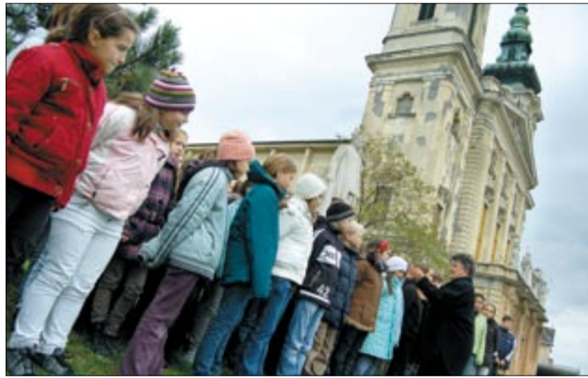
Iskolások tisztelegtek nagyformátumú államféri előtt