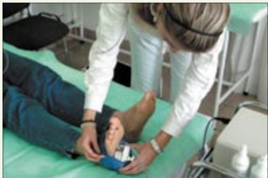
A 20 kezelés naponta 30-40 percet vesz mindössze igénybe

nem ismert, ezért kezelés nélkül álló érbetegség jelenti. Vajon csökkenthető-e a kockázat? Világszerte népegészségügyi felmérések bizonyítják, hogy a tünetmentes érbetegség szűrésével és az ezt követő megelőzéssel csökkenthető a keringési betegségek okozta szövődmények kialakulása. A tünetmentes személyeket bevonó szűrés során felfedezett betegek aránya a panaszokkal jelentkezőknek akár háromszorosa lehet. A betegség ugyanis képes megintgatni az ember mozgását, keresőképességét, nyugalomát. Az alsó végtagi érszűkület kezelésében egy olyan találmány áll már a betegek rendelkezésére, mellyel kiemelkedő eredményeket értek el. A Nashwan-ParasoundPlus eljárás egy olyan találmányról van szó, mellyel már több mint 20 nemzetközi díjat nyert el feltalálója, többek között 2009-ben lovagi rangot kapott munkájáért. Több száz beteg számolt már be jelentős mértékű javulásról, gyógyulásról. S hogy a kezelés miként zajlik? Nos, a diagnózis és a kezelés egyszerű, fájdalommentes, beavatkozással nem járó műszeres vizsgálatból és az azt követő húsz kezelésből álló fájdalommentes kúrából tevődik össze, napi egy kezeléssel. A kezelés a beszűkült érszakasz közvetlen közelében lévő mellék ereket keringésképzésre - azaz funkciótávitelére - készíti. A kezelés mindenki számára elérhető már az ország számos városában, Budapesten 5 helyen, többek között a XI. kerületben is. Felvilágosítás: www.medhungary.com vagy 06-70/210-15-13, 06-30/265-93-60, 06-20/327-68-35, 06-72/551-714