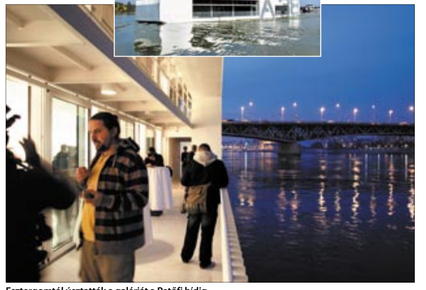
Esztergomtől úsztatták a galériát a Petőfi hídig