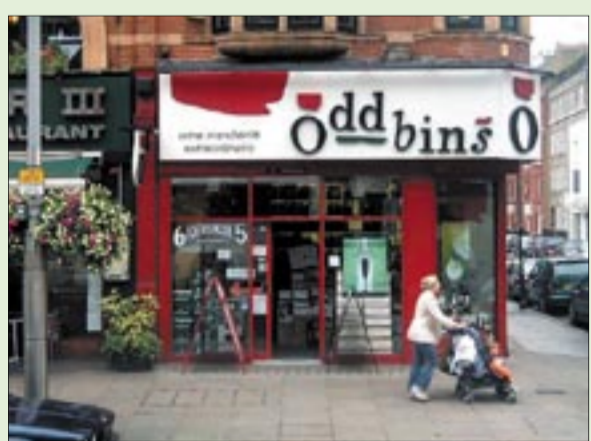
Az Oddbinsben élt az angolok lélegzete

„Mint korábban beszámoltam róla, bedörömböltem egy hosszú levél formájában az egyik nemzeti nagy borkereskedés két új tulajdonosához, hogy vessenek már egy pillantást a magyar lényra, mert van mögöttem egy ország, melynek borszáj az elmúlt két évtizedben csodát tették. Erre most borszájnak azt mondanák, hogy csak a dolgukat tették és teszik, mert végtelenül szerények. De ez nem csupán ennyi! Nem csupán szimpla egzisztenciateremtés. Ez a magyar táj magas