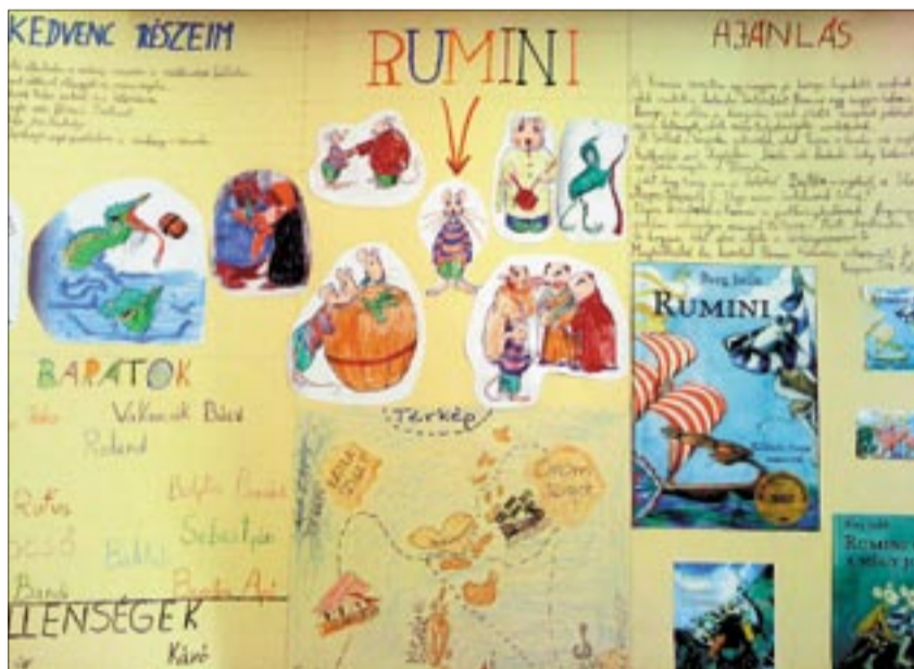
A Szilvásgombóc Galéria kiállításaihoz rendhagyó ábrázolásórák kapcsolódnak