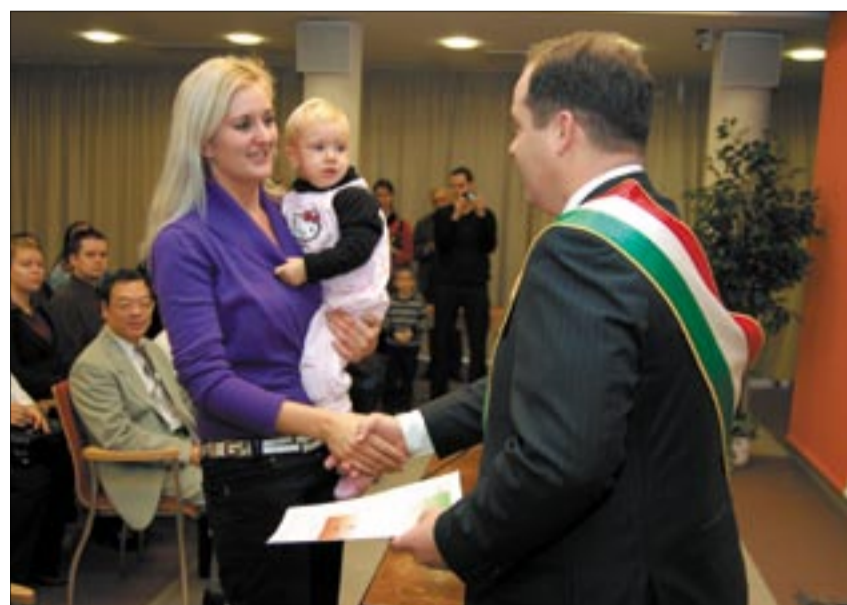
Januártól már nem kell megküzdeniük a határontúliaknak az állampolgárságért

Január elsejéig még bonyolult folyamatnak számít a határon túli magyaroknak