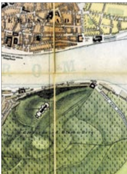
Szőlőtöke a Citadella körül egy 18. századi térképen

nözni tudták. A „vesszőzés” a lakosság nagy részének megélhetéséhez is hozzájárult. Vincellérek, kerülők, borbírák, cselédek, napszámosok laktak itt szépszámmal, vagy átjöttek Pestről, ha szükségük volt a Gellért-hegy mögött húzóó földel-