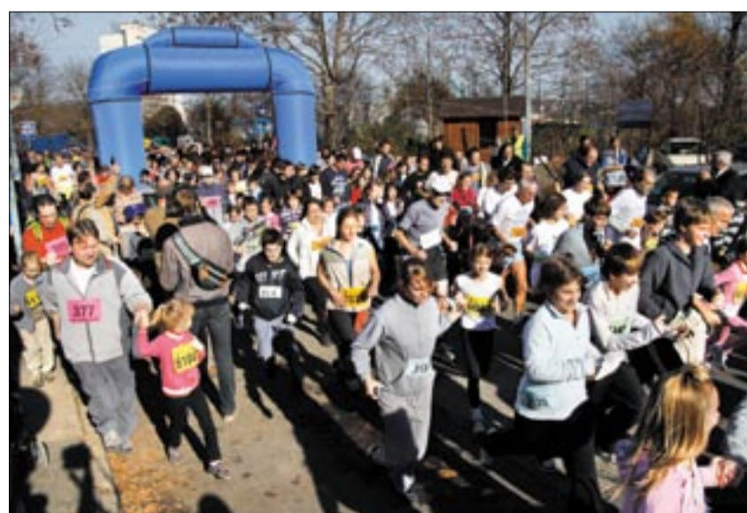
11 óra 11 perckor elstartolt az ezer futó

koztak a kezdeményezéshez. A célban ritmikus sportgimnasztika bemutatásával, verseny aerobikkal és táncbemutatóval várták a két és fél kilométeres távot telje-