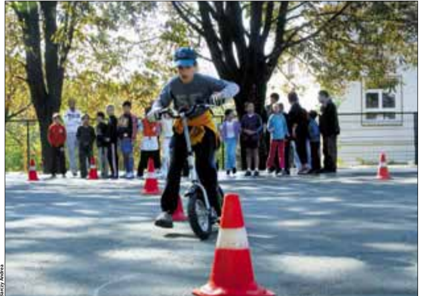
Több mint negyven intézményt érint a sportudvarprogram

Minden egyéb probléma feltárására is jó eszköz a zölde szám, nagyon hasznos, hogy szinte azonnal jelzik a lakók, ha valahol megoldandó problémával találkozunk. Ugyancsak a civil szférának adunk teret a Közös Képviselő Klubjában, ahol hónapról hónapra szakemberek bevonásával tisztázzuk a lakóközösségeket érintő kérdéseket. Ráadásul itt nem is csak az információ játssza a főszerepet, az is fontos, hogy egy-egy ügyben legyen mód a későbbi visszacsatolásra, amely újabb segítség a továbblépéshez. Természetesen a nagy beruházások és városfejlesztési elképzelések kapcsán rendszeresen tartunk vitafórumokat, amelyeken bárki elmondhatja építő jellegű véleményét. Ami engem illet, én a személyes találkozások híve vagyok, még akkor is, ha fontosnak tartom az internetes kapcsolatokat is. Nem véletlen, hogy a magyar politikusok között azon kevesek közé tartozom, akik aktuális, friss és informatív saját honlapot ( www.lakos.hu ) működtetnek. Viszont a hivatali fogadóórát és lakossági fórumok nem helyettesíthetők, inkább csak kiegészíthetők ezzel a modern kommunikációs csatornával.