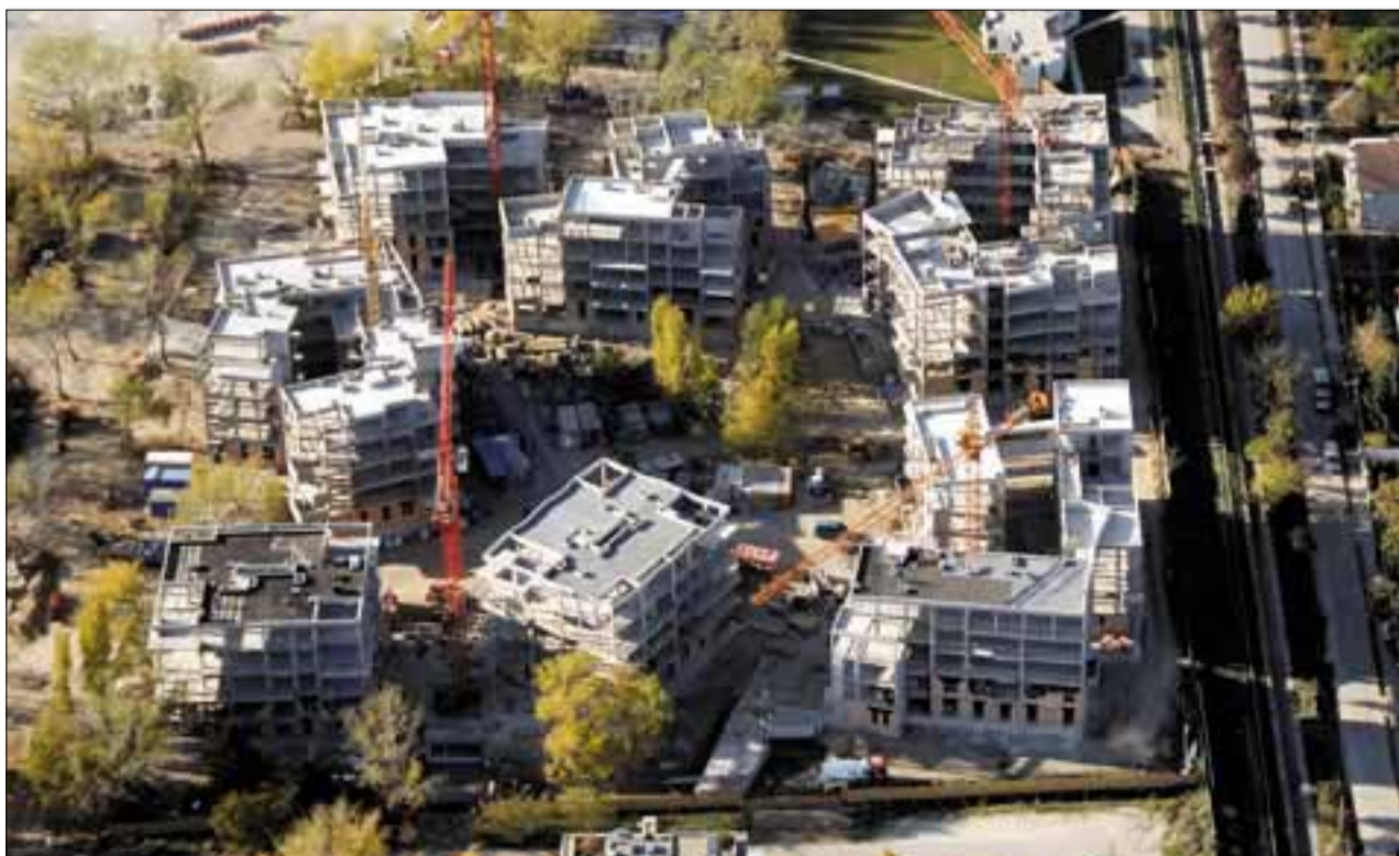
A beruházók a környezet megújításában is szerepet vállalnak (képünkön az épülő Sasad Liget)