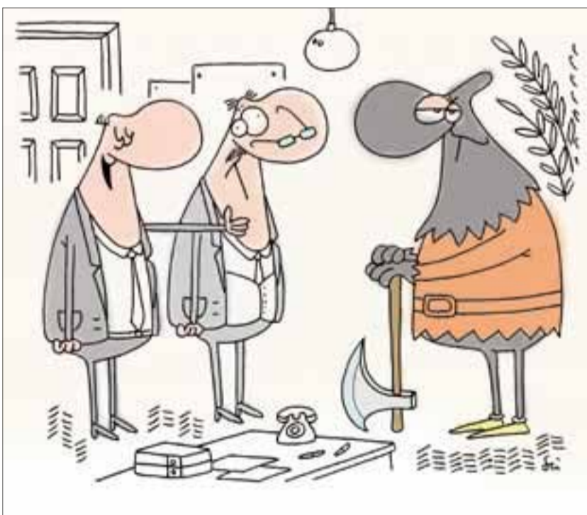
– Hadd mutassam be az adóbehajtásról új munkatársunkat, Szabó kollégát.