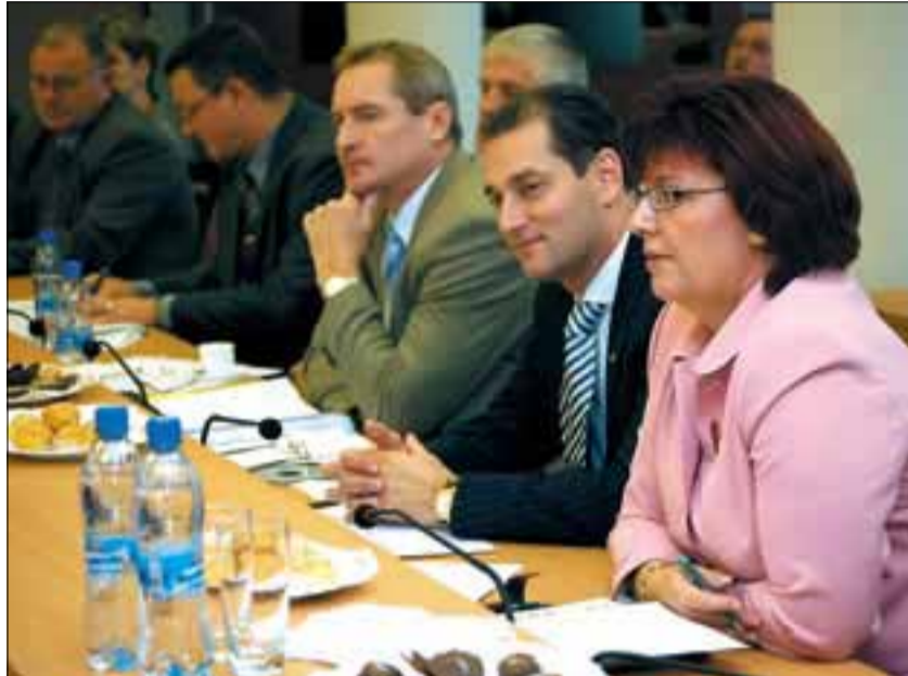
Tanácskoznak a fővárosi polgármesterek