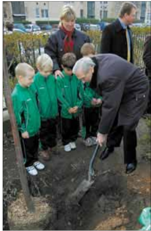
Grosics Gyula és az elsősök közösen elültették a fát