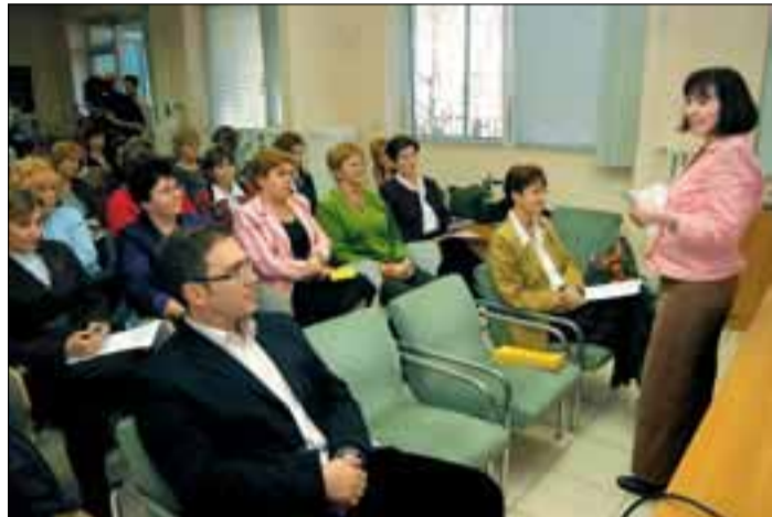
A kerület pedagógusai megosztották egymással az innovatív ötleteiket