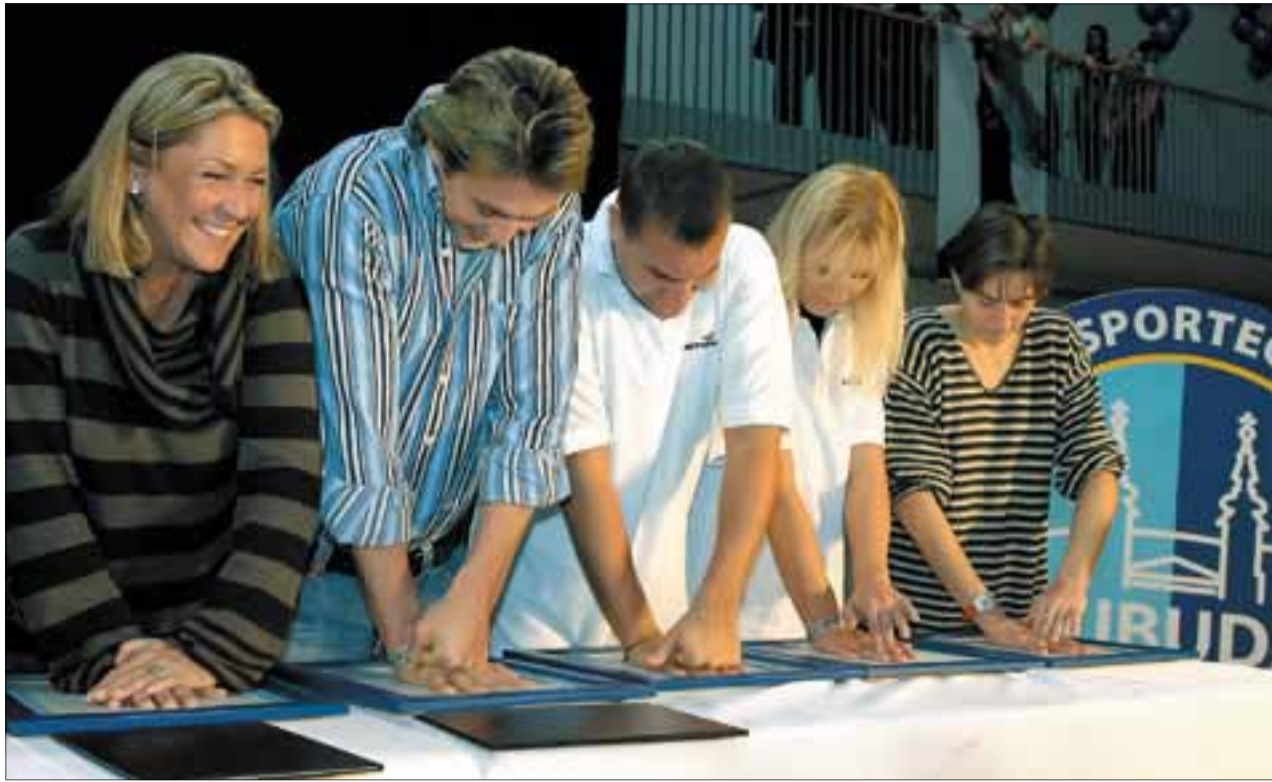
Az alapító sportolók kézlenyomata is megmarad az utókornak