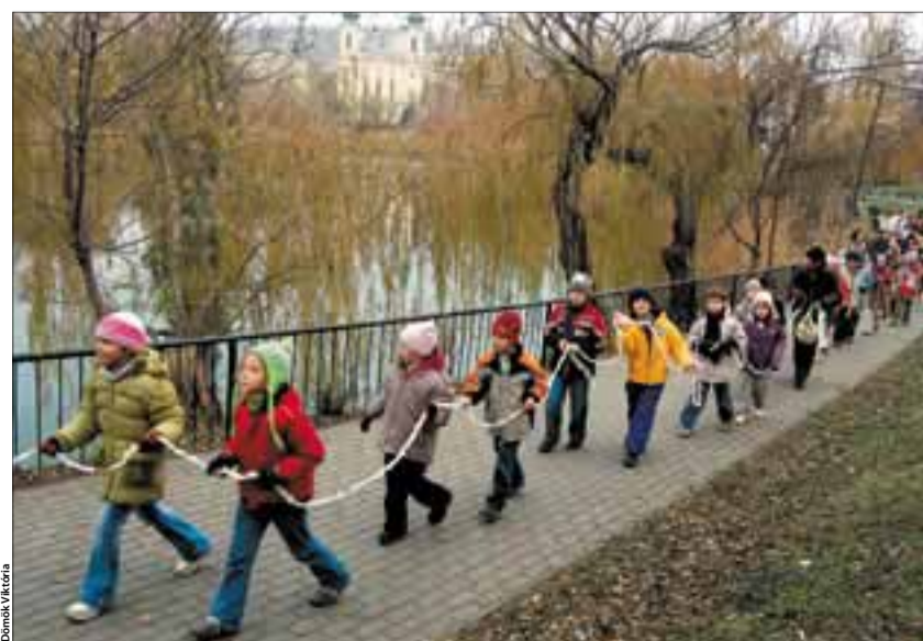
A kerületi iskolások lelkesen vettek részt a karácsonyi füzérgyártó versenyben. A leghosszabb alkotást, egy 570 méteres girlandot, a Bethlen Gábor Általános Iskola tanulói készítették. Alkotásuk a Kosztolányi téri Újbudai Karácsonyi Randevű 2007 fényét emeli.