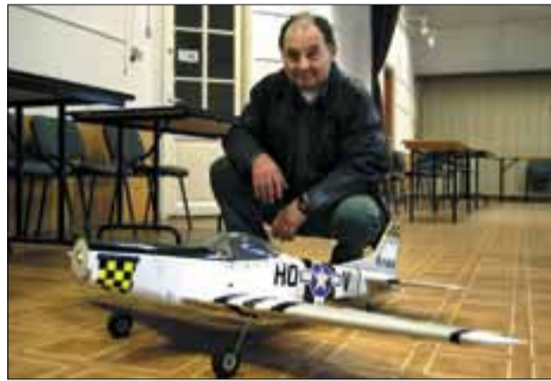
Egy a sokféle modell közül

November 17-én, szombaton is közlekedési gócponttá vált a Gyékényes utca. Kora délelőtt már nem akadt szabad parkolóhely, ráadásul a sofőrök nemcsak különböző méretű autókkal érkeztek, hanem motor, repülő, helikopter, vonat, hajó és