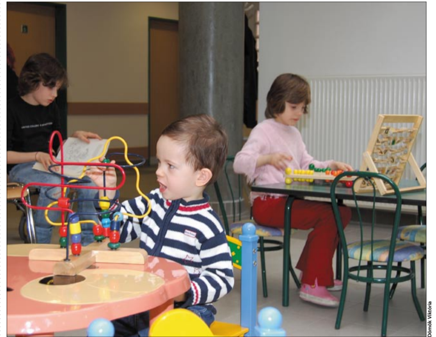
GYERMEK SZAKRENDELÉSEK A kis betegeknek megkönnyíti a várakozást a sok szép játék

Az intézetben továbbá angiológia, audiológia, belgyógyászat, EKG, érsebészeti vizsgálat, felnőtt és ifjúsági fogászat, fizioterápia, fogászati röntgen, foglalkozás egészségügy, foniátria, fül-orr-gégészet, gyógytorna, ideggyógyászat,