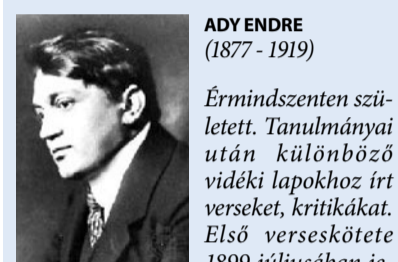
ADY ENDRE (1877 - 1919)

FÜGGŐLEGES: 1. Nemesfémekkel dolgozó iparos. 2. Gyermük! 3. Rövidítés orvos neve előtt. 4. Átkarol. 5. Szurkoló öröme-bánata.