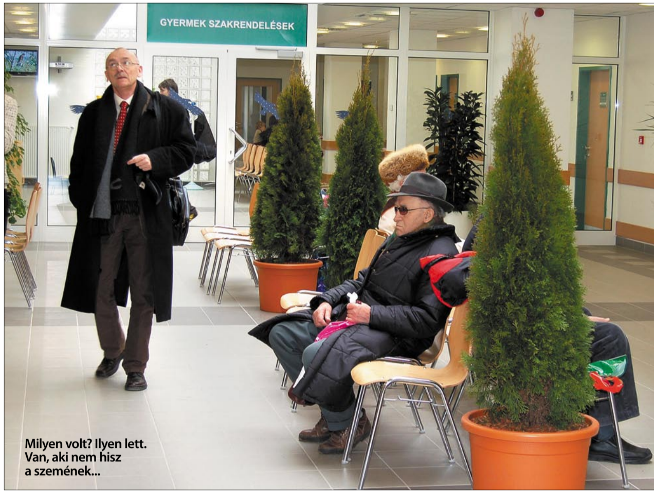
Milyen volt? Ilyen lett. Van, aki nem hisz a szemének...