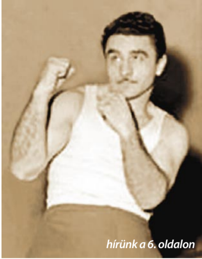
hírünk a 6. oldalon

Táblát helyeznek el a Mányoki utcában a legendás ökölvívó, Papp László tiszteletére