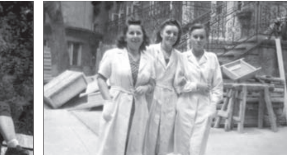
A Trefort utcai rendelőintézet udvara. A „három nővér” 1944-ben, Budapesten.

Trefort utcai rendelőintézetében. 1944-ben, a légiriadók idején is ott dolgoztam. Emlékszem, német katonatisztek is lejöttek az óvóhelyünkre. Különösen az volt közülnk ellenszenves, aki a légítámadás idején a „német faji tisztaságról” magyarázott nekem, a magyarságot pedig azért szidalmazta, mert oly sok népet befogadott. Később már nem tudtam eljutni a munkahelyemre, mert a Budafok felől közeledő orosz csapatok elértek a Bánát utcát is, akik ellen – emlékszem – a csatározások vége felé már civilek har-