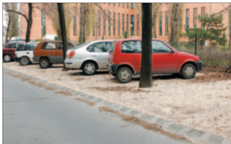
Murvázott parkoló a Bártfai utcában