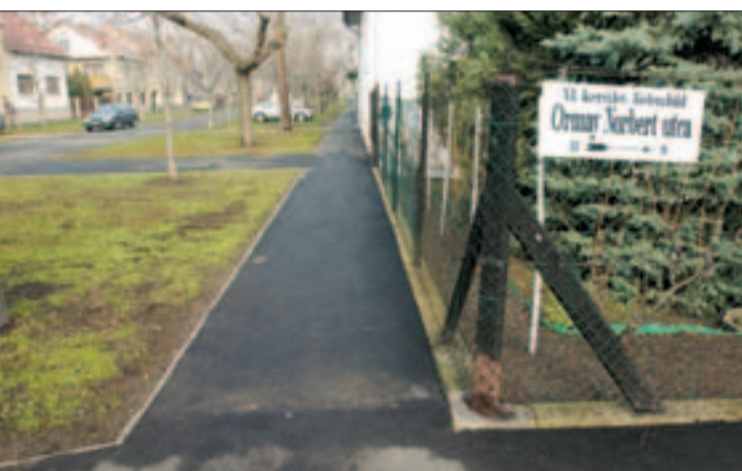
Az új gyalogjárdák egyike az Ormay utcában