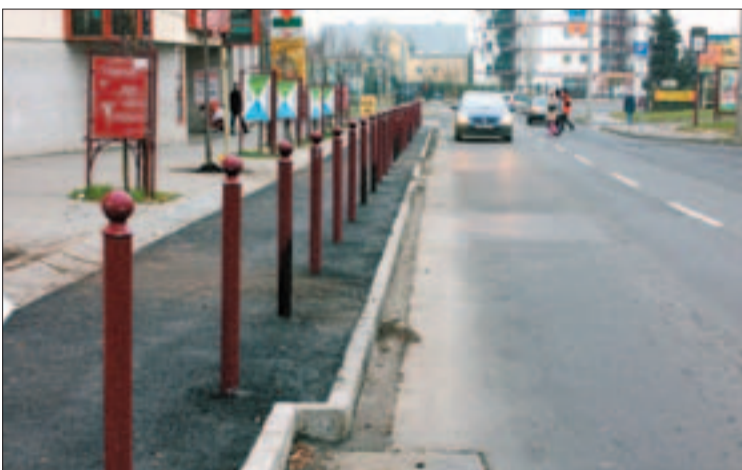
Új járdát kapott a Rétköz utca is