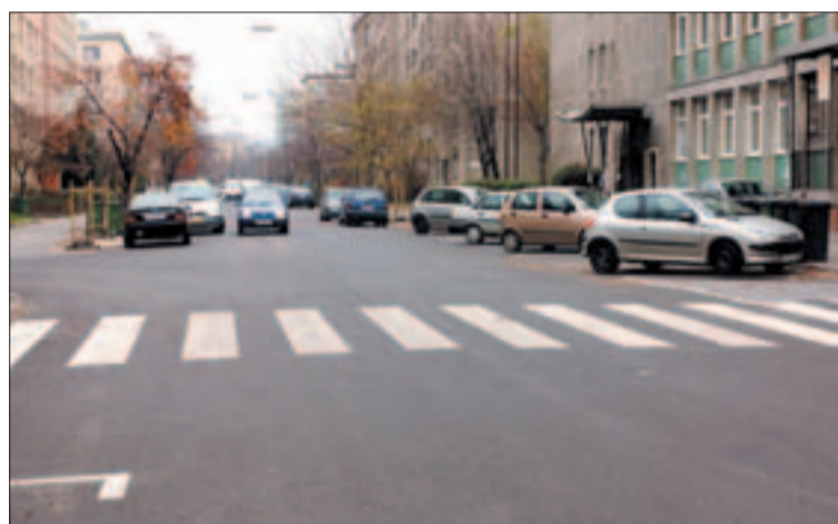
Kifogástalan az aszfaltszőnyeg a Baranyai utcában