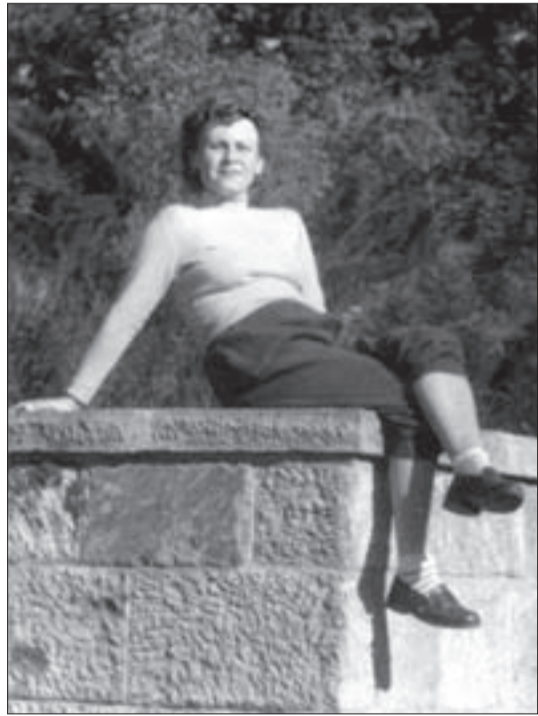
1956, Királyrét. Hamarosan kitör Pesten a forradalom.

szalonnát, kolbászt, kenyeret és konzerveket viszonzásul. Ez volt akkor a háború a frontvonalon, testvérek álltak szemben egymással, akiket ugyanolyan anya szült. Amikor aztán megindult a támadás, a Sopron úti iskola udvarára hozták be a rengeteg sebesültet, ott kötöztem be őket. Nem mindig tudtam segíteni. Katonaorvosunk már nem volt, a súlyosabb sebesülteket Budafokra kellett elszállítani. A