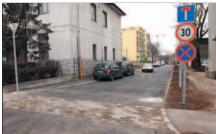
A Névtelen utca korábban földút volt