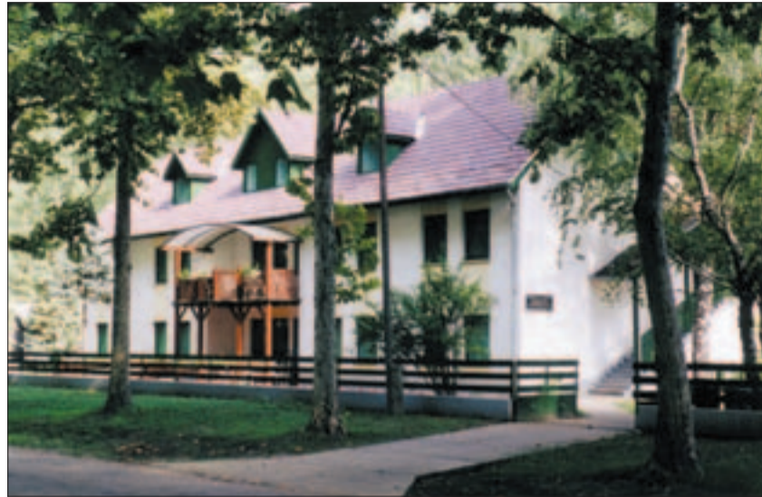
A soltvadkerti családi üdülő

Az önkormányzat üdülője egy két-szintes ház, tetőtér-beépítéssel. A ház körül kialakított park az autók parkolására