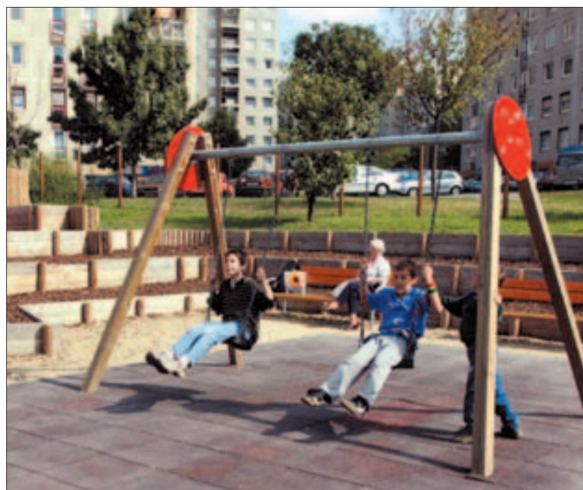
Játékok és gyerekek a Torbágy utcai parkban

A Fővárosi Önkormányzat Stratégiai Alapját kell még megemlíteni. Ez nagyon kedvező finanszírozási lehetőséget biztosít, hiszen a 90 százalékos fővárosi források mellé csak 10 százaléknyi saját erőt kell felmutatni. Ez a lehetőség azonban csak a kész tervdokumentációval és érvényes engedélyekkel rendelkező útfelújítási projektek megvalósításához vehető