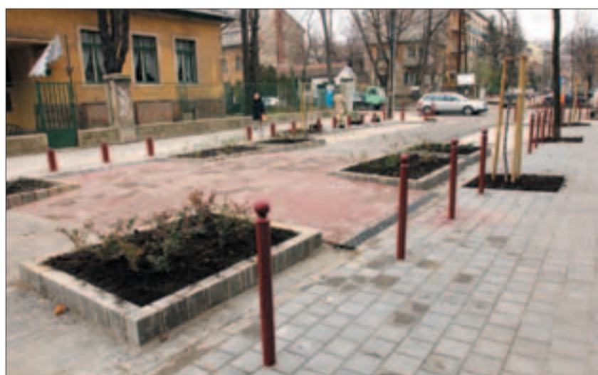
A Dávid Ferenc teljes felújítása: az út, a járda és a parkoló egyszerre készült el