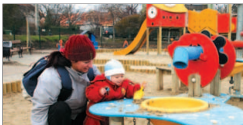
A Kilitó tér játszótéren érdekes játékokat kapott. A szép környezet kellemes időtöltést ígér