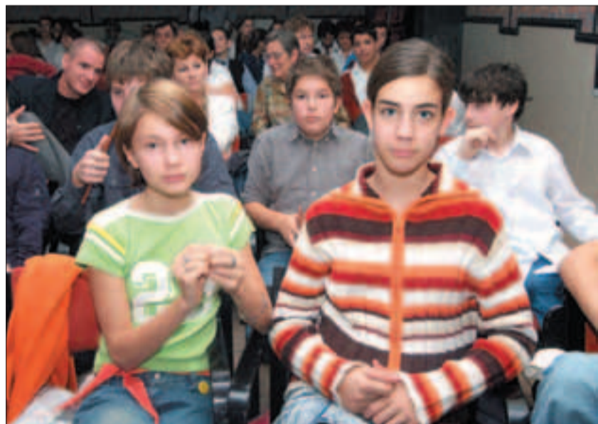
A diákok 2-3 fős csapatokban indulhattak a versenyen

Október 27-én, csütörtökön formabontó tanórán vehetett részt a kerület ötszáz diákja a Corvin Filmpalotában. Az '56-os események évfordulója alkalmából Koltai