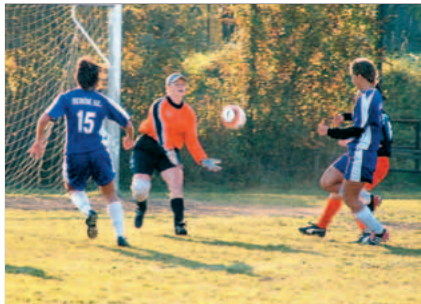
Önfenntartók: A lányok ügyesek, lelkesek, ... és még a költségeket is ők állják.