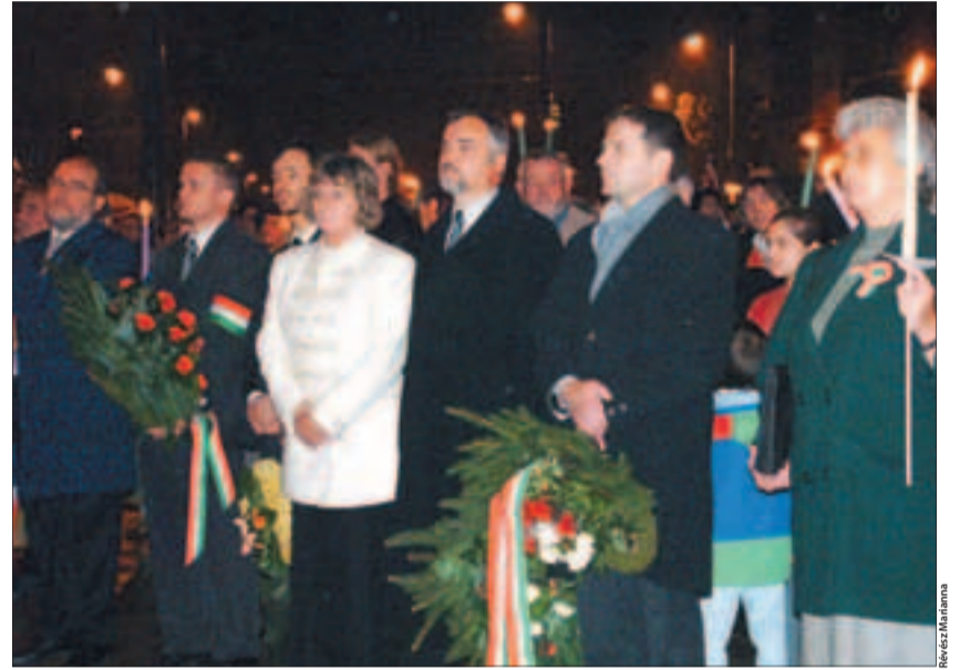
A konzervatív pártok a Szent Imre-szobornál koszorúznak

előtt tartották meg az '56 – Újjászületés című rendezvényt a Fidelitas, az Áprilisi Ifjak és az Ifjúsági Kereszténydemokrata Szövetség szervezésében. Ezen a szónok Orbán Viktor volt.