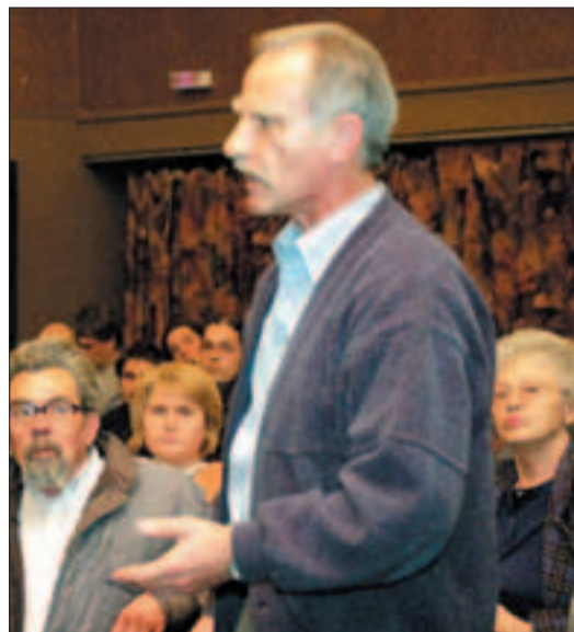
Mindenki ragaszkodott a maga igazához