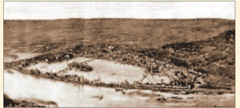
A lágymányosi vízi látványosság látképe egy korabeli újságképen

Május havában a főváros tiz kerületéhez csatlakozik egy új XI. kerület. Egy teljesen új város: „Konstantinápoly Budapesten”. A Dunagőzhajózási társaság új menetrendjébe már beiktatta ezt az új kikötő helyet, módot adván, hogy a főváros bármely pontjáról a közönség néhány perc alatt Konstantinápolyba utazhassék. A „Konstantinápoly Budapesten” területén két helyen köt majd ki a hajó. Az egyik kikötő már teljesen kész, a másik közeledik a befejezéshez. Egy kikötő nem bírja meg a kitóduló sokaságot: hiszen a vállalat 3 külön hajója is igényel külön kikötőt. A közigazgatási hatóság a napokban tartott vizsgálatot a „Konstantinápoly Budapesten” területén. Megvizsgálta az új kábel-vezeték, amely a vilámos világitást szolgáltatja s megtette a javaslatokat a közrend fenntartása érdekében. A hatóságok kiküldöttjei elismeréssel nyilatkoztak a gondos építkezéssről az épületek diszéről. (Fővárosi Lapok, 1896. április 26.)