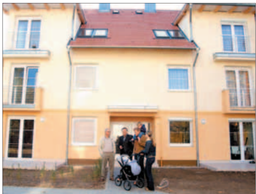
Buda-Hold siker. Az elkészült lakások mind rögtön elkeltek.

ingatlanpiaci helyzete, jelenleg pedig lehangelő az állapota. A kisvárosias építési forma, a megőrzött nagyméretű udvar lehetővé tette, hogy még az Andor utcában is 330 ezer forintos, igen jó négyzetméter áron keltek el a lakások. A Buda-Hold Kft. nem kis, átmeneti letelepedésre szánt garzonokat adott át, hanem átlagosan 60 négyzetméteres lakásokat, és az épületben kétszintes, 80 négyzetméter nagyságú