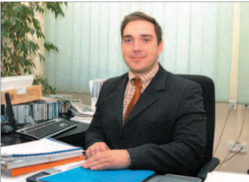
Közbiztonság: Az embereknek érezniük kell, hogy vigyáznak rájuk.