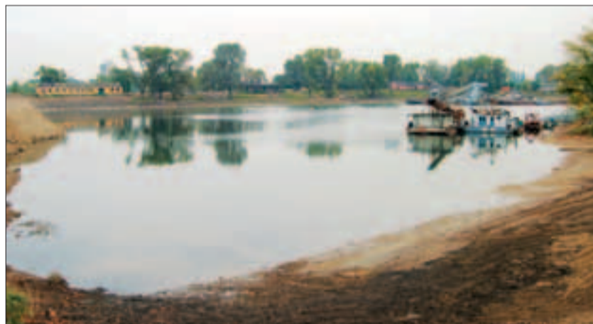
Jövő nyáron az öböl ezen részét strandolók hada fogja ellepni.