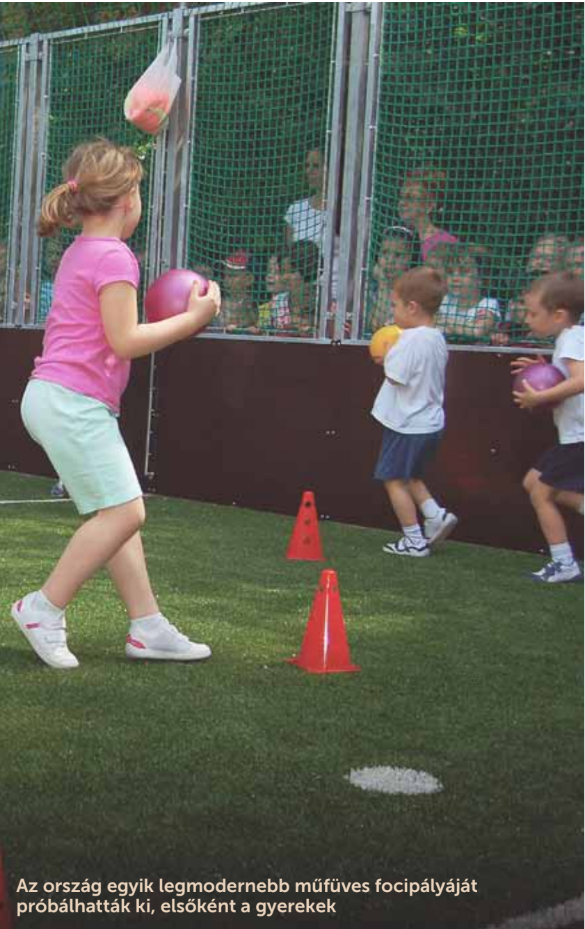
Az ország egyik legmodernebb műfüves focipályáját próbálhatták ki, elsőként a gyerekek

mel kapcsolatos ismeretterjesztést nyújt, ugyanakkor egy kellemes időtöltést is jelenthet a szabadba vágyóknak. A kétórás túra során 12 állomás fogadja a kirándulókat, iskolai csoportokat, ahol információs táblák mutatják be az erdő lakóit, növényvilágát és a térség földtani adottságait.