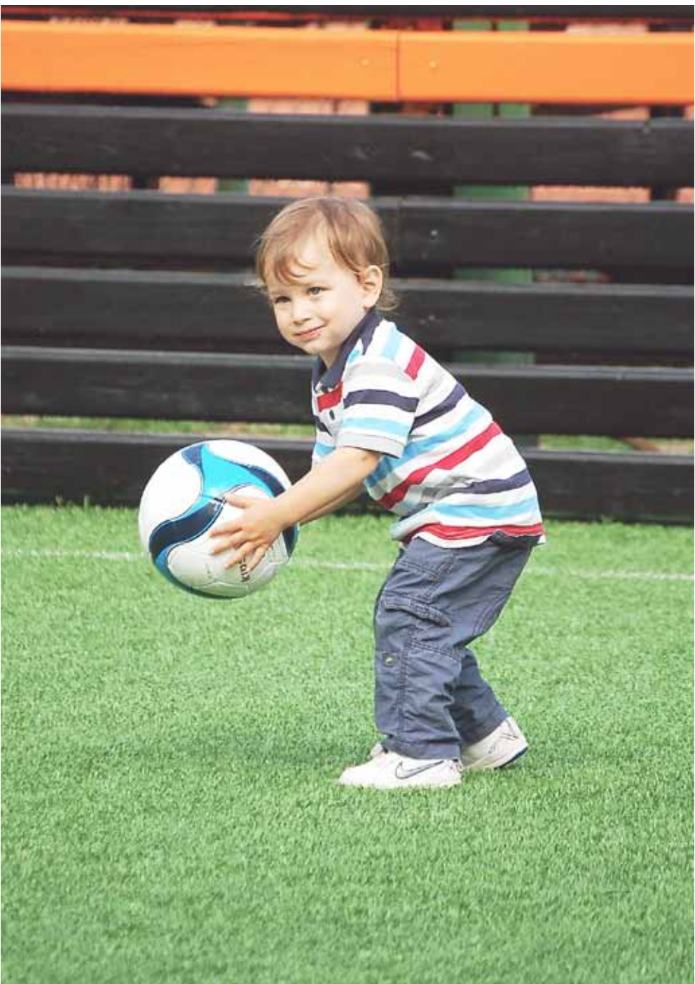
Összeállításunk a 6–7. oldalon.

– Újbuda Önkormányzata mintegy 27 millió forinttal járult hozzá az új székhelyül szolgáló épület teljes körű felújításához – mondta akkor a polgármester. Az új központ az Erőmű utca 4. szám alatt található egy épületben az Újbudai Pedagógiai Intézettel és az Újbudai Nevelési Tanácsadóval.