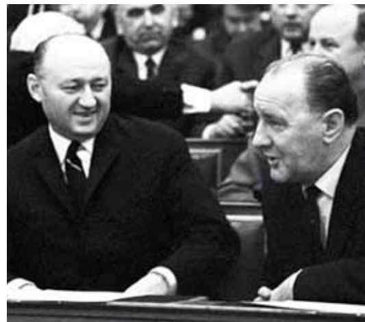
Fotónkon Biszku Béla (balra) és Kádár János látható.

Részlet Csorba Emánuel: Apa és fia című 2009-ben megjelent könyvéből: „Szerintük mi osztályidegenek vagyunk. E gyűjtőfogalom magában foglal minden rosszat, ez megbocsáthatatlan és gyógyíthatatlan vérébaj. Súlyosabb bűn, mint a rablóiábránd, mert a gyilkosnak kilátása van 15 évi börtönbüntetés után a társadalomba visszatérni, de az osztályidegen életfogytiglan ki van zárva. (...) az osztályidegen már születése pillanatában megkapja a stigmát - főiskolát nem látogathat, magasabb szellemi munkakört nem tölthet be, és elhelyezkedésnél szülei osztályidegensége az úgynevezett káderezés tárgya.