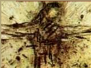
Salvador Dalí: Krisztus János apokalipszise, 1958

Szeretettel várjuk Önt és barátait előadás-sorozatunkra a BERTALAN LAJOS UTCAI BIBLIA-HÁZBA