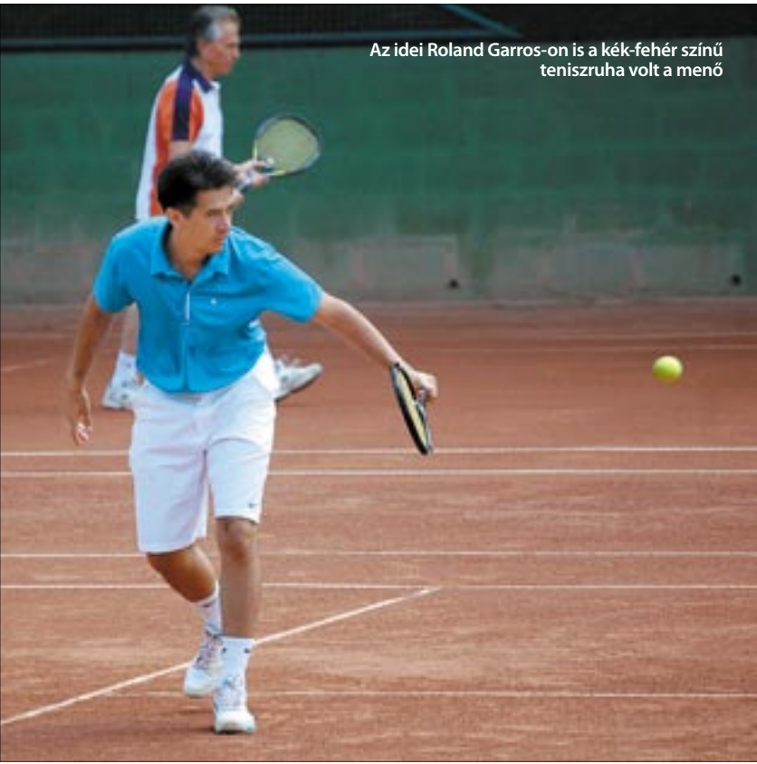
Az idei Roland Garros-on is a kék-fehér színű teniszruha volt a menő

Újabb divatos mozgásformák jelentek meg az edzőtermekben: a zumba és a kangoo. Nyugodt szívvel kijelenthetjük, jelenleg ez a két legnépszerűbb fejlesztés a fitneszvilágban.