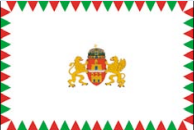
Budapest új lobogója

A városatyák mintegy száz napirendi pontot tárgyaltak meg a Fővárosi Közgyűlés június 22-i ülésén. Döntöttek Budapest új lobogójáról. A vörös, arany(sárga), égszínkék zászló erekleként, mellérendelt feladatkörben kap szerepet ezután a Fővárosi Közgyűlés ülésein és más ünnepi alkalmakkor. A