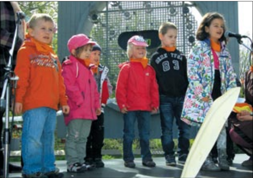
A legkisebbek is hatalmas lelkesedéssel készültek az egész napos rendezvényre

Mint minden évben, idén is koszorúztak az örmezei Költők parkjában a költészet napjának tiszteletére. Ezúttal első alkalommal egy nagyszabású program is kísérte a megemlékezést: az Örmezei Közösségi Ház és az Örmezői Morus Szent Tamás Egyesület közösen hirdették meg a versmondó maratont, melynek sikere minden várakozást felülmúlt. A maratont Kupper András alpolgármester nyitotta meg és köszöntötte Zelk Zoltán özevegét, Sinka Erzsébetet. Kedvenc Nagy László-költeményével maga is csatlakozott a szavalókhoz.