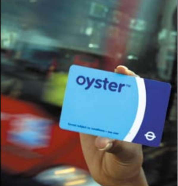
Nagy-Britanniában évek óta kiválóan működik az elektronikus jegy

A képviselők arról is döntöttek, hogy a Tudományos Akadémia előtti Roosevelt teret átkeresztelik Széchenyi térre. A változtatást az akadémia elnöke kérte. A döntés előtt egyeztettek az amerikai nagykövetséggel is: a volt amerikai elnökről egy