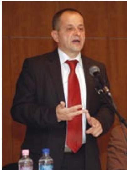
Budai Gyula kormánybiztos

Simicskó István országgyűlési képviselő a Budafoki úti Fidesz-iroda soron következő lakossági fórumára Budai Gyula elszámoltatásért felelős kormánybiztost hívta meg, hogy tájékoztassa a kerület lakóit munkája eredményeiről. A kormányzati megbízott jelentős sikerekről számolt be, és arról biztosította a megjelenteket, minden korrupciógyanús ügyet kivizsgál.