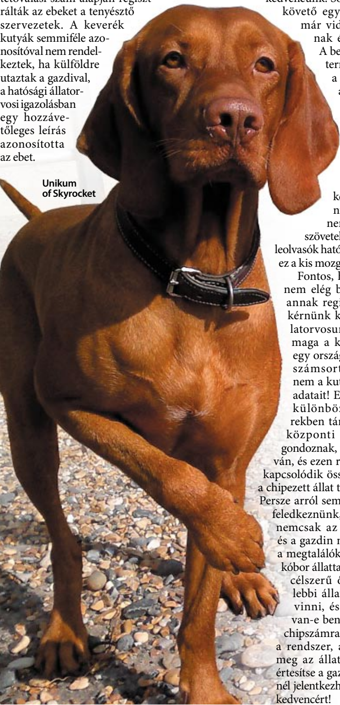
Unikum of Skyrocket

Ma már egy mikrochippel rendelkező, megfelelően regisztrált kutya a megtalálást követően öt-tíz perc alatt visszajuttatható gazdájához, hiszen az állatorvosok olyan egyedi azonosítóval látják el kedvencünket, melyet nehéz meghamisítani vagy nyom nélkül eltüntetni. A chip egy rizsszem méretű eszköz, melyet az állat bőre alá ültetnek be. A parányi, szövetbarát kapszula egy antennából és egy mikrochippből áll, és egy 15 számjegyű egyedi kódot tárol. A kapszula anyaga nem vált ki ellenreakciót a szervezetben, így az a beültetés helyén – Európában a nyak bal oldalán – szépen megtapad.