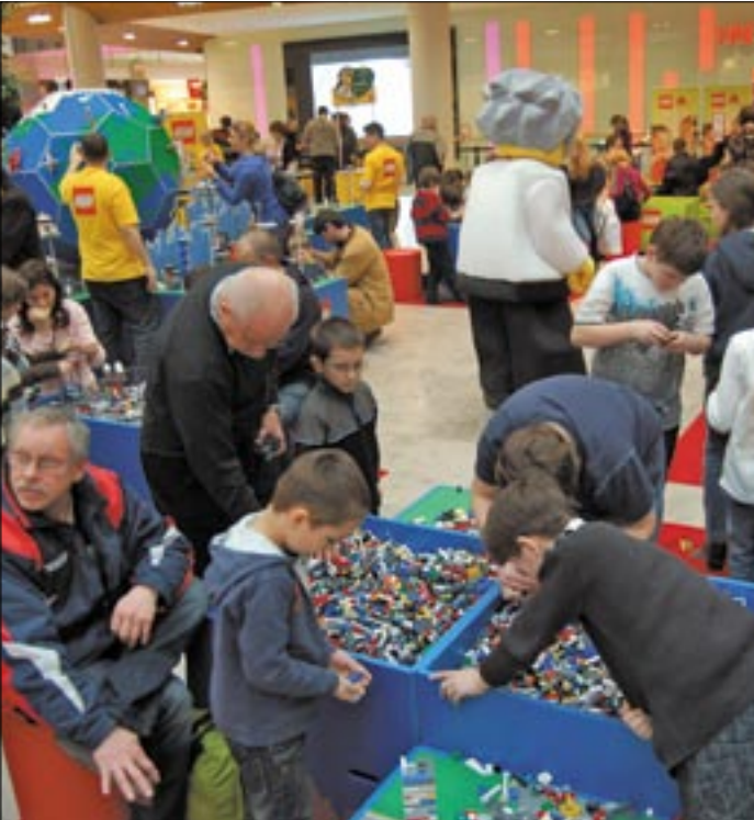
A LEGO végtelen lehetőségei minden korosztályban hódítanak

A március 12–13-i hétvégén Újbudán tartották a Holnemvolt Fesztivált, Magyarország első nemzetközi mesemondó találkozóját az Evangélikus Egyetemi és Főiskolai Gyülekezet székhelyén. A paletta igen széles volt, hiszen többek között magyar, székely, észak-európai, kreol, cajun és osztrák meséket ismertettek meg a mesemondók közönségükkel a kétnapos rendezvény alatt.