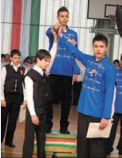
Nagy sikert aratott a diákok előadása