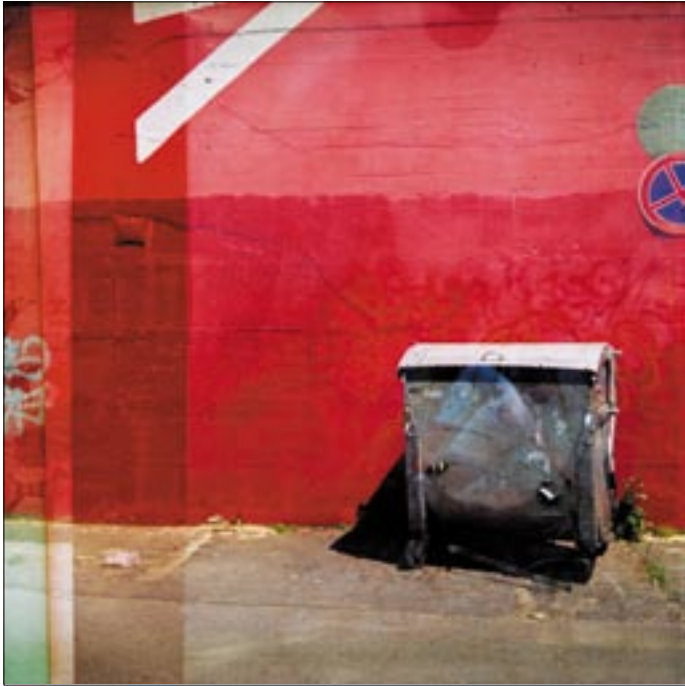
Egymásra exponált két fénykép