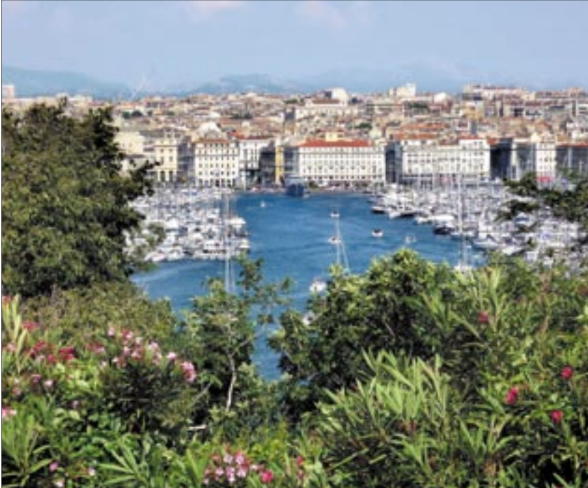
A zsúfolt kikötők környékén is burjánzik az illatos mediterrán növényzet