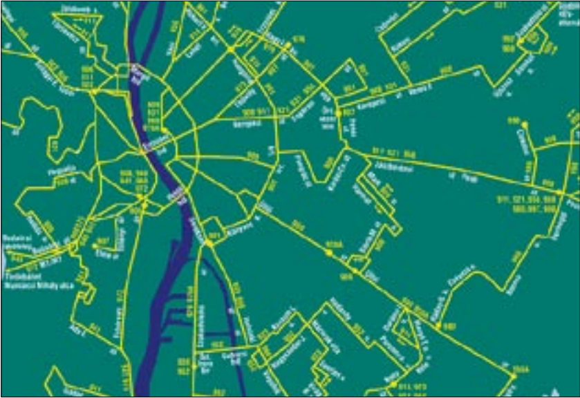
Egy központ szervezi majd a budapesti tömegközlekedést

Egy másik új céget is alapított a közgyűlés, a Budapesti Közlekedési Központ Zrt.-t. Ennek vezetője Vitézy Dávid , a Városi és Elővárosi Közlekedési Egyesület eddigi szóvivője, a BKV fideszes felügyelőbizottsági tagja lett. Az ellenzéki képviselők bírálták kinevezését, mert túl fiatalnak és tapasztalatlannak tartják. Tarlós István főpolgármester ugyanakkor Vitézy tízéves szakmai tapasztalatát hangsúlyozta. A köz-