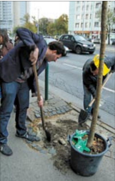
Faültetéssel ünnepelt az LMP

táblánál gyűlt össze, hogy az '56-os hőseire emlékezzen. A fiatal pesti fiú a körtéri csoport élén harcolt maroknyi csapatával a sokszoros túlerővel szemben. Tette ezt olyan hatékonyan, hogy több orosz tankot sikerült ártalmatlanítani. Rétvári Ben-ce, a KDNP országgyűlési képviselője azt hangsúlyozta, ma a külföldnek való behódolás helyett a nemzeti szuverenitást kell erősíteni.