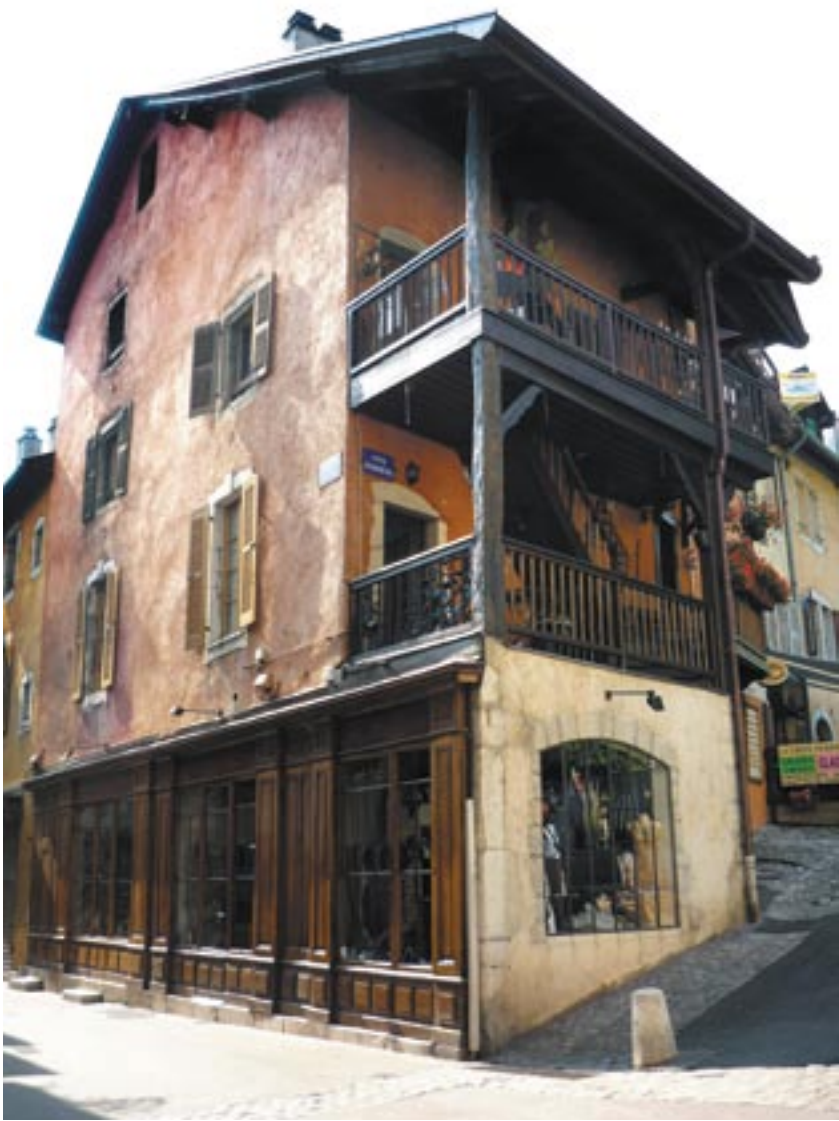
A hangulatos üzletsorok, a palettás ablakok, a faragott balkonok jellemzik a provance-i házakat