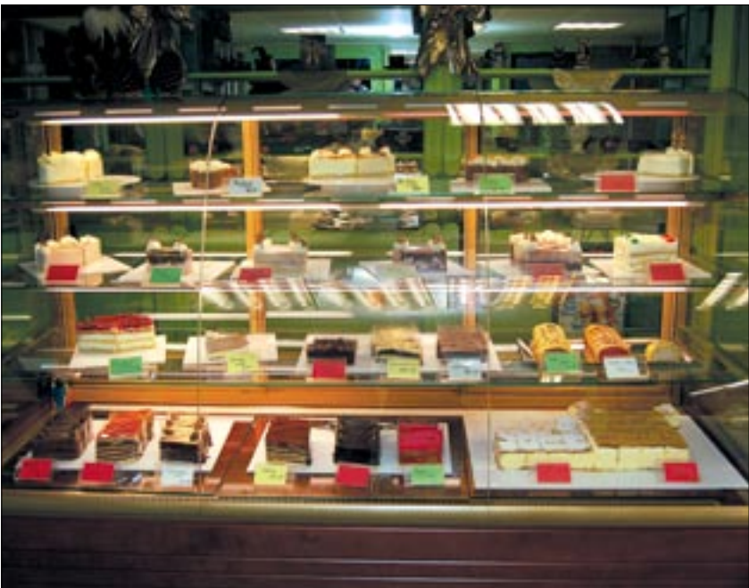
A süteménykánaán nemcsak látványos, hanem ízében is valódi kuriózum

Hasonló érzések fogtak el, amikor a Tüskéshátú Cukrászdába tértem be. Talán ez sem véletlen, hisz a Törökugrató utcai süteménykánaán 1986-ban nyílt. Tizenhárom év múlva azonban bezárt, a tulaj egy sütőipari cég beiglibeszállítójává lett. A helyiek örömeire nemrégiben újra kinyitott, és ugyanott folytatta, ahol ab-bahagyta. A csillogóan tiszta belső térben álló üveges pult mögött olyan fenségesen mutatgatják magukat a szebbnél szebb sü-