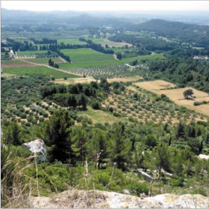
Van Gogh-ot is teljesen megigézte a provance-i táj