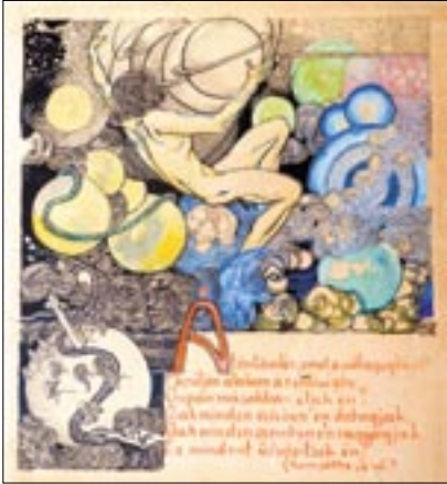
Komjáthy illusztráció. vegyes technika, karton

Rendhagyó jellemzője a MCP Múterem-Múzeum kiállításainak, hogy olyan egyedi műhelymunkában születnek, melyben a múzeum házigazdái mellett annak önkéntesei, az ELTE-BTK és a