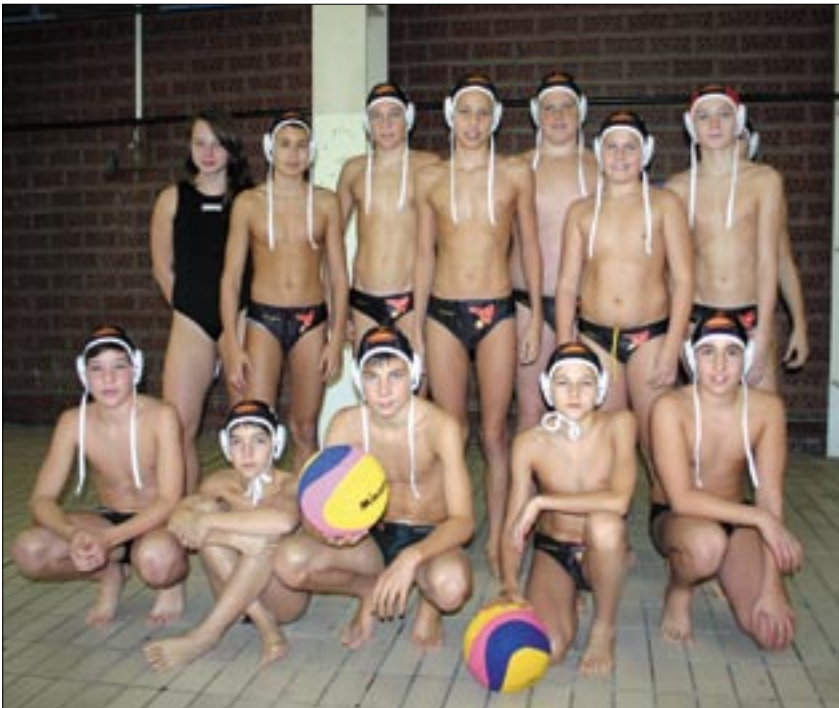
A sportoló gyerekek általában többre értékelik a barátságot, mint a mozgást kerülő társaik