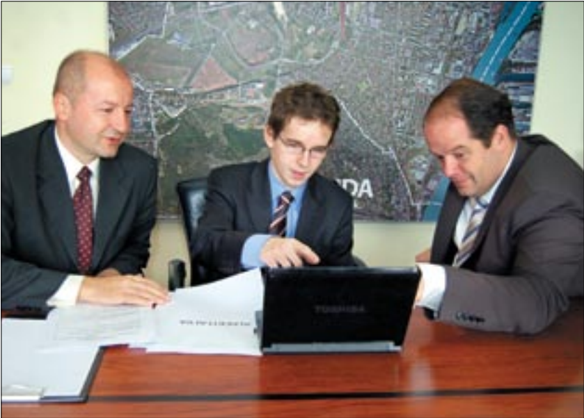
Simicskó István, a Honvédelmi Minisztérium államtitkára, Újbuda országgyűlési képviselője, dr. Hoffmann Tamás, Újbuda polgármestere és Szaniszló Krisztián, Újbuda 11-es körzetének Fidesz-KDNP-s önkormányzati képviselőjelöltje egyeztetést folytatott a december 18-i albertfalvai időközi választás kapcsán a polgármesteri irodában.

Sokkoló készülékkel játszott a Bárdos Lajos Általános Iskolában néhány diák október 27-én. Bár szerencsére egyikük sem sérült meg, az tény, hogy az ilyen szerkezet csak az arra hivatott, hozzáértő kezébe való. Hoffmann Tamás polgármester az eset kapcsán a szülők felelősségére hívta fel a figyelmet, hiszen a berendezés valószínűleg otthon került a gyerekekhez. Az a diák, aki bevitte az iskolába az eszközt, elmondta, nem tudta, hogy egy veszélyes tárgy van nála, egyszerű zseblámpának hitte. A 12 és 14 év közötti tanulókhöz az igazgató jelenlétében mentőt hívtak, orvosi ellátásra azonban végül is nem volt szükség. A rendőrség vizsgálata szerint a veszélyes tárgyat a diákok valóban csak játékból használták, bűncselekmény nem történt.