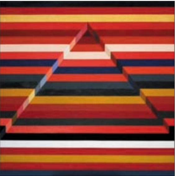
Orbis pictus, Konok Tamás Kossuth-díjas művész alkotása

A szervezők hitvallása szerint fontos, hogy rangos intézmények révén lehetőséget teremtsünk minden korosztály számára, hogy bármilyen életkorban új ismeretekhez, tudáshoz juthasson, új érdeklődési köröknek hódolhasson, magas színvonalon tanulhasson, tájékozódhasson, és ezáltal napjai értelmes, érdekes, izgalmas szellemi kalandokkal legyenek teljesebbek. Az életen át való tanulás filozófiája nevében örömteli kihívás a fiatal, a középkorú és a nyugdíjas éveket aktív szellemi tevékenységgel, új ismeretek befogadásával, az élet más területeinek felfedezésével megtölteni, mert a tudáson, műveltségen túl is nagyon sokat adhat: nyitottabbá tesz, kapcsolatokat, barátokat, közösséget teremt.