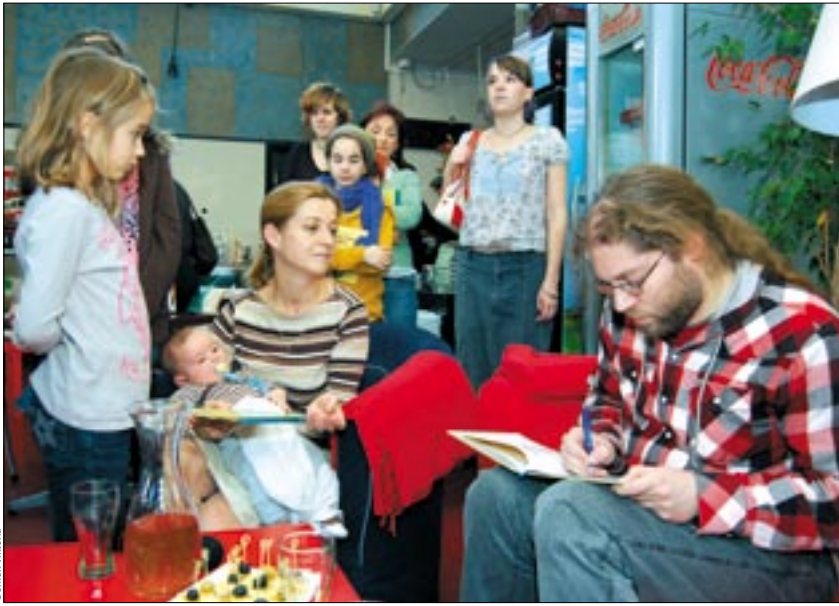
A fiatal poéta gyermeke születése után mondókás könyvet írt

A versek szinte maguktól jöttek ki belőlem. Minden úgy kezdődött, hogy amikor párnapos korában a fiam sírdogálni kezdett, megpróbáltam énekelni neki. Legnagyobb meglepetésemre elhallgatott, és érdeklődő képet vágott. Büszkén mondhatom, az én kisbabám nagyon jól fogadta a verseimet is. Az alkotást valójában az ihletettség tette egyszerűvé. Aki már szülő, tudja, milyen hatalmas érzelmeket vált ki az emberből, ha lesz egy saját gyermeke. Először engem is felkészületlenül ért a dolog, de őszintén