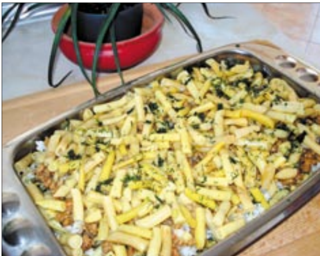
A rakott zöldbab készen áll a sütéshez

Nagyon eltalált arányok ezek, érdemes betartani. Szóval, ha megpirult a hús, a hagyma, jöhet rá a fűszerpaprika, ami csak meleg zsírban adja ki a színét, azonban vigyázni kell, nehogy megkeseredjen,