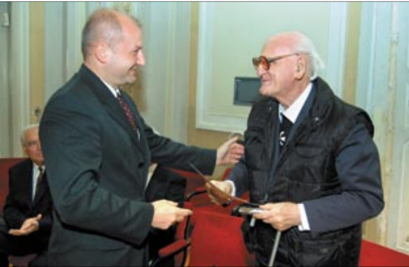
A forradalom szentimrevárosi hőseire emlékeztek a Budai Ciszterci Szent Imre Gimnáziumban. Dr. Simicskó István országgyűlési képviselő, honvédelmi államtitkár köszöntője után emléklapot adott át azoknak a kerületi idősöknek, akiket keresztény hitük miatt hurcoltak meg a kommunista diktatúra éveiben.