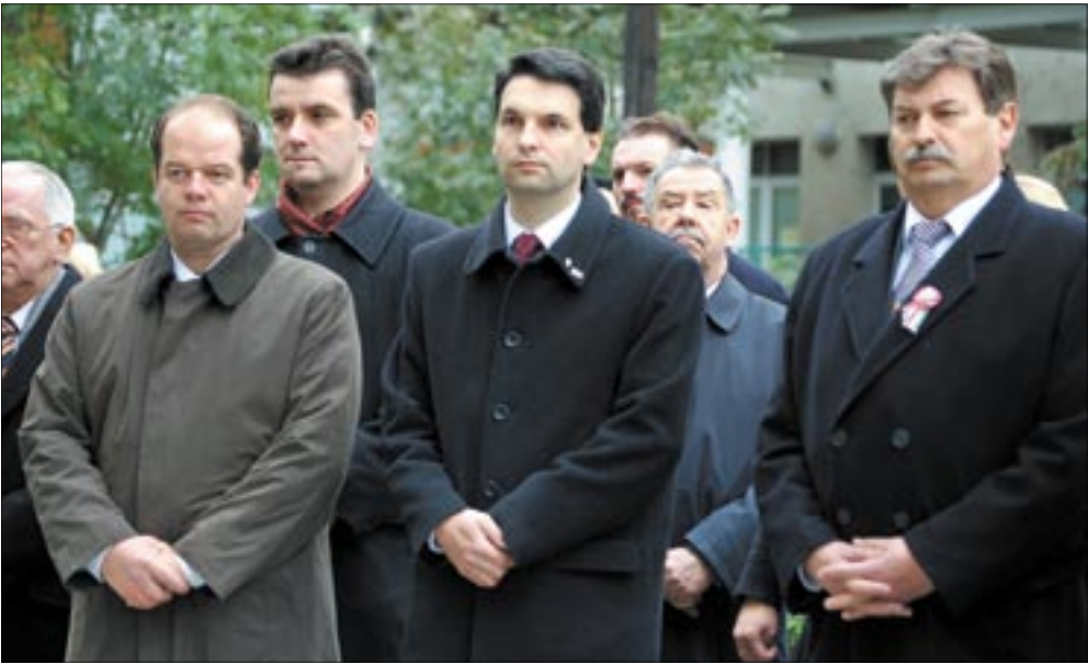
A Szent Imre Kórház udvarán orvosokra, ápolókra emlékeztek

szefogásból – mondta a polgármester. – Megmutatta, hogy a magyarok összetartásának, akaratának mekkora ereje lehet. Hogy nem olyan nemzet vagyunk, melyet a feje fölé lehet irányítani, melyet meg lehet taposni. Történelmünk során számos alkalommal bizonyítottuk, hogy erősek és büszkéek vagyunk. Hogyha kell, kiállunk egymásért, kiállunk Magyarorszáért! Az elmúlt hónapok pedig ismét bizonyították, hogyha bajban érezzük országunkat, újra és újra összefogunk, hogy együtt segítsünk rajta. Megmutattuk ezt a nagy nyári árvíznel, megmutattuk most, az iszapszefogásról. Büszke vagyok arra, hogy egy olyan közösséghez tartozom, mely bármikor kész összefogni, és segíteni egymásnak a bajban. Büszke