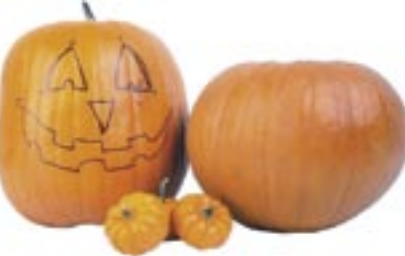
A kívájt tökhéjat az ablakba is kitehetjük dísznek

ELKÉSZÍTÉSE: a tököt és a répát jól megmos- suk, megpucoljuk. A tökkel vigyázni kell, mert néha alattomosan kemény a héja, az éles késsel óvatosan bányunk! A tököt fel- kockázzuk, a sárgarépát felkarikázzuk. A hagymát apróra vágva üvegesre piritjuk, majd beletesszük a pirospaprikát és fel- öntjük vízzel. Ezután hozzáadjuk a felda- rabolt tököt és a sárgarépát úgy, hogy a víz jól ellepje. Beledobjuk a húsleveskockát, aztán hagyjuk nagyon puhára főni. Ha már teljesen megfőtt, jön a munka neheze. Mindent óvatosan le kell turmixolni (oly-