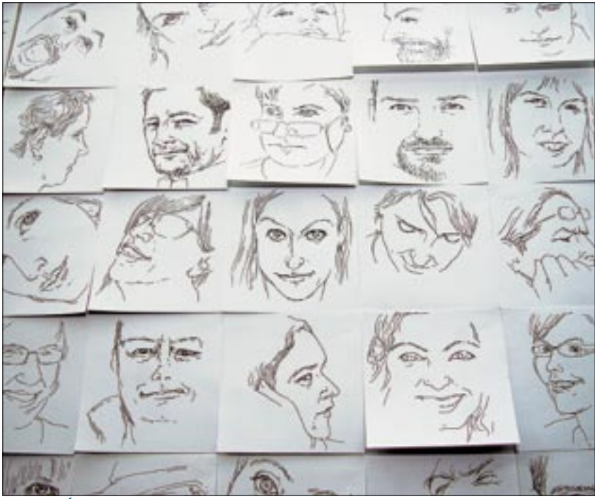
MEGNYITÓ: Szarvasgomba, olasz bor, fotó, grafika