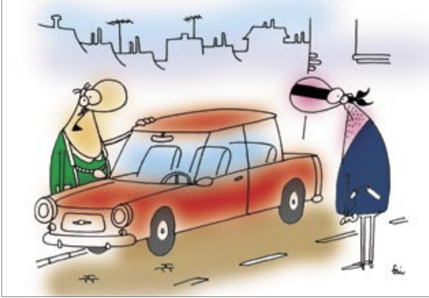
– Nincsen kedve ellopni az autót, Balog Totya?