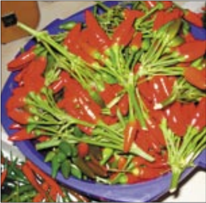
Cserépből cserépbe mentettük át a chilinket

férjem vitt, félig egyéb utazási kellékek, félig pedig könyvek voltak. Amit elolvastunk, azt mindig leadtuk egy könyvesboltban, ott ugyanis ez egy nagyon jó szokás. A tu- risták a kiolvasott könyveket egyszerűen otthagyják, a boltos meg pár filléres ha- szonnal továbbadja őket, ezért lehetséges, hogy Thaiföld legeldugottabb falujában is van esélyed magyar könyvet találni. Persze nem a Háború és békét vittük díszkötésben, hanem nyaraláshoz való, egyszer olvasható könnyű műveket. A könyvek helyére ke- rültek aztán a szülőknek, barátoknak vett ajándékok. Na és mindezt miért mondtam el? Mert az egyik vacsoránál olyan finom chilipaprikát ettünk, hogy gondoltunk egy nagyot, és eltettük a magjait. Úgy voltunk vele, hogy megpróbáljuk. Ha sikerül jó, ha nem, hát nem. Aztán sokáig olyan helyeken laktunk, ahol nem volt kert, ezért az évek folyamán a friss termés után a magokat cserépben menekítettük tovább, és ültettük újra. Mióta van kertünk, van kint egy bo- kor, amely évről évre nagyobb termést hoz. Bármikor ránézek a chilinkre, a forró nyár, az a csodálatosan szép ország, valamint az a semmihez sem hasonlítható álom szép tiszta víz jut az eszembe, egy olyan parton, ahol csak ketten voltunk a férjemmel.