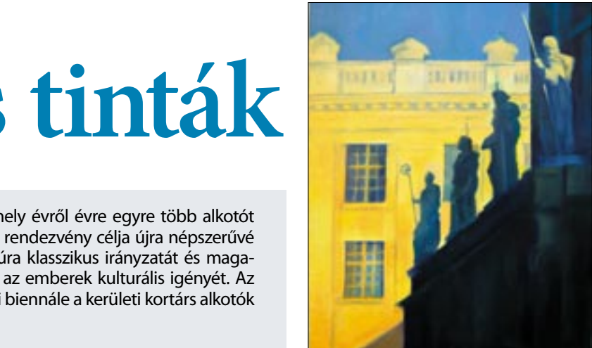
Kecskés András: Neobarokk