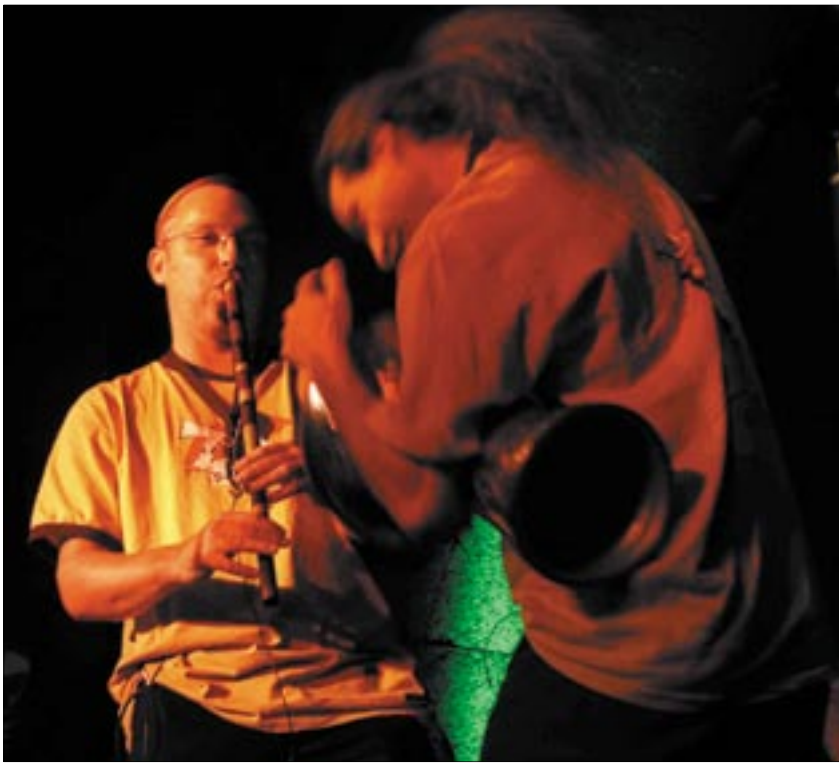
A Besh o drom is fiatal tehetségekkel lépett színpadra

mint Kodály és Bartók tették – éveken át rögzítették a dalokat.