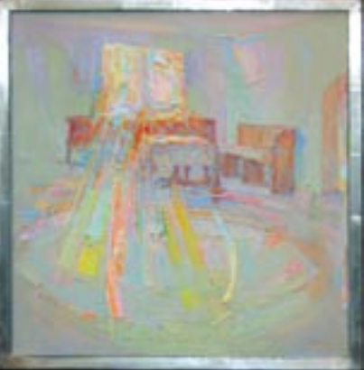
Atlasz Gábor: Szobák

A Polgármesteri Hivatal épületében működő Újbuda Galéria ez évben egy teljesen nyitott pályázatot indított. Az „Újbuda képeretben” című festőversenyen bárki elindulhatott, a szervezők csupán egyetlen kikötést határoztak meg: az alkotás témájá-