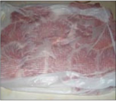
Ha így klopfoljuk a húst, minden tiszta marad