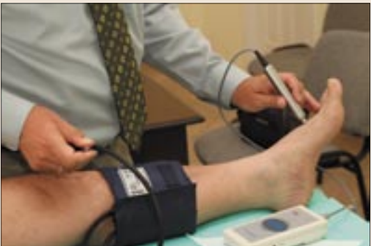
Fontos a betegség időben történő felfedezése

A perifériás érbetegség, közismertebb nevén érszűkület, az általános érlemezese- dés egyik megjelenési formája, amely esetben a vérkeringési zavar az alsó végtagban lép fel. Az érszűkület előfordulásának gyakorisága a korrall együtt nő. Az alsó végtagon kialakult érszűkület akadályozhatja mindennapi életünket, késői felismerése a végtag elvesztéséhez, amputációhoz vezethet. Magyarországon az amputációk száma évente közel 5000 érszűkület miatt. A statisztikák szerint az érszűkületes betegeknek, kétszer nagyobb az esélye a szívinfarktushoz vagy szélütésnek. Bár az érszűkület jellegzetes tünetekkel járhat, gyakori, hogy a járáskor fellépő lábkragöröcsöt vagy erőtlenséget a beteg a korrall vagy ízületi panaszokkal magyarázza, és nem fordul orvoshoz. A felismerést nehezíti az is, hogy a betegség sokáig tünetmentes maradhat, ebben a stádiumban csak szűrővizsgálattal lehet kimutatni. A romló alsó végtagi keringés típusos tünete a járáskor a vádliban vagy a combban fellépő görcs, fáradtság vagy nehézségérzés, fájdalom, amely pihenéskor rövid idő alatt megszűnik. Súlyosabb esetben a romló vérellátás következtében a fájdalom éjszaka, nyugalomban is jelentkezhet, illetve a lábón nem gyógyuló seb, fekély is kialakulhat. Az időben meg-