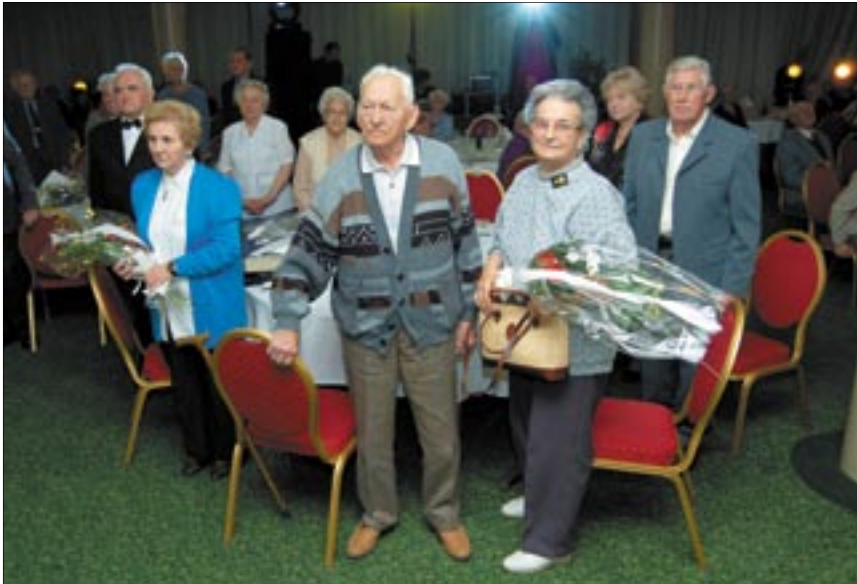
Mindannyiuk életében Újbuda a közös nevező