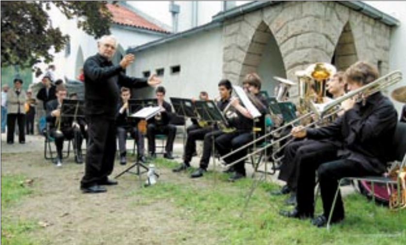
A Weiner Leó zeneiskola fúvósai koncerteztek a templomkertben