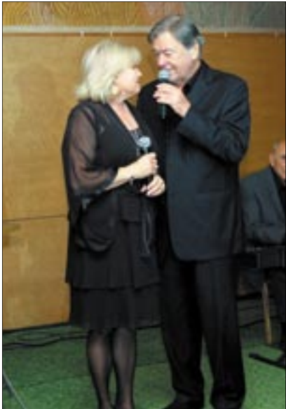
„How do you do? A-ha.”