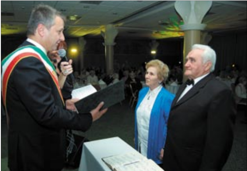
Az anyakönyvvezető előtt tizenöt házaspár mondott újra „igent”