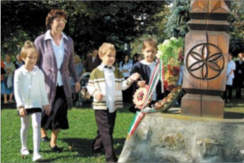
Az Órmezői Általános Iskola kertjében lévő kopjafánál volt az emlékünne

Nyolcvanadik születésnapját ünnepelte a neves író