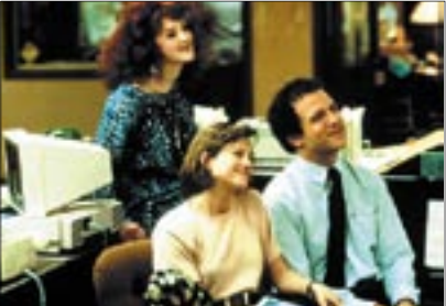
A híradó sztárjai: Joan Cusack, Holly Hunter, Albert Brooks

A híradó sztárjai (eredeti címen: Broadcast News) 1987-ben készült. A televíziózásnak, a híradózásnak az ős- és a hőskölte-ménye. Aki nem szakmabeli, a moziban elsőre azt gondolhatja, csak egy könnyű vígjáték, amely elsősorban egy szerelmi háromszögről szól úgy, hogy közben egy izgalmas foglalkozás kulisszái mögé is be-nézhetünk. Én viszont már számtalanszor láttam, mert a saját szakmám legnagyobb kérdései köszönnek vissza benne. Sőt, a tanítványaimnak is – akiknek tévés és rádiós alapismereteket oktatók – minden évben megmutatom. Bár akkoriban, 1987-ben még nem volt mobiltelefon, és az asz-szisztens valóban kazettákkal rohagált, mintha az életéért futna, hogy az adásig elérjen az anyag a vezérlőbe – a filozófiai mondanivaló a mai napig érvényes. Miről lehet és miről szabad riportfilmet csinál-ni? Mi az, amit erkölcsileg felvállalhatunk, és mi az, amit nem? Meddig lehet elmenni a nézők szórakoztatásáért? A filmben a szerkesztőség folyosóján állnak az újság-írók, és arról beszélgetnek, mit tennének meg egy anyagért, a sztoriért. Elhangzik, vajon ki vállalná egy kivégzés közvetíté-sét úgy, hogy a kamera ráközelít az elítél-t arcára. Valamennyien vállalnák. Pedig jó érzésű emberek. Vajon hitelét veszti-e a megrázó interjú, ha utólag a riportert az operatőrrel felvetet magáról néhány olyan képet, ahol együttérzőleg bólogat, és még egy könny is kicsordul a szeméből? Mi a feladata a tévének? Csak és kizárólag szó-