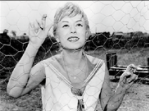
Giulietta Masina Federico Fellini filmjében

a Naplót . Vette a fáradságot, és írt nekem, hogy Pozsonyban megnézte a filmemet, és örül, hogy átadhatta a díjat. Ez az előadás számomra nemcsak arról szól, hogy elmesélünk egy megható történetet, hanem arról is, hogy kifejezhetem tiszteletemet és csodálatomat a felejthetetlen