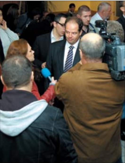
Az újonnan megválasztott polgármester a választás éjszakáján nyilatkozik a sajtónak

medréből, a hatalmas lezúduló víztömeget pedig sem a budaörsi víztározó, sem a Kőérberek-Tóváros területén épült halastó nem tudta feltartóztatni. Az áradás Budafok és Budafokon okozta a legnagyobb károkat, de nem sokkal később Újbudát is elérte, itt azonban a víz szerencsére