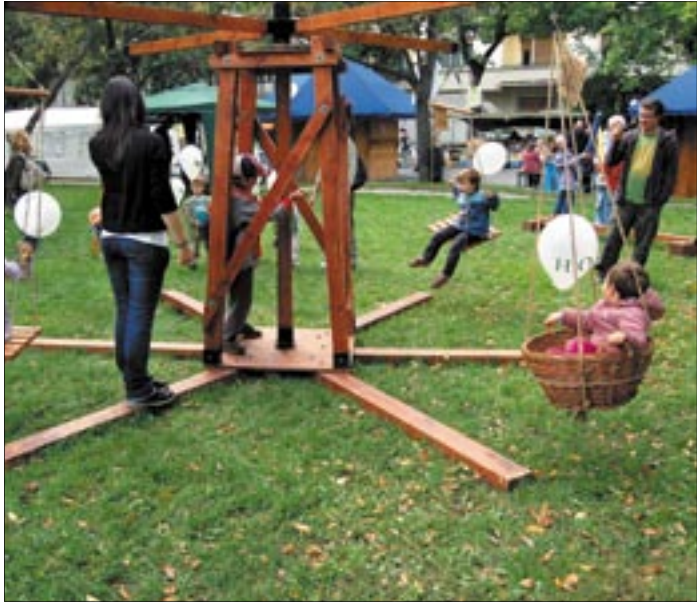
Szüreti játszótér csak természetes anyagokból

virágosztást, idén is több száz árvácskát fogadtak örökbe a környéken élők. Az ország minden tájáról érkeztek hagyományörző néptáncegyüttesek, a Bacchus nedűje által ihletett bordalokat és áriákat neves operaénekesek,