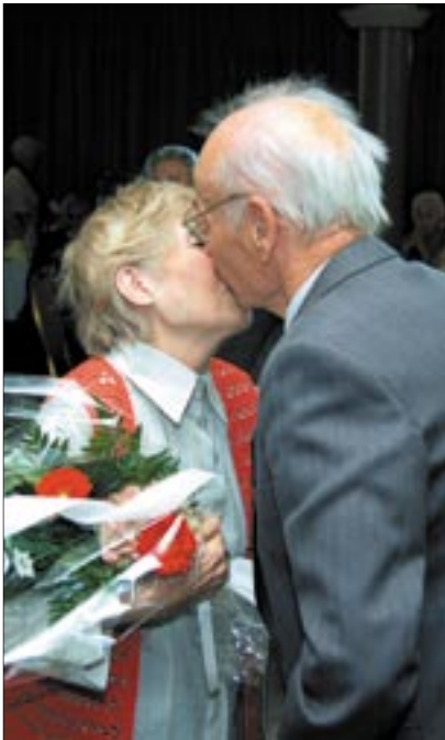
Csak az évtizedek múltak, a szenvedély a régi

Az Évtizedek Újbudán ma már hagyomány, hiszen minden évben megtisztelik azokat az időseket, akik valamely kategóriában kerek évfordulóhoz érkeznek, és a szervezők Újbuda újságban és az ujbuda.hu internetes oldalon közzétett felhívására írásban jelentkeznek.