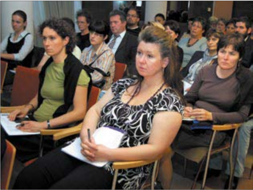
Az erkölcsi, etikai és egészségnevelés, illetve a tehetséggondozás kiemelt szerepet kap