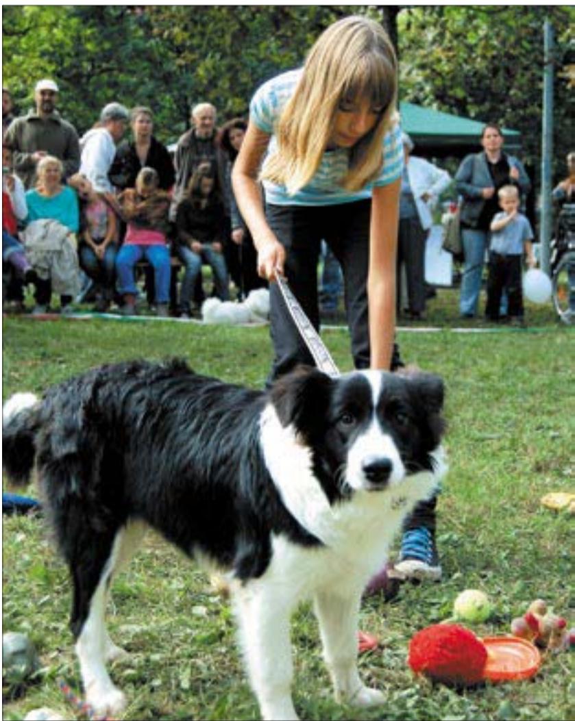
A Border Collie a világ egyik legokosabb kutyája