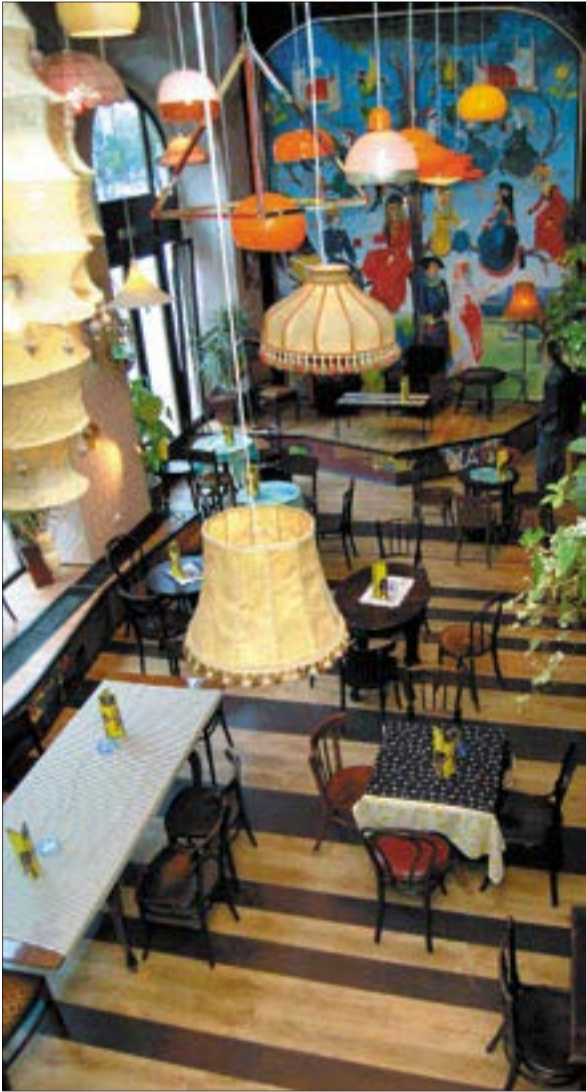
A Szatyor bár tervezői mozgalmas belső teret alkottak