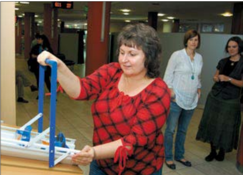
A hasznos eszközt a hölgyek is könnyedén tudják kezelni