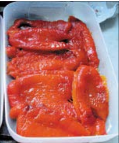
Igenis le lehet húzni a sült paprika bőrét

Mielőtt bármit is mondanék, bizonyítékul itt egy kép, amely ama szenes bőrűre süttött kaliforniai paprikát mutatja. Történt ugyanis, hogy az előző lapszámban megjelent receptemhez kapcsolódó, Olvasónk azt írta, képtelenség szépen lehúzni a bőrt a paprikáról. Íme.