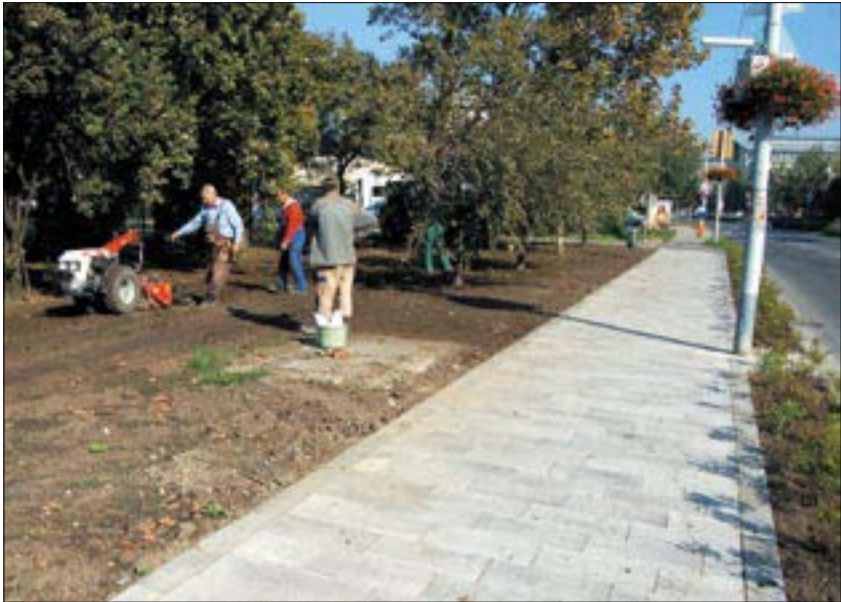
Bikás park: Automata öntözőrendszer, világítás, bekerített kutyafuttató

7500 négyzetméteren öntözőrendszerrel kiépített, 320 cserjével gazdagított zöld területet adtak vissza a lakosságnak a Bikás Parkban. A kutyák újra biztonságban lesznek az új kerítéssel és kapukkal ellátott kutyafuttatóban. Térkövet fektettek a minigolfpályától a Vahot utcáig vezető útra, amelynek végén újabb parkolók épültek. A park felújított részén műkö asztalokat is elhelyeztek, ahol pihenni, sakkozni lehet. Az esti biztonságos közlekedés megkönnyítésére köztéri lámpákat kapott a tér, a kelenföldi városközpontnál pedig új jelzőlámpás csomópont épült ki. A biztonságos átkelést segítendő két új gyalogosátkelőhelyet alakítottak ki. A területen mindenhol akadálymentes járdák segítik a fogyasztókkal élők közlekedését.