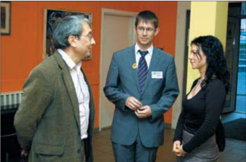
A biciklítés mellett, a parkolóház ellen van az LMP