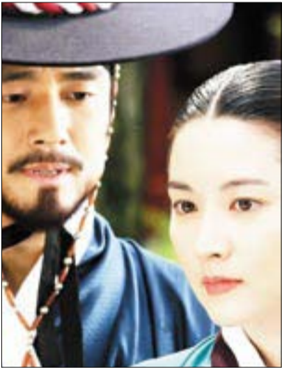
Jobbra Jang-geum, vagyis az őt alakító Lee Young Ae a filmsorozatban

Néhány hónapja kétszer is leadta a Magyar Televízió A palota ékköve című sorozatot,