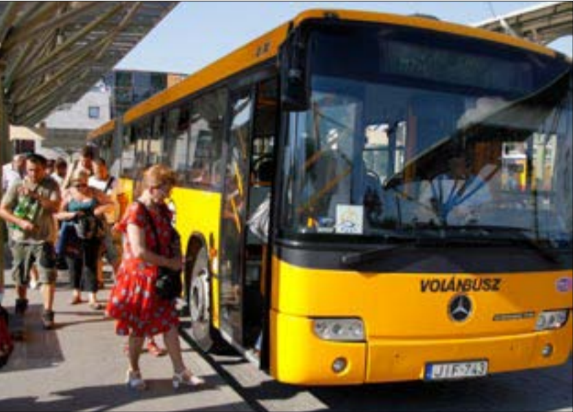
A regisztrációs jegy a közpénzekből fizetett ingyenes utazások mérésére szolgált volna

százaléka volt ingyenes. A Közlekedési Munkástanácsok Szövetsége már jelezte: a regisztrációs jegyek alapján a Volán-