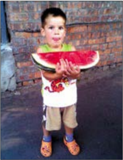
Olyan dinnyét, amely a Szécsényben eltöltött gyermekkoromat idézi, szintén csak a budafoki piacon, és kizárólag egy zöldségesnél lehet beszerezni

mintha grízben homokoznánk. Ezt rábízhatjuk a gyerekekre, nagyon szeretik csinálni. Üssük bele és dolgozzuk el a tojást, ne legyen túl hideg a tejfel, amikor hozzáadjuk, majd mehet bele a só, kicsit később az élesztő. Ha kell, lisztezzük még, vagy ha úgy látjuk, tegyük hozzá langyos tejet. Nagyon jól dolgozzuk meg, aztán tegyük kelesztő táliba, ennek az a nagy előnye, hogy egyszerűen rápatintjuk a műanyag fedőt, amely akkor lökődik le magától, amikor a tészta megkelt. Ha ilyen nincs, akkor belisztezzük, és konyharuha alatt meleg helyen hagyjuk magára a tésztát. Vészhelyzetekben a mikró legalacsonyabb olvasztófokozatánál egygel erősebbre állítjuk a készüléket, kilisztezzet tányérra tesszük a téasztát, ami úgy 8–10 perc alatt megkel. Ez utóbbi nem túl egészséges, ezért ne tegyük gyakran, csak ha a vendégek egy órán belül jönnek, és le vagyunk maradva. Két cipóra osztjuk a végeredményt, először csak az egyikkel dolgozunk: kilisztezzet deszkán – nagyapám úgy mondta: „kisujj fele vékonyra” nyújtjuk, majd megkenjük a felvert tojássárgájával, megszórjuk reszelt sajttal és köménymaggal, az elvetemültebbek durva szemű sőt is szórnak rá. A klasszikus derelevágóval másfél centis csíkokat vágunk, majd másik irányból is megközelítjük a