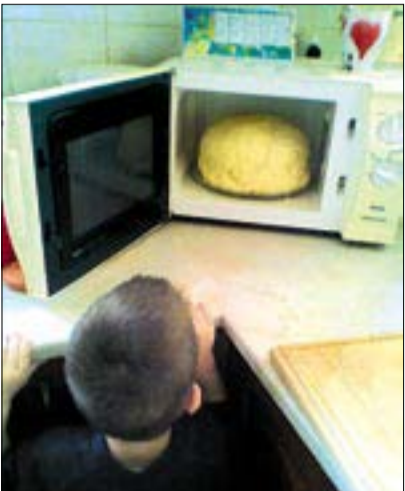
A legjobb dolog, ami a tésztával történhet, hogy hatalmasra dagad, és nem csak a gyerekeket nyugtázza le a látvány

Kezdjük úgy, hogy az élesztőt morzsoljuk szét, öntsünk rá langyos tejet és egy csipet cukrot, majd hagyjuk magára, legkésőbb 10 perc múlva feljön. A liszthez adjuk hozzá a margarint és morzsoljuk el a liszttel, egészen addig, amíg olyan állaga nem lesz,