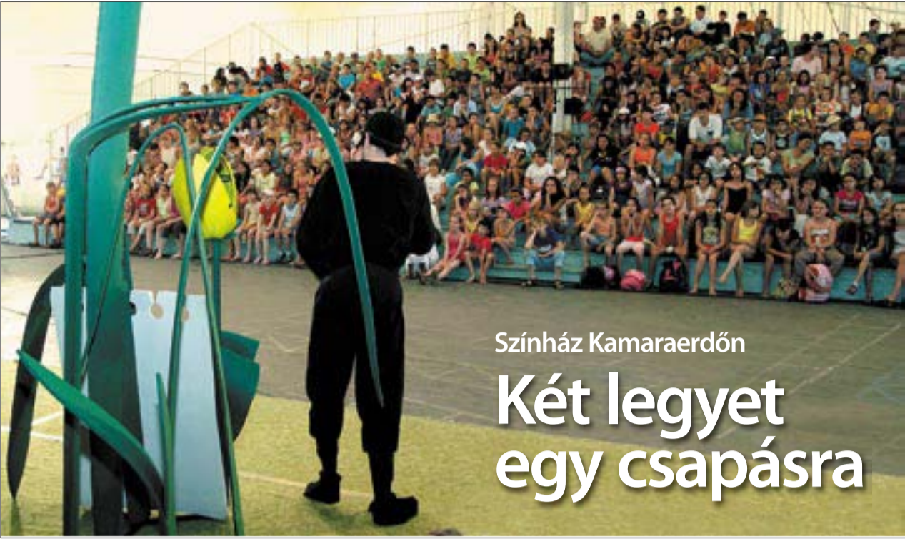
Színház Kamaraerdőn Két legyet egy csapásra