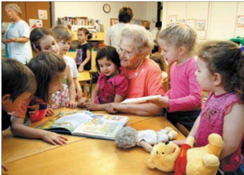
Egyszer volt, hol nem volt...