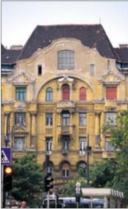
A homlokzatok felújítása megszépíti a város arcát

érdekeit a városrész lakóinak érdekeihez mérni, és egy konszenzust a vállalkozókra hivatkozva felrúgni. A kérdés az, milyen Bartók Béla utunk lesz három év múlva. Lehet olyan, mint a Rákóczi út – ahol ma már bedeszkázott kirakatokat lehet látni,