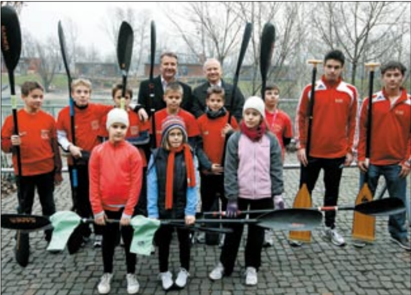
Az ajándék a kajakutánpótlás egészségét is szolgálja

Mostantól a Lágymányosi-öbölben sportolók is biztonságban érezhetik magukat, hiszen a Henkellnek is köszönhetően defibrillátor került a Spari kajak-kenu egyesület csónakházába. A hirtelen szívleállás esetén gyors segítséget nyújtó készülék átadásán neves sportolók is jelen voltak.