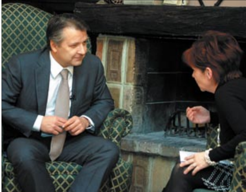
Idén szokatlan helyszínen, kandalló mellett beszélgettünk a polgármesterrel