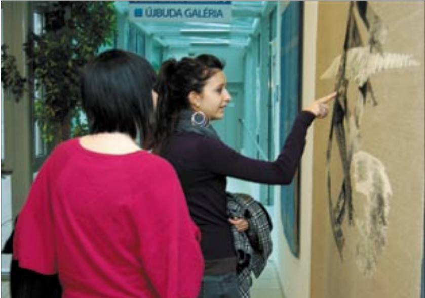
A textilművészet a hölgyek körében különösen népszerű