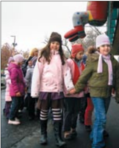
Érkeznek a gyerekek a cirkuszi előadásra

A Fővárosi Nagycirkusz 2009-ben ünnepli fennállásának 120. évfordulóját. Az évforduló tiszteletére rendezett gálaműsorban fellép a magyar és nemzetközi artistaművészek színe-java. Így a felnőtteknek is érdemes ellátogatni a helyszínre,