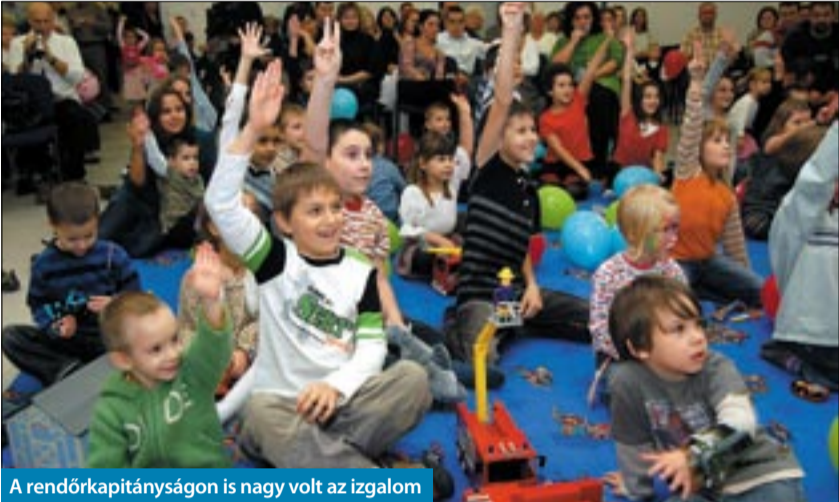
A rendőrkapitányságon is nagy volt az izgalom