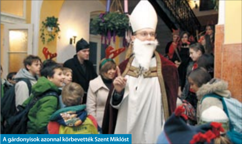
A gárdonyisok azonnal körbevették Szent Miklóst