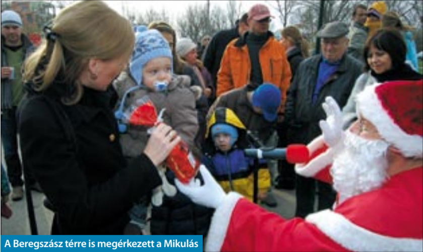
A Beregszász térré is megérkezett a Mikulás