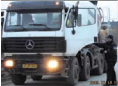
A teherautók megkülönböztető jelzéseikkel visszaélve sokszor letérnek a kijelölt útvonalokról

Lakossági bejelentések sorozata szól arról, hogy negyven-, ötven-, sokszor hatvan tonnás járművekkel „száguldoznak” a csillapított forgalmú utcákon, sárga figyelmeztető jelzésekkel szabálytalanul közlekednek, a jelzéssel visszaélve figyelmen kívül hagyják a számukra is kötelező érvényű útvonal-előírásokat, és a KRESZ-t.