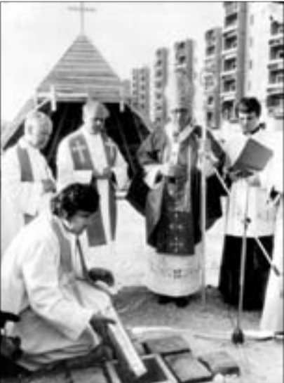
Paskai László bíboros megáldja a templom alapkövét

Életének 62., áldozópapságának 38. évében hunyt el Lipp László, akit László atyáként ismert a széles nyilvánosság. László atya kerületünk közéletének egyik motorja volt, sokrétű tevékenysége a hívők és a nem hívők sokaságának szerzett örömet, vigasztalást.