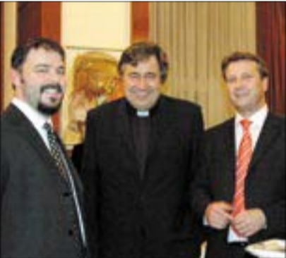
A kerület közéletének része volt