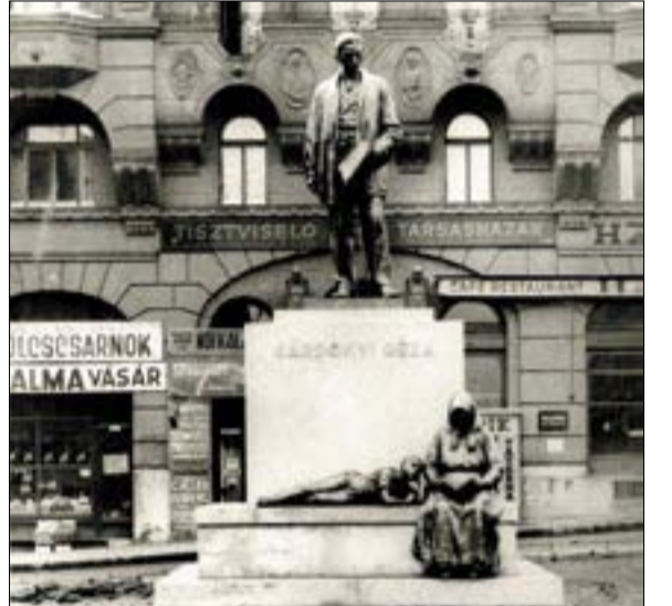
Korabeli kép a Gárdonyi-szoborról, háttérben a Hadik Kávéház