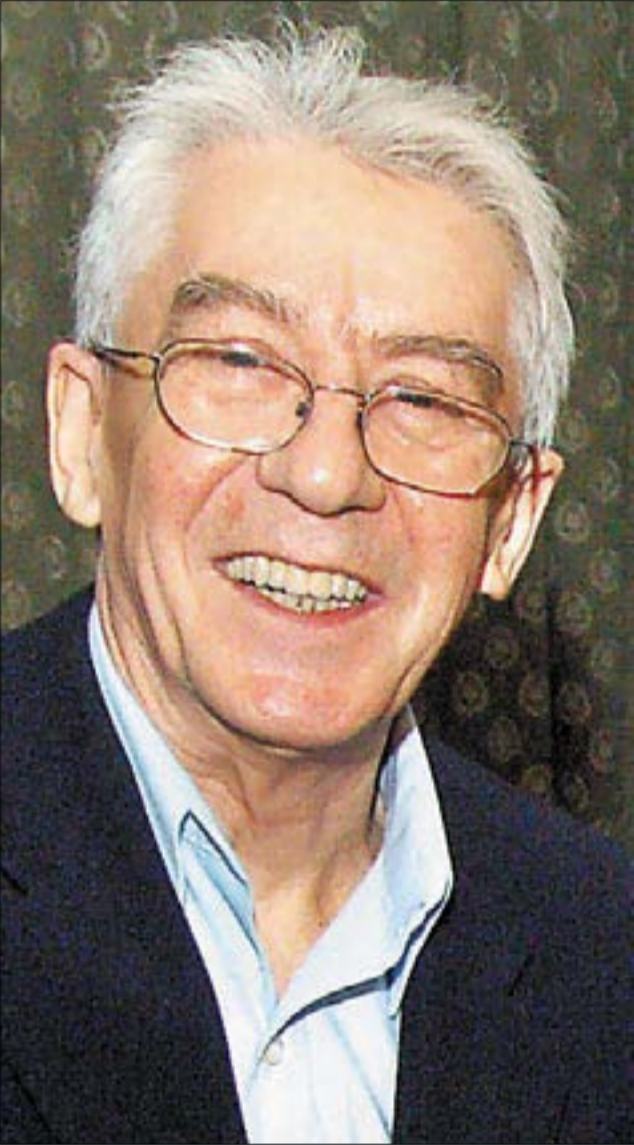
Cseh Tamás (1943–2009)