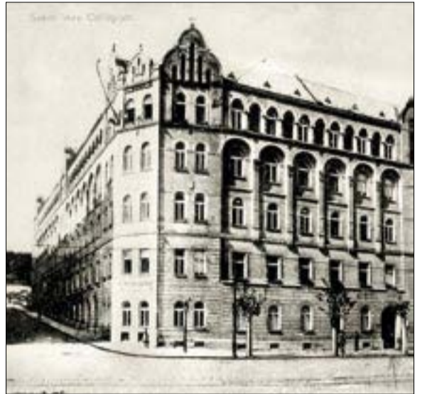
A Szent Imre Kollégium a mai Bartók Béla út 17–19. szám alatt