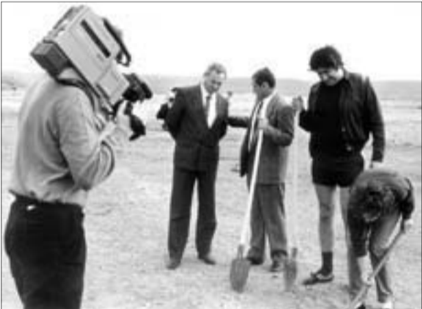
Ennek a pusztaságnak a helyén ma áll a templom

Emléket állítottál, ércnél maradandóbbat. Emléket a szívekben és emléket az újkori egyház történetében. „Emberségről példát, vitézségről formát”. Emberség és vitézség kellett ahhoz, hogy merőben új utakat járj, és erős hit, hogy mindez helyes és Istennek tetsző misszió. Egyszerre voltál vigaszt nyújtó pásztor, megértő barát és a kihívásokat elfogadó üzletember. Amit ezerarcú reneszánsz személyiségeddel létrehoztál, sajnos nem helyettesítheti majdan legendává szelídiülő emléked. Nem kísérem meg szavakba önteni azt, amit nem lehet, majd akik az életművedet kutatják, írnak rólad eleget.