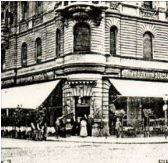
(Balról) 1. A Proféta Étterem a Gellért téren a mai házasságkötő terem helyén 2. A Gróf Hadik András lak-tanya a ’20-as években 3. A Hadik Kávéház a ’10-es években, még Somló Vilmos tulajdonlása idején

Sétánk során a 23-as számú ház elé érünk. Idős lokálpatrióták szerint itt működött az ún. kinematográfia. A körúton az 1900-as években már több „otthon-mozgóképszínház” fogadta az újdonság iránt érdeklődő közönséget. Azok, akik belekóstoltak az ízebe, és persze anyagilag is megtehették, hasonló vállalkozásokat működtettek lakásukon. A jóváhagyott tervrajzok sze-