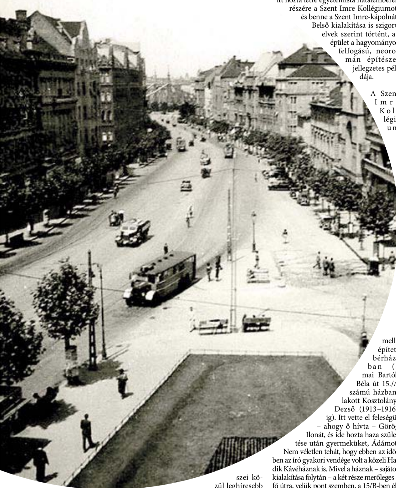
A Gárdonyi tér és a Bartók Béla út (akkori nevén Horthy Miklós út) a 30-as években

ra, és győnyörködünk egy kicsit a neobarokk stílus jegyeiben. Gondoljuk csak el, hogy kezdetben a ház bal oldalán kávézó, jobb oldalán étterem volt kellemes, vendégcsalogató teraszokkal. Volt még itt söröző, de itt volt a Műgyetem Kávéház, később a Proféta Vendéglő is.