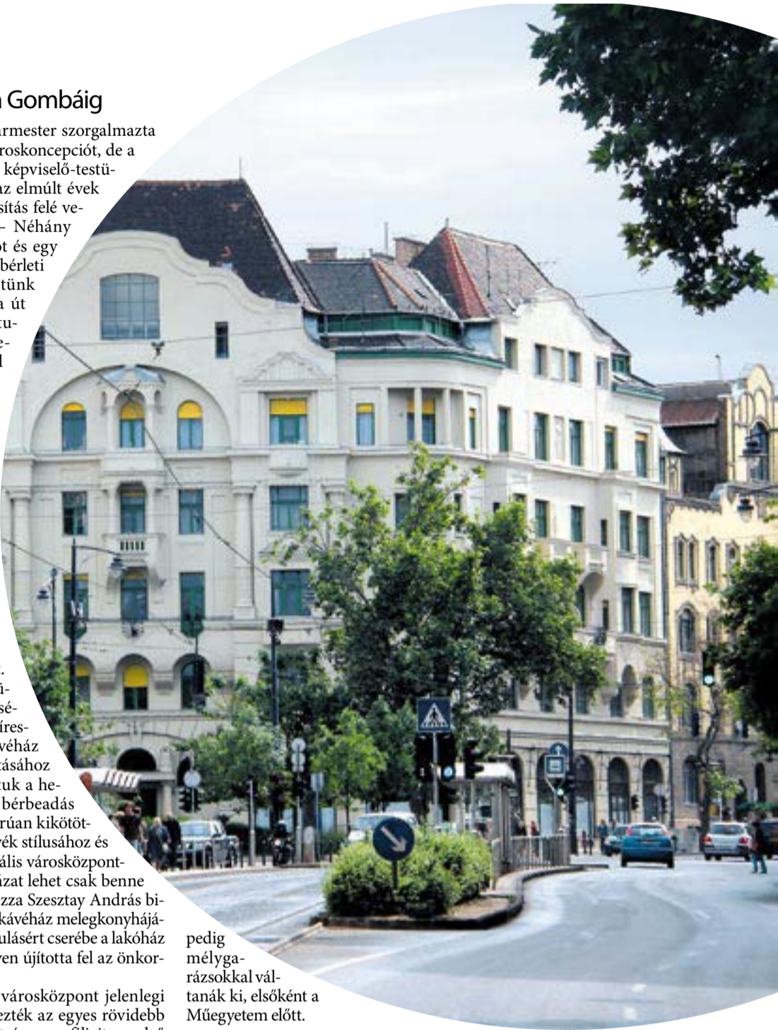
pedig mélygarázsokkal váltanak ki, elsőként a Műegyetem előtt.

A belső Bartók Béla út komplex városmegújítási programot igényel, az elv a negyed hagyományaihoz hű, kulturális alapú városfejlesztés. Innen jön – a lakossági névpályázat útján kiválasztott – BARTÓK elnevezés is. A városrészben lakott és alkotott Kosztolányi Dezső, Karinthy Frigyes és Móricz Zsigmond. A mai Bartók Béla úton lakott Ottlik Géza