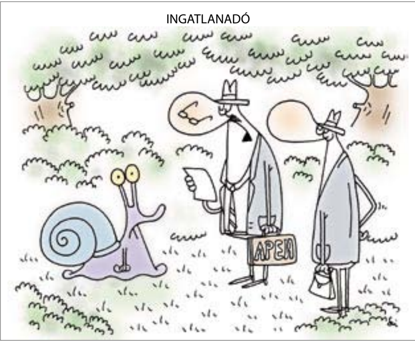
– Az ön ingatlanra egyértelműen 31 milliót ér, Csiga úr!