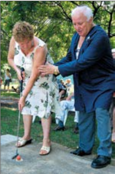
A lámpalázat a csapattársak biztatása oldotta

A teljesítményből mit sem vont le, hogy a golfozók eltérő „mezekben” léptek pályára. Volt, aki a sportág eleganciájának megfelelően kosztűmben, és volt, aki sportosan, tornacipőben vitte végig az akadályokat. A nyári napsütés sem jelen-