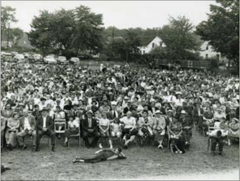
Munkásgyűlés Amerikában az '50-es évek végén a munka ünnepén

A baloldali erősödés közepette Németországban a vaskancellár, Bismarck alatt létrejött a szociális háló, a társadalombiztosítás rendszere. A nagyhatalmak