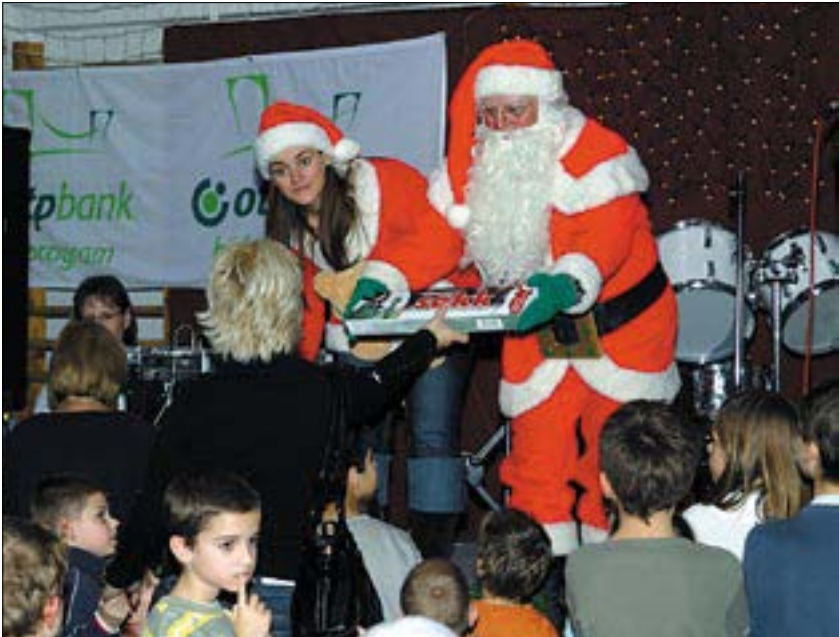
Ajándékosztó Mikulások a színpadon