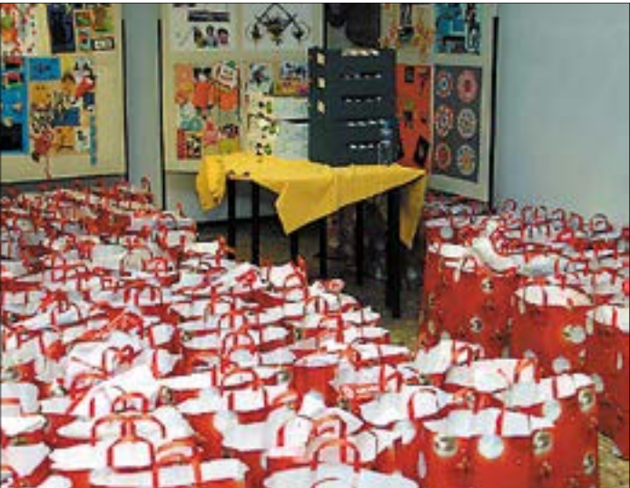
Nem könnyű eldönteni, hogy kik várták jobban a találkozást, de a képre pillantva erős a gyanú, hogy a Csíki-hegyek Utcai Általános Iskolában a karácsonyi csomagok alig várták, hogy örömet okozzanak a kis lurkóknak.