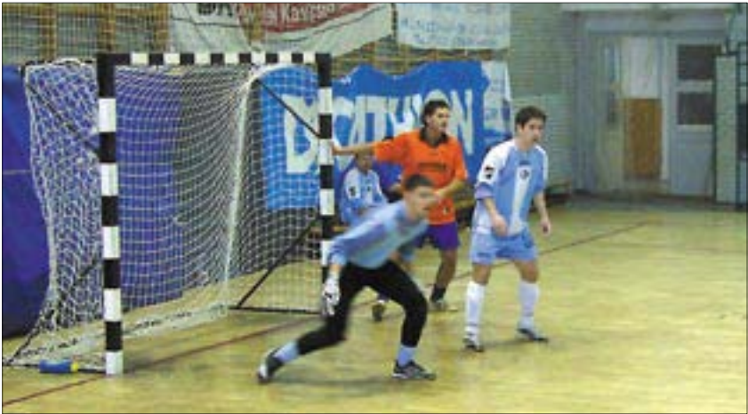
Pillanatkép a váci teremfoci tornáról: hárít a kapus, vagy a hálóban köt ki a labda?

Az Újbuda Nemzetközi Teremlabdarúgó Tornát a NK Osijek – azaz Eszék – a magyar határhoz közeli város csapata nyerte meg, bizonyítva a horvát labdarúgó-utánpótlás minőségét. A torna egyik fő esélyeseként vették a selejtezőket és az egyenes ági kieséses küzdelmeket. Alapos futballtudásról és keménységről tettek tanúbizonyságot. A torna gólkirálya és a legjobb támadó játékos is a horvát csapatból került ki. Megérdemelten lettek elsőek, legyőzve az Újbuda Kék gárdáját a