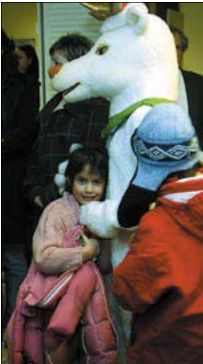
Mosoly a rénszarvas ölésében

Szintén ezen a szombaton osztották ki a rászorulóknak azokat a ruhákat, cipőket