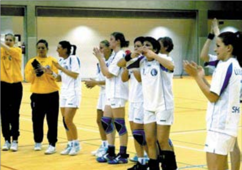
Tavaly nyáron a legmerészebb álmaik között sem szerepelt a Magyar Kupa