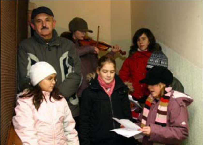
A lépcsőház volt az alkalmi koncert színtere