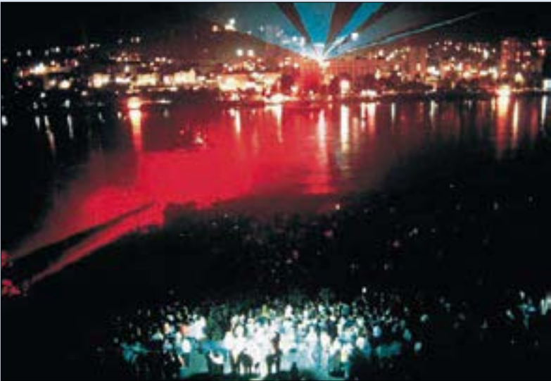
Kedves folyó, a Duna felvételünkön az új kulturális főváros, Linz fényeit tükrözi