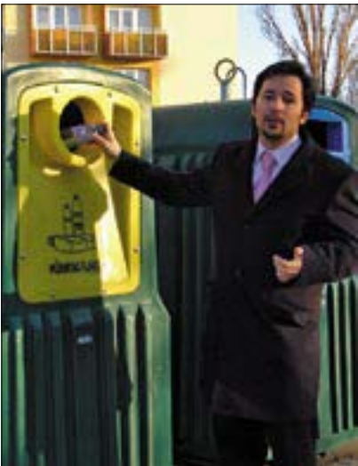
Hamar megtelenek a szelektív kukák

A kettő együtt hozhat változást. Bár nagyobb a helyigénye, és az elszállítás lehetőségét is körültekintőbben kell vizsgálni, mégis foglalkozni kell a szelektív hulla-