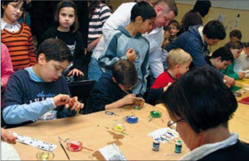
Szép ajándékok készültek a kézműves-foglalkozáson