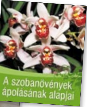
A szobanövények ápolásának alapjai

rópába a kuriózumnak tekintett bonszajt először a portugálok hozták be 1500 körül. Az 1878-as, 1906-os és az 1909-es világkiállításon egész Európa megismerhette. Minden alkalommal Japánból hozták be a fácskákat, amelyeket a közönség megcsodált, majd a kiállítás után a kertészek az otthagytott növényeket kiültették a szabadba, hogy ne legyenek beszorítva egy szűk cserépbe. Így azok hirtelen növekedésnek