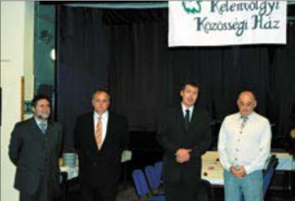
Hagyomány és közösség – nemcsak jelmondat, hanem elhivatottság is

„Hagyomány és közösség”! Nemcsak egyszerű jelmondata az intézménynek, hanem küldetéstudatot, elhivatottságot is jelent a mindennapok munkájában. Miként azt