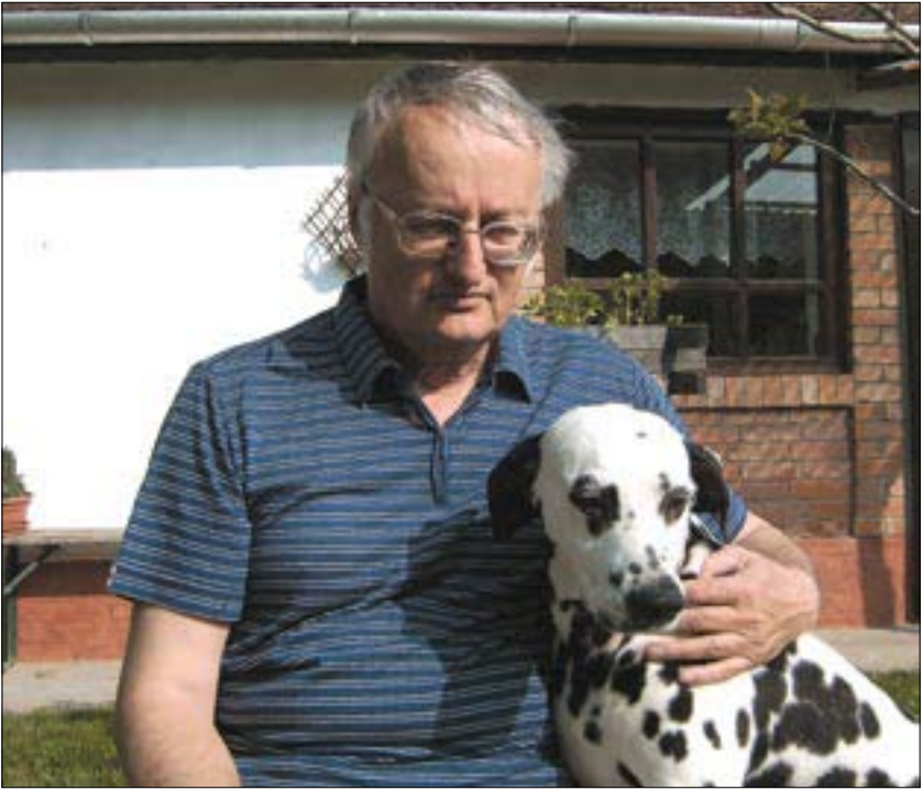
Véletlen, hogy az új sorozat a rendszerváltás újjazdagjainak körében játszódik

sorozat, melynek az első kötete a Naponta fogsz meghalni, egy markánsan mai magyar miliőben, a rendszerváltás újjazdagjainak körében játszódik. Az már kevésbé véletlen, hogy ha az építőipari vállalkozó feleségének, Fruzsínának, a nőgyógyász feleségnek és a többieknek egyformán jár az esze, ha azonos morális, azaz esetünkben amorális mércék alapján hozzák meg döntéseiket, vagy ha bűnös terveik csak igen gyenge ellenállásba ütköznek a hazai igazságszolgáltatás részéről, annak megvan az oka a pillanatnyi hazai társadalmi-gazdasági viszonyokban. Ezek a viszonyok akkor is léteznek és közismertek, ha a krimiíró nem hivatkozik rájuk, egyszerűen csak hiteles figurákat csogat