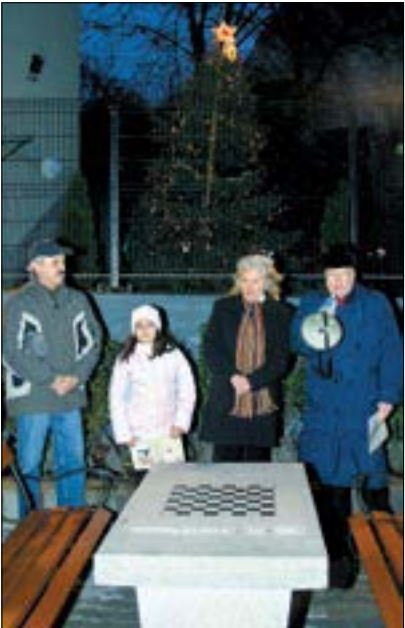
A fenyőfa fényei alatt kezdődött az ünnepség

Egy kis közösség bizonyított: ami egyszer nagyon szépen felépült, majd évtizedek során kezdett tönkremenni, azt a felelős gondolkodás és az áldozatvállalás ismét felvirágoztatta.