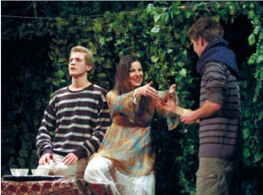
A fiatalokat ugyanolyan szinten foglalkoztatja a nemiség kérdése, mint 120 évvel ezelőtt

A díszlet igazodik a mondanivalóhoz, hiszen a történet egy erdő kellős közepén játszódik, amely szintén a kibogozhatatlanság képzetet erősíti a nézőben. A Karinthy Színház a darabot „beavató színházi előadásként” hirdeti. Ez a kifejezés