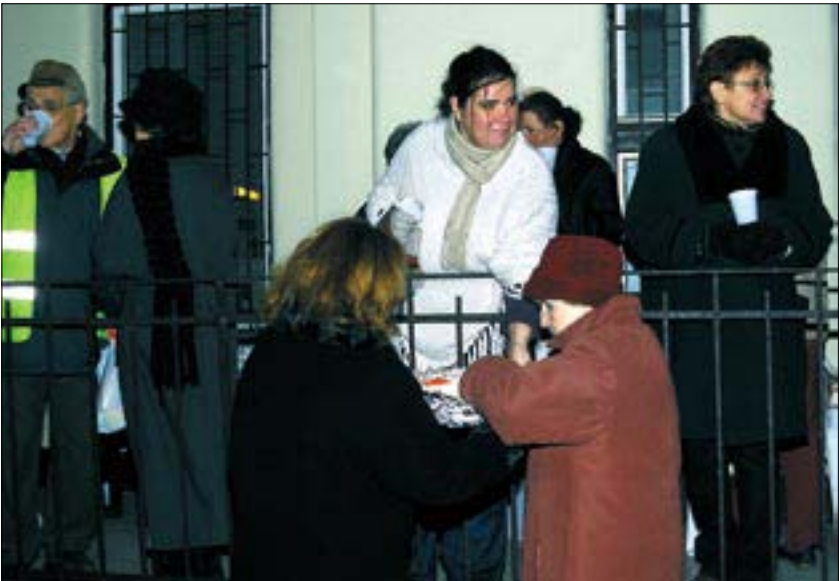
A forró tea és a finom karácsonyi házi sütemény is kelendő volt a -10 fokok hidegben