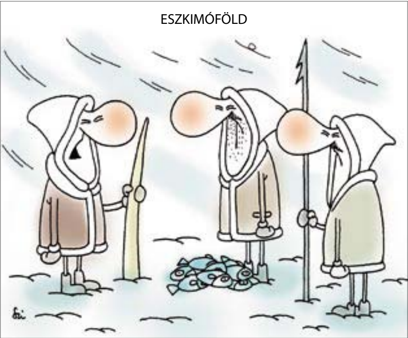
– Hozzánk is begyűrűzött a válság. Egy rozmárgagyar már csak 140 kiló fókaszírt ér!

A XI. Kerület Közbiztonságáért Közalapítvány 2009. évi 1. Kuratóriumi ülésének időpontja január 29. (csütörtök) 9 óra, a helyszín Újbuda Önkormányzata Polgármesteri Hivatal (Zombolyai u. 5. alagsor 1. sz. tárgyaló).