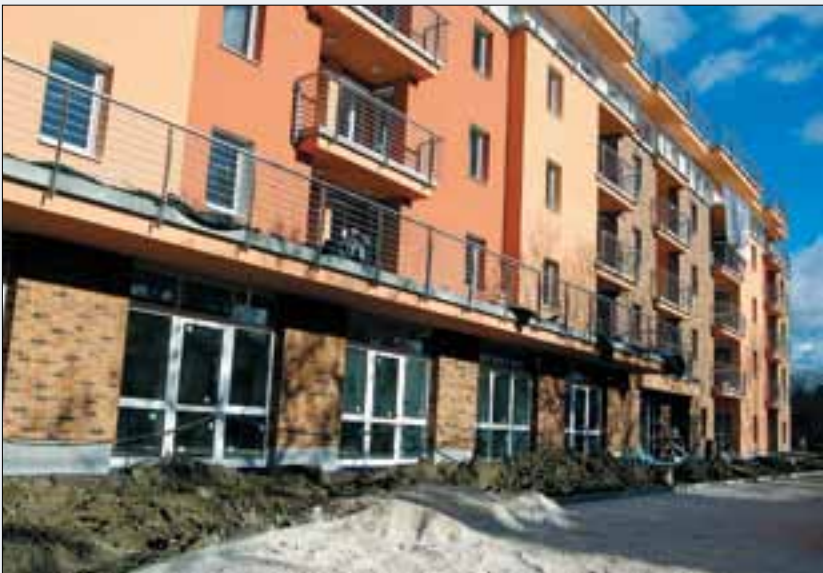
A Seniorház bejárata

ség feloldása a szabadidő hasznos eltöltésének megszervezése az igazi feladata ennek az újonnan szerveződő klubnak.