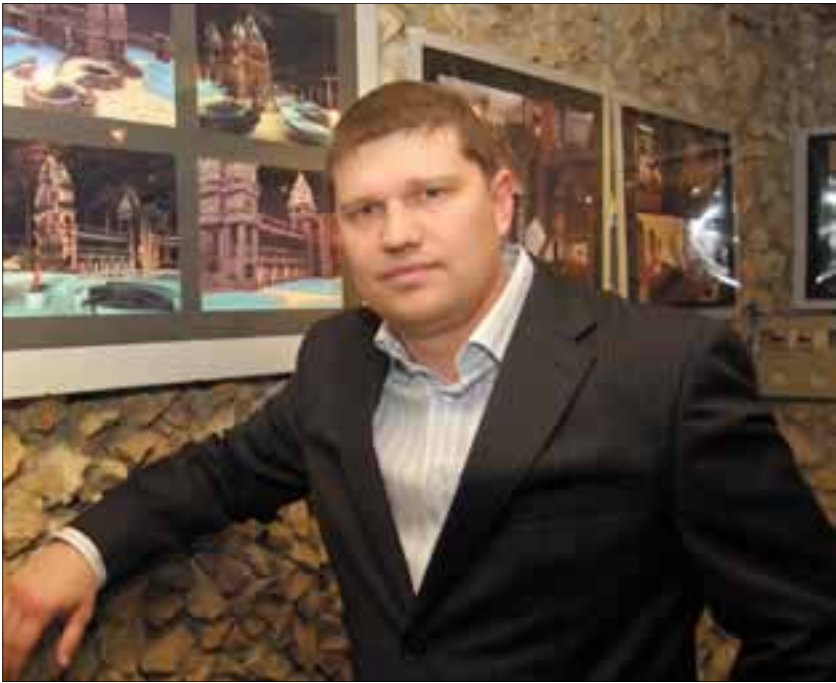
„Nekem itt tennivalóm van: visszaadni azt a sok mindent, amit kaptam Örmezőtől!”

Ilyen jellegű kerekasztalról nem tudok. Nyilván voltak egyéni megbeszélések, egyeztetések, én azonban alapvetőnek tartom a közös gondolkodást. Az örmezőiek már eddig is igyekeztek tenni önmagukért: voltak konkrét javaslataik, amelyekre még aláírásokat is gyűjtöttek, de az