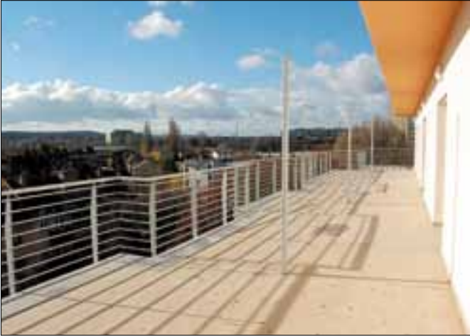
Kilátás a seniorházból

Érdeklődni lehet a 205-39-13 vagy a 06/30-676-1364 telefonszámokon, Radányi Ili személyes kapcsolattartónál.