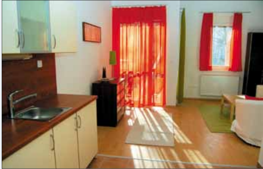
A Seniorház egyik mintalakása

egyedül éltek meg a mindennapjaikat, mostantól tartozhatnak valahova. A mi Klubunkba! Olyan jó lesz együtt, közösen ebédelni a Seniorház szép éttermében, közösen kávézni pavilonban! Tudni és ismerni egymás öröme, bánatát. Együtt nevetni és támasznak lenni, ha kell. Nosztalgia-délutánt és névnapokat szervezni. A szerda délutáni brids-