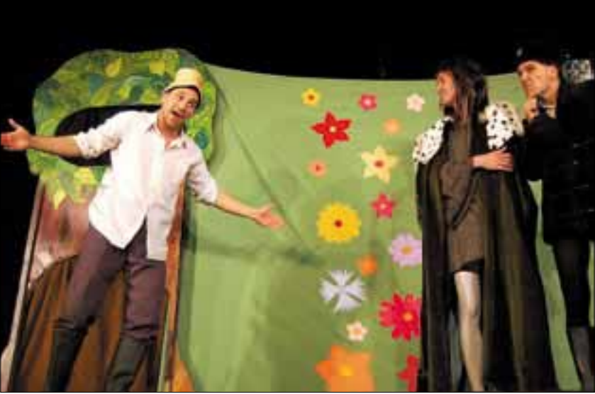
A gyerekek is segítették ötleteikkel a szereplőket

A furfangos paraszt, a pöffeszkedő bíró, a léha urak, valamint az álruhás Mátyás király, aki tanulságosan megjutalmazza őket, érdemük szerint... Ugye ismer- sek ezek a történetek? De jó is lenne, ha az igazságos uralkodó ma is köztünk járna! – emlegetik sokszor.