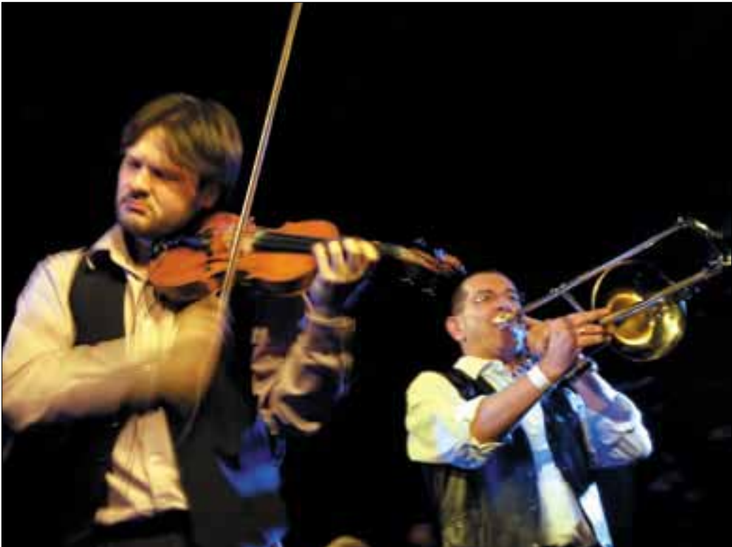
Moszkvától New Yorkig, Stockholmtól Jeruzsálemig számtalan alkalommal bűvölték el a közönséget

Igazi muzikális ingyencséggel szolgált az állóhajó január végén, amikor a műfájában kiemelkedő hazai elismertségnek és nemzetközi hírnévnek is örvendő zenekar adott koncertet. Népzene féktelen életörömmel és emelkedett szomorúsággal, hozzá egy csipetnyi komolyzene, blues és musical – ezt játszotta a Budapest Klezmer Band.