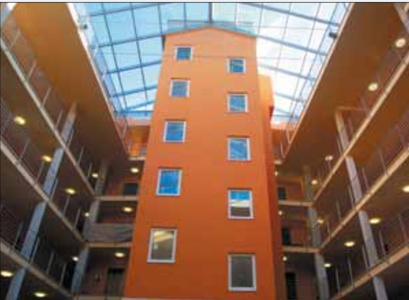
Üveg tetős átrium a belső udvarban

– „Intim sarok” – mentálhigiénés foglalkozás (egyéni és csoportos),