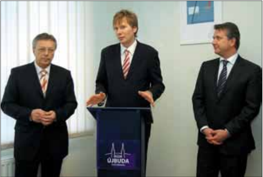
Lakos Imre alpolgármester, Fodor Gábor miniszter és Molnár Gyula polgármester

– Újbuda Önkormányzatától nem szokatlan, hogy nyitott az újszerű, haladó megoldásokra. Állandóan keressük a nem szokványos, hasznos újdonságokat – mondja Lakos Imre alpolgármester. – A kötelező feladatokon túl szeretünk jó célok érdekében kísérletezni és pluszmunkát vállalni, ha annak rövid, illetve hosszú távon is eredménye lehet. Ebben az esetben a villanyszámla mérséklődése mellett az a nagy eredmény, hogy a város megszaba-