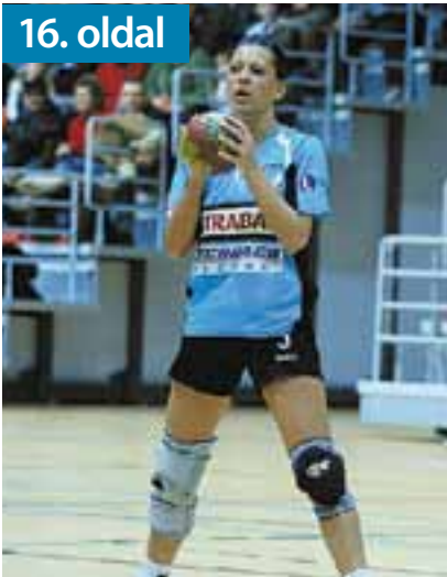
Nyertek az újbudai kézilabdás lányok