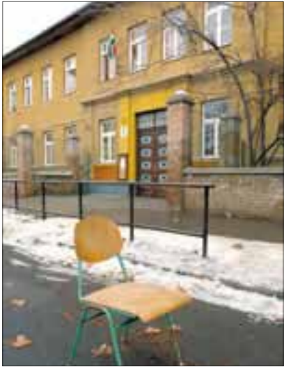
A Don Bosco iskola

Az Önkormányzat – a decemberi képviselő-testületi ülésen született döntés értelmében – átadta a katolikus egyháznak az albertfalvai Don Bosco iskola tulajdonjogát. Az intézményt egyébként évek óta az egyház tartja fent. A tulajdonjog átadásáról szóló megállapodást Erdő Péter bíboros és Molnár Gyula polgármester írta alá, ünnepélyes keretek között.