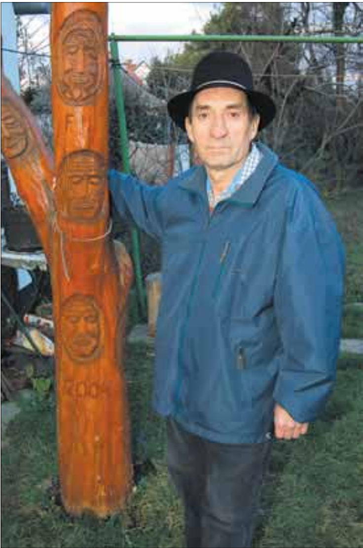
Tavasztól őszig a kertben készülnek a szobrok

megtanulni. Az anyag tulajdonságairól viszont nem árt előzetesen tájékozódni a szakirodalomból. Kedvenc fajtám, a tölgy igen kemény, de jól faragható, egy-egy ilyen szobor például akár három-négyszáz évet is kibír a szabad ég alatt. A legkevésbé nemes fajta pedig a fenyő, bár