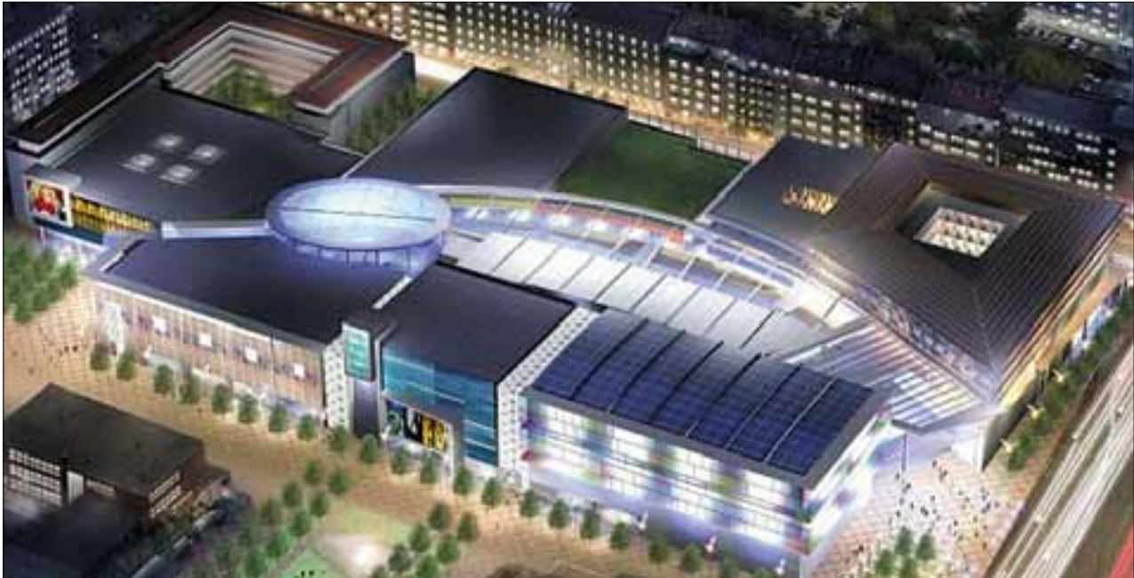
VÁROSKÖZPONT: Az egykori Skála áruház helyén épülő új épületegyüttes látványterve

Ezt feloldandó a költségvetési vita után kezdeményezni fogom, hogy közö-sen alkossuk meg a mindenki számára elfogadható újbudai minimumot. Ez ar-ról szólna, hogy a leglényegesebb prog-ramokat kiemeljük a napi politikából, azaz valamennyi politikai szereplővel közösén meghatározzuk, melyek azok a mindannyiunk számára fontos ügyek, amelyek nem sérülhetnek, amelyekben nincs vita. Ez alapján a főbb prioritások mentén tudunk dolgozni, 2010-ben pe-dig az akkor bizalmat kapó városvezetők ez alapján folytathatják a munkát, akár-