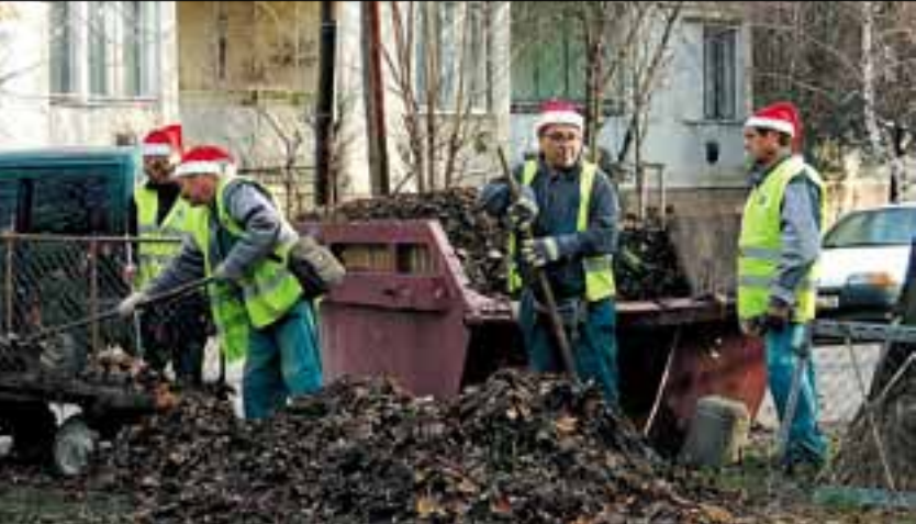
Az Újbuda Prizma Kht. dolgozói Mikulás napján az alkalomhoz illő „munkaruhában” végezték mindennapi munkájukat.