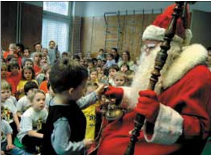
A gyermekek örömmel fogadták a Mikulást