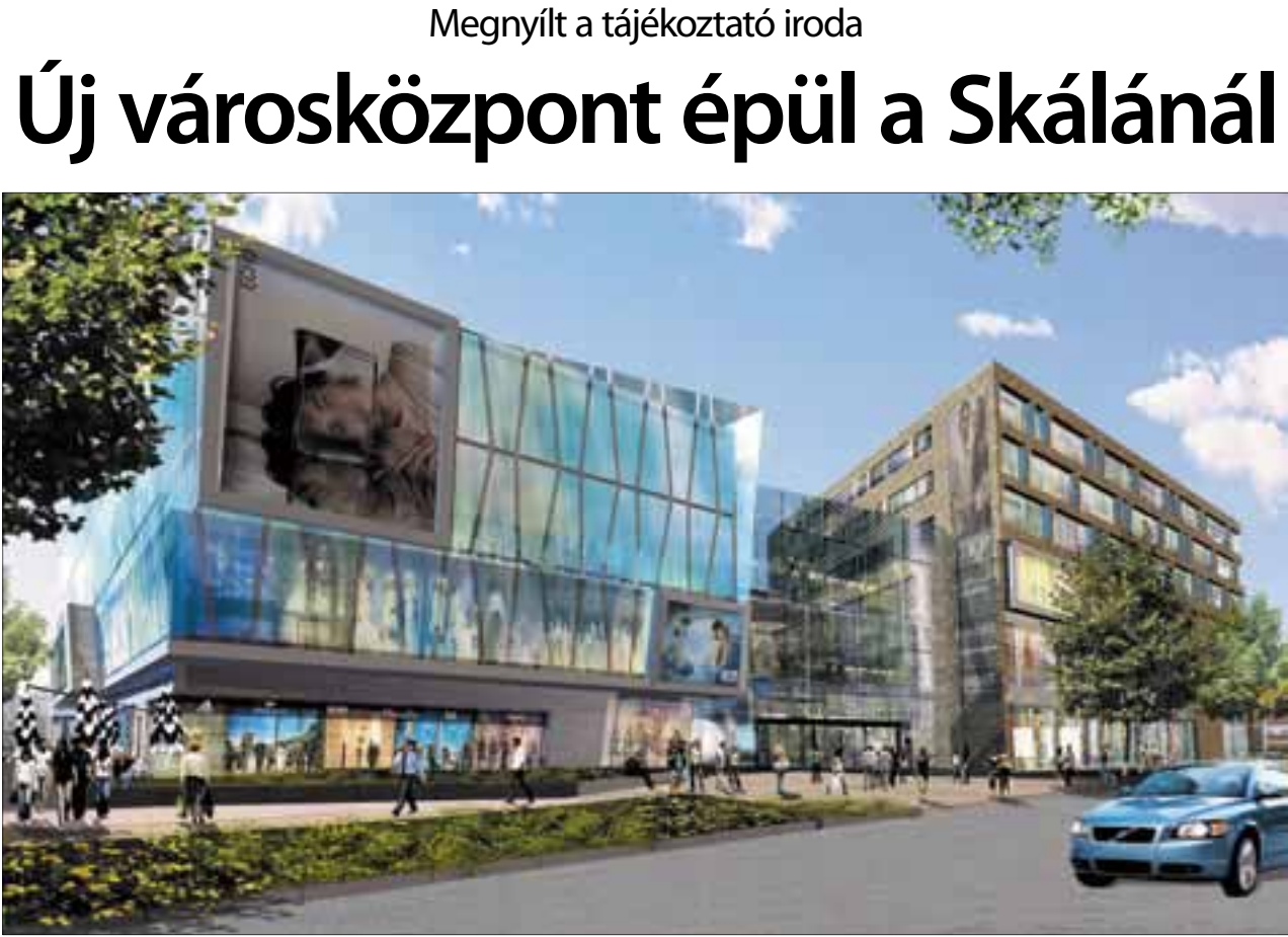
Az új tájékoztató irodában mindenki megtekintheti a megálmodott látványterveket

– Régi vágyunk, hogy Újbuda belvárosa megújuljon, a főváros egyik fontos kereskedelmi és kulturális központjává váljon, és ez két év múlva valóság lesz – mondta a polgármester. – Idén nyílt lehetőség arra, hogy a szabályozási terv módosításával megteremtjük annak feltételét, hogy egy korszerű, a kerület arculatához illeszkedő épületegyüttes jöjjön létre. Ebben az ING megfelelő partnernek bizonyult, hiszen nemcsak az egykori Skála helyén épít új központot, hanem az épület környezetét is átépíti. Átalakul a környék jellege, arculata: több zöld felület, több gyalogosoknak visszaadott terület, park és sétálóutca épül. A környék és az itt lakók élete minden bizonnyal teljesen meg fog