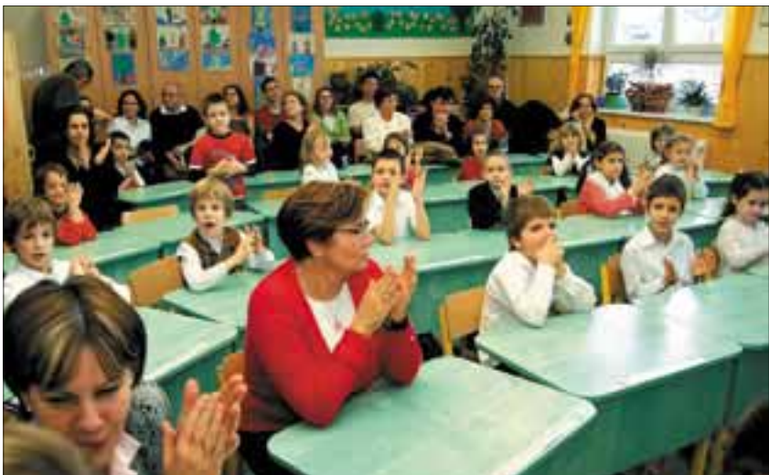
Az első és második osztályosok arcán szemmel látható az izgalom

A zavaró tényezők, mint a vakuk, a zsűri, vagy éppen a gyermekük helyett is aggódó szülők ellenére, vagy éppen ennek hatására nagyon eredeti és nívós előadások születtek, a közönség legnagyobb örömeire.