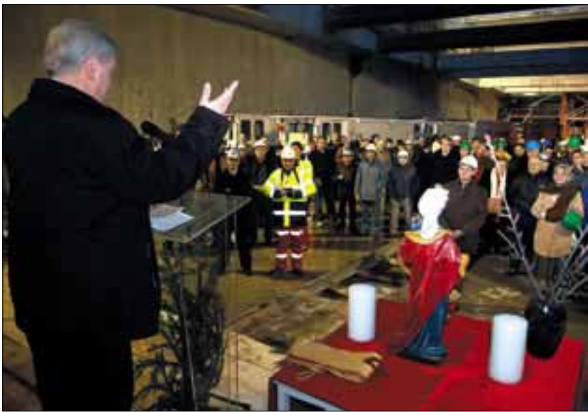
Szent Borbála a bányászok és alagútőrök védőszentje

Bensőséges ünnepel emlékeztek meg a 4-es metró építői és tervezői Szent Borbáláról, aki mások mellett a bányászok, az alagútőrök védőszentje is. Az Etele téri pajzsindító aknát kidíszítették, kis oltárt állítottak, amelyre egy Szent Borbála-szobrot és gyertyákat helyeztek.