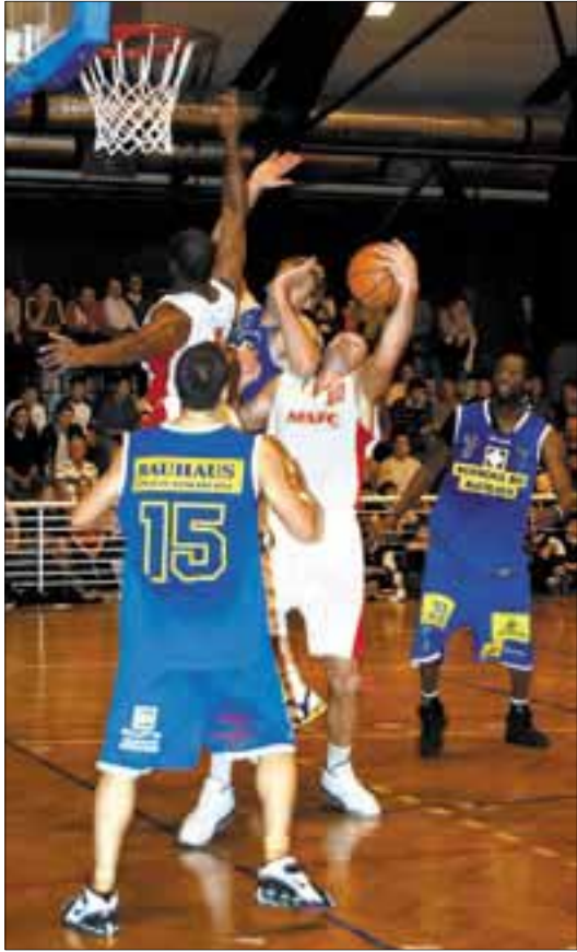
Győzelemmel szolgáltatt rá a Kosárlabdázás Városa címe