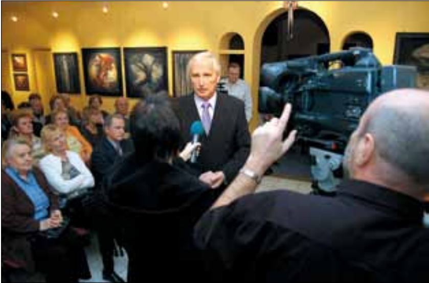
A volt egészségügyi miniszter tájékoztatta az ÚjbudaTV nézőit is

A tervezet legfőbb elvei alapján a Fidesz egy nemzeti egészségügyi kerekasztal felállítását tervezi, amely alkalmas az elvult egészségügyi rendszer továbbfejlesztésére, ugyanakkor állami kézben hagyja a kormányzati kórházokat, de főképp az SZDSZ által privatizáltnak kívánt társadalombiztosítást. A magyar törvény 117 évvel ezelőtt jött létre, alapjai a poroszországi „vaskancellár”, Bismarck nevéhez fűződnek. A rendszer a szolidaritás elvén alapul, amelyben az állampolgár a többi embertárs