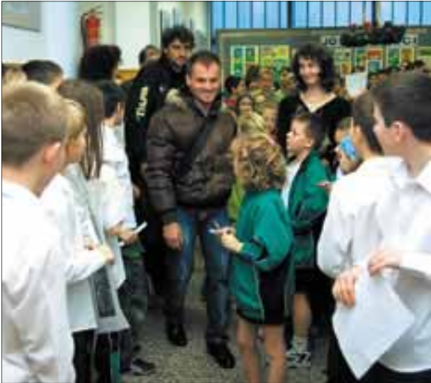
Az érkező Talmától sokan akartak aláírást kérni

A diákok kérdezhettek is a sportolótól, aki őszintén mesélt érzéseiről, életútjáról. Egy kislány például a maga 8-9 évével odaállt a klasszis elé, felnézett rá, és megkérdezte: „Volt már olyan, hogy elkeseredtél?”. Gábor elmondta, hogy bizony volt erre is példa, de ilyenkor a családja meg a barátai óriási erőt és motivációt jelentettek a számára. A motorversenyző azt is elmesélte, hogy