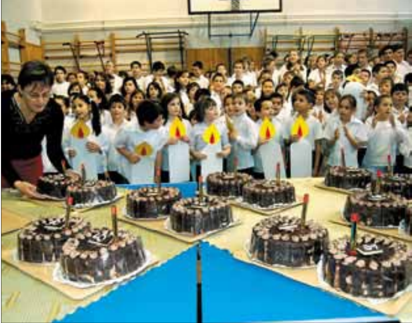
Az óvoda vezetői tortával kedveskedtek a diákoknak