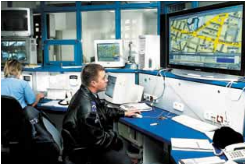
TECHNIKAI FEJLŐDÉS: Az újbudai kapitányság bevetésirányító központja

tonság szintjének egyfajta mutatójává. A rendőri vezetők egy része már akkor is hangsúlyozta, hogy a nyilvánosság számára (is) készülő kimutatásoknak nem szabad túlzott jelentőséget tulajdonítani, hiszen nem ez az egyedüli visszajelzés a kapitányságok munkájáról, noha kétségtelen, hogy a „kirakatba” rendszerint ez kerül. Nos, az elmúlt pár évben – különösen 2006-ban – a XI. kerületben ismertté vált kiemelt bűncselekmények száma soha nem látott alacsony szintre süllyedt. A