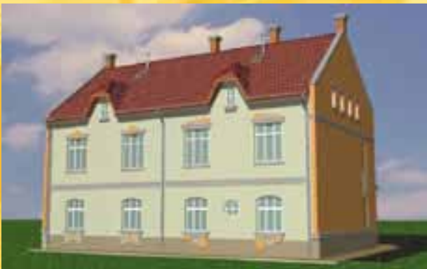
Átadás: 2007. október

Budapest, XI. Kondorosi út 45. szám alatti 4 lakásos kertes társasházban még egy, kertkapcsolatos, 81 m 2 -es lakás (nappali-étkező + 2 szoba), 11 m 2 -es terrasszal, gépkocsi beállóval megvásárolható!