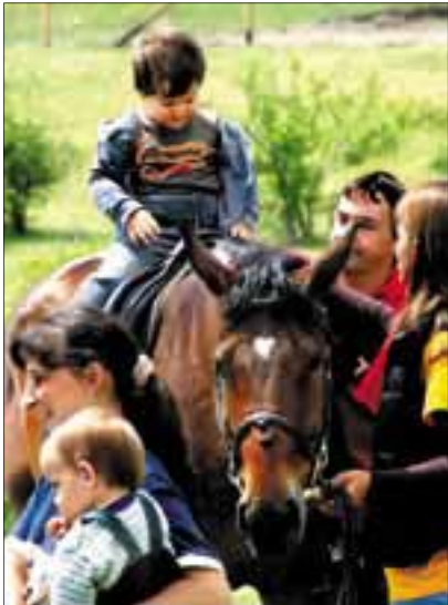
Most is nagy sikert volt a lovaglás

Egyszerűen érthetetlen, hogyan vetemedhet arra bárki, hogy egy érző lényt, amelyikről addig gondoskodott, kidobjon, és kóborlásra, kukázásra kényszerítsen, kitegye annak, hogy esetleg nem találja föl