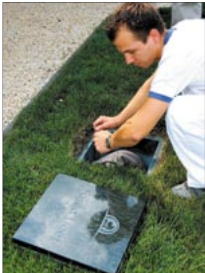
SASAD-LIGET: Az alapkőletétele pillanata

Az egykori Kinizsi-laktanya helyén sokáig csak leromlott épületek, parlagfű és sívár betonkerítés volt. Most azonban megindult a terület beépítése. A Sasad-liget lakópark alapkővének lerakásával egy emberi léptékű épületekkel, változatos méretű lakásokkal felépülő lakónegyed született meg.