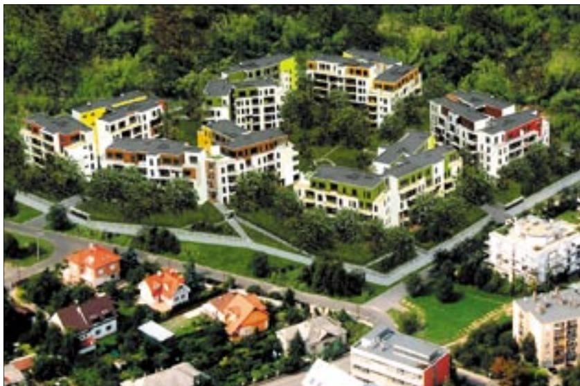
A lakások mindegyikéből jó a kilátás: nem egymást nézik a házak