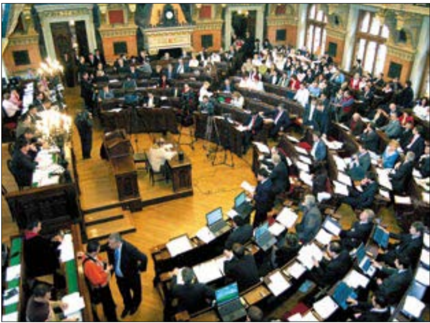
FŐVÁROSI KÖZGYŰLÉS: Osztanak és szoroznak

Budapest vezetése a 34 milliárd forintot tervezett működési eredményt fejlesztésre, illetve pályázati önrészre fordítja majd. Újbudán 2007-ben a 4-es metró építésén túl néhány nagyobb beruházást