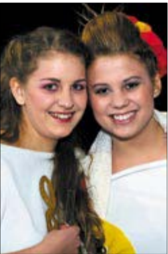
Barátok közt – Múzsák közt

finom a pizza, amit a gyerekek kapnak és jó a tea. És most, hogy beugorhattam egy mesélő bácsi szerepébe, már szárnyalok is.