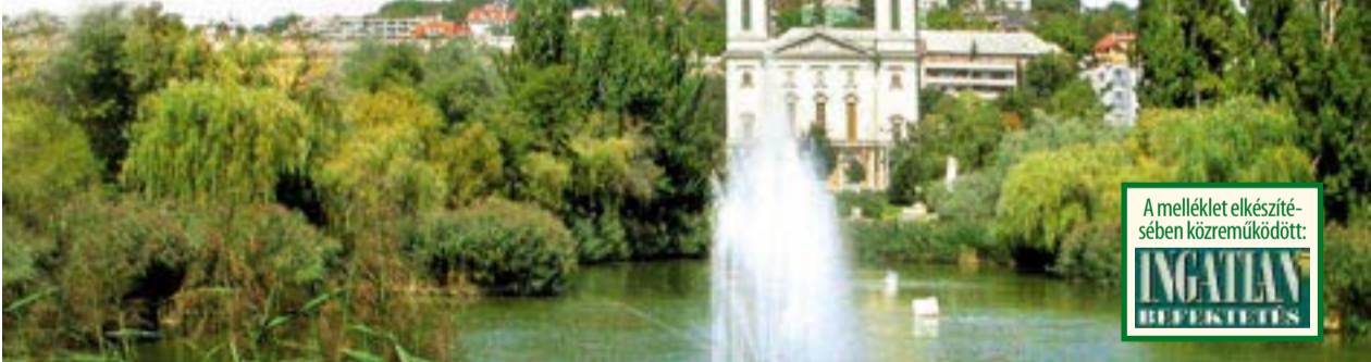
A melléklet elkészítésében közreműködött: INGYEN RÖVIRATOK

A közlekedés modernizálása, azaz az új lehetőségek nyomán születő közlekedési igények kielégítése is folyamatos. Másfél éve meghosszabbított útvonalon jár például a 18-as villamos, amelynek végállomását a Savoya Parkhoz telepítették. A következő két-három év tervei között szerepel, hogy a fővárossal együttműködésben az 1-es villamos pályáját a Lágymányosi hídon átvezessék, majd folytatásaként végigmenjen a Szerémi úton, szintén a Savoyáig. Jelenleg az előkészítést dolgozik a kerület. További feladat az Andor utca kiépítése, amely az Eger út–Szerémi út összeköttetését jelenti. Az úthálózat és közlekedés további fejlesztését generálja a 4-es metró építése, amely nehézségeivel együtt kerületterületi jelentőségű lesz.