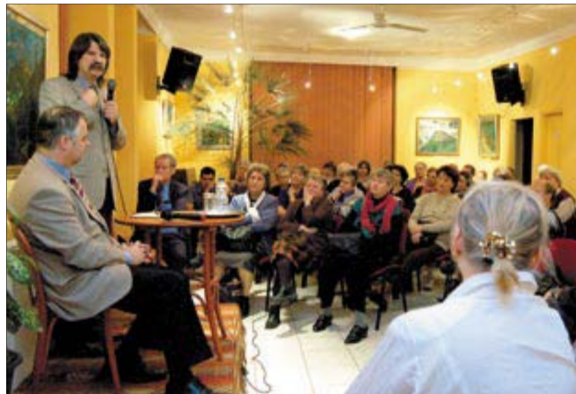
Kövér László: Népszavazást kellett volna kiírni az iskolabezárásokról

Február 27-én 18 órakor nyílt beszélgetést tartottak a Fidesz XI. kerületi szervezetének irodájában, ahol az ország jelenlegi helyzete és a reformok témája volt terítéken. Az eseményen a Fidesz tagozatának tagjai, képviselők és érdeklődők is részt vettek. Az egyébként Budai Klub Galériaként is működő iroda színtűltig telt a téma iránt érdeklődőkkel, ugyanis közel nyolcvan látogattak el az eseményre. A fórum elején Kövér László, a Fidesz országos választmányának elnöke tartott előadást, felszólalása után pedig a feltett kérdésekre válaszolt. A Fidesz-MPSZ szerint a kormány az iskolabezárásokkal kapcsolatban nem kérte ki a lakosság véleményét, színtűltük ugyanis népszavazást kellett volna kiírni a témában. Kövér László továbbá elmondta, hogy a kórházak bezárásával sem értenek egyet, illetve a pedagógusok elbocsátását sem gondolta át és készítette elő megfelelően a kormány.