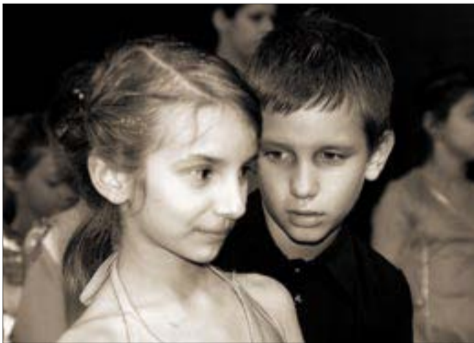
Itt már járt a Múzsá...

vetélkedőről, hanem egy filmről van szó. Méghozzá nem is akármilyenről: 30 fős stáb háromnegyed éven át dolgozott azon, hogy közel kétszáz gyerek mutathassa meg magát. Nemcsak előadók és alkotók vettek részt a produkció elké-sztésében, hanem ifjú színészek, szövegírók, jelmez- és díszletter-vezők, illusztrátorok és operatőrök is. És a sok új arc mellett egy-két régi ismerős is feltűnt.