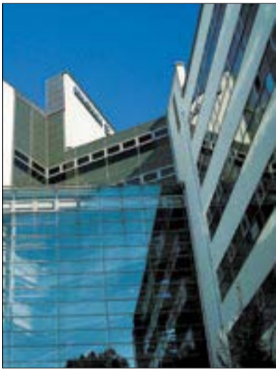
A kerület ideális az irodaközpontok számára

Az, hogy a befektetők célpontjai között is dobogós helyen szerepel, nem csak üzleti szempontból igazolja népszerűségét. A befektetők aktivitása ugyanis azt is jelzi, hogy a helyszín közkedvelt lakóhely, ezért érdemes itt lakásokat építeni, a tu-