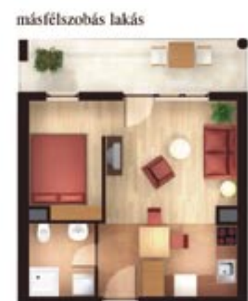
másfél szobás lakás