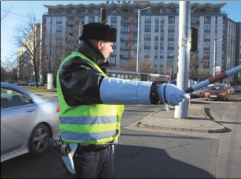
A Budafoki út és az Irinyi József utca találkozásánál található közlekedési jelzőlámpa vasárnap este 11 óra körül – feltételezhetően egy baleset miatt – meghibásodott. A javítást és karbantartást végző Siemens a hét közepére ígéri a jelzőberendezés helyreállítását, egyben korszerűbb és jobban látható, fénypontos lámpákra cserélik ki a régiket. Újbuda forgalmas csomópontjában a javítás befejezéséig a csúcsforgalmi időszakban rendőrök irányítják a forgalmat.