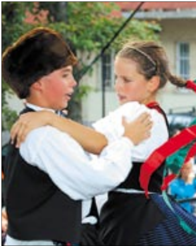
Néptáncospár a tavalyi Tóparti Újbuda Party-n