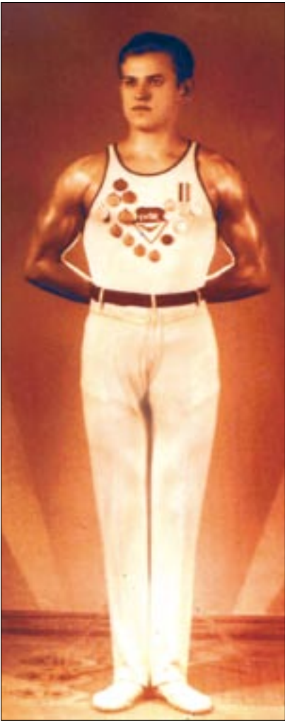
A fess, fiatal tornászbajnok

A Kispesti AC-ban elkezdtem edzősködni. Ebben a kezdeti időszakban, valamikor