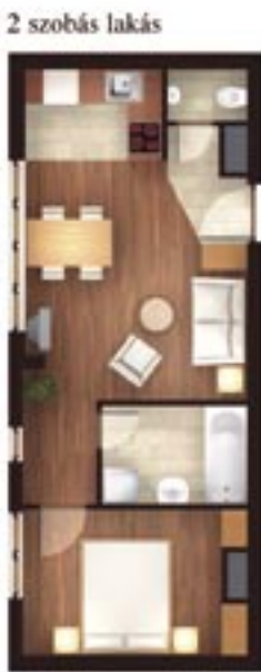
2 szobás lakás