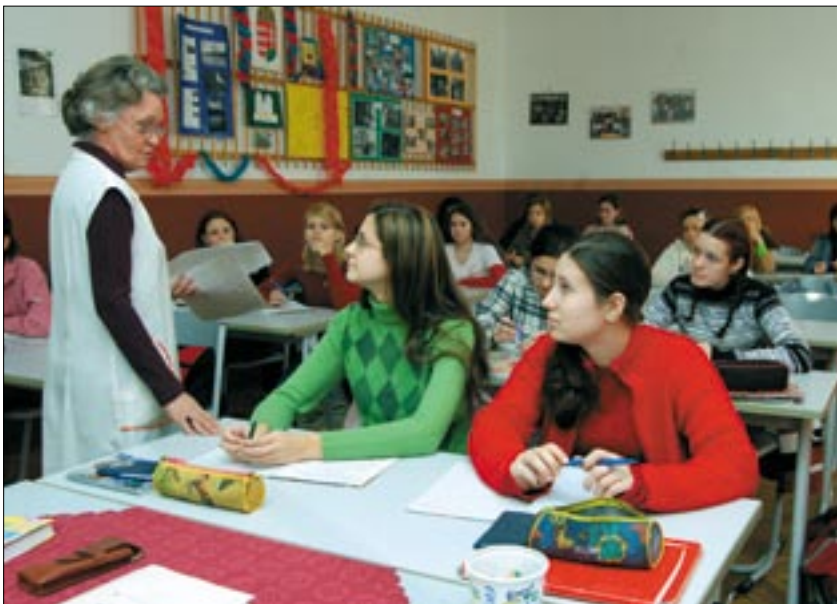
Számvitel óra a Fényes Elek Szakközépiskola 12/b osztályában

„Szeretném leszögezni azt is, hogy szakok nem fognak megszűnni, tehát minden diák biztos lehet abban, hogy sikeres jelentkezése esetén azt a szakmát tanulhatja tovább, amelyekre jelentkezett. Amennyiben olyan iskolába adta be jelentkezését, amely később integrálódik, még a Közgyűlés döntése után is egy hónapja lesz arra, hogy eldöntse, a felvételi lapon megjelölt intézmények közül (a sorrendtől függetlenül!) melyik iskolában akarja folytatni tanulmányait.”