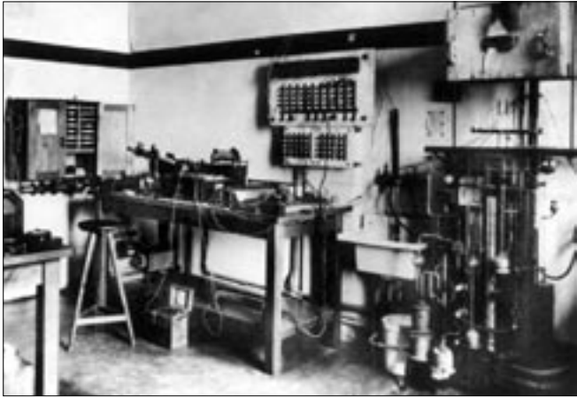
Az Egyesült Izzó elektroncső-laboratóriuma 1930 körül

Idén 225 éve alapították a Műszaki Egyetem jogelődjét, az évfordulóról gazdag programsorozattal emlékezik meg az intézmény. Ennek részeként február 14-én 14 órakor kiállítás nyílik a BME OMIKK aulájában 90 éves a magyar elektroncső címmel, amely március 1-jéig tekinthető meg.