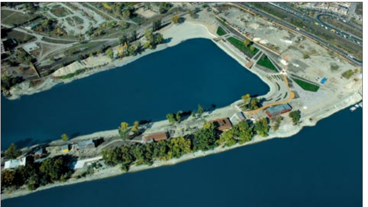
A Lágymányosi-öböl és a Kopaszi-gát légifelvétele (lent) Az épülő infrastruktúra távlati és közeli képei (fent)

Kereszténydemokrata Néppárt, frakcióvezető