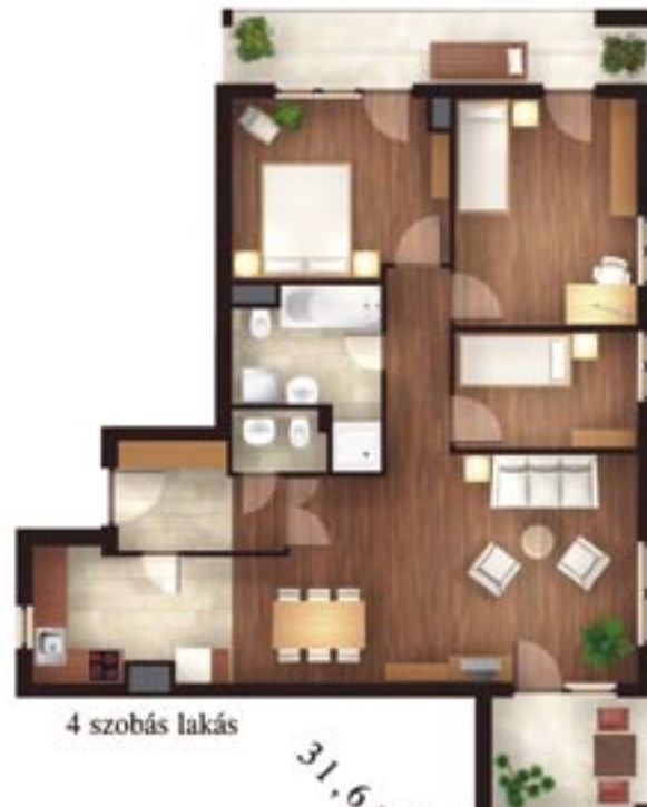
4 szobás lakás