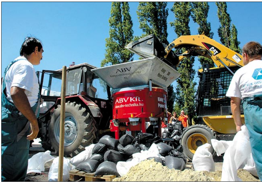
A csodagép 4200 homokzsákokat tölt meg óránként