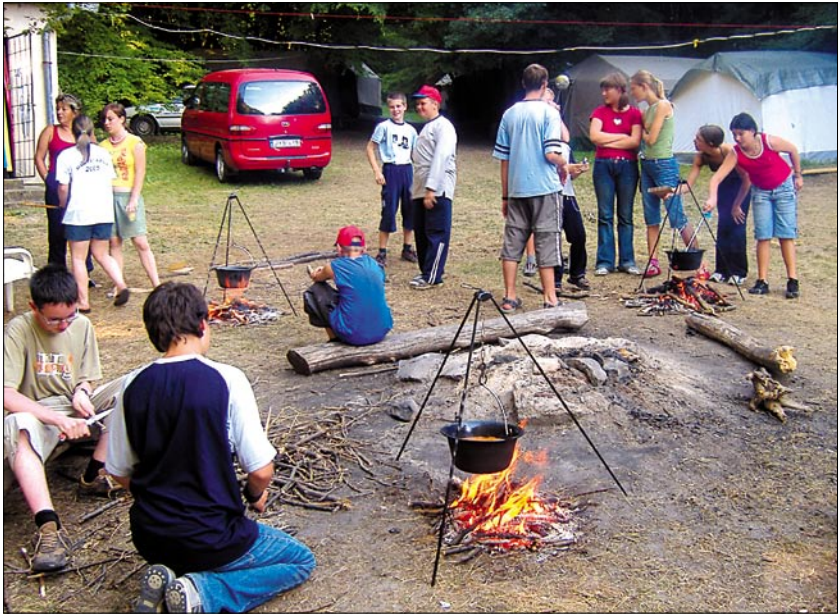
Jó a bográcsolás, csak nehéz kivárni a kóstolás idejét

– Önismereti játékokat szervezünk nekik, s így felfedezhetik saját képességeiket, valamint önbizalomra tehetnek szert. Ez segíthet a szabadidő hasznos eltöltésében, s a későbbiekben a bűnözés elkerülésben is.