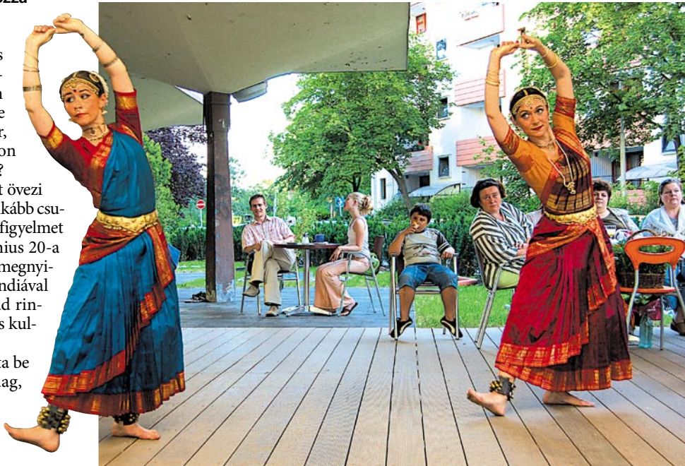
A Sivasakti Kalánanda Táncszínház csinos táncosnői

láb előadott, előkelő kézműszíndarabokból, arckifejezésekből és lábmunkából álló táncukat nagy tapssal fogadta a közönség.