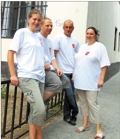
A szolgálat munkatársai fiatalok és vidámak

A meglehetősen rossz műszaki állapotban lévő épület nyolcmillió forintból újították fel és rendezték be, amelynek felét a kerületi önkormányzat biztosította pályázati önrészként. A Fővárosi Gázművek hárommillió forintos támogatásával a gázt is bevezették, és a cég átvállalta a közműfejlesztési hozzájárulást. A házban kényel-