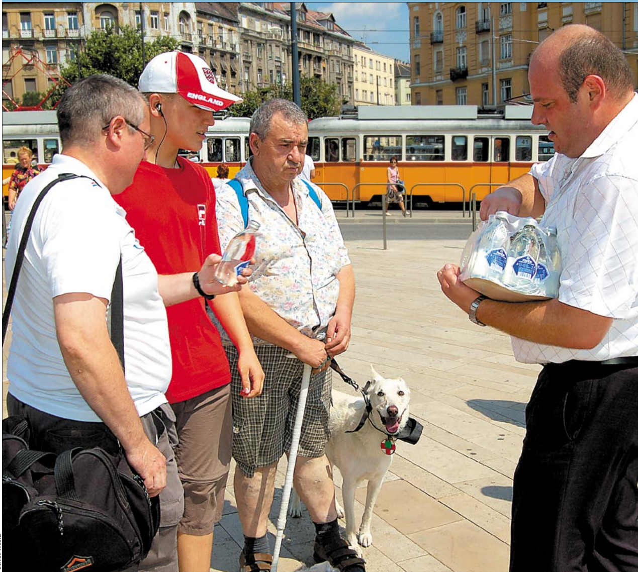
A júliusi kánikulában a a Fővárosi Polgári Védelmi Igazgatóság önkéntesei osztották a palackos ásványvizet a Móricz Zsigmond körtéren

Bár pénteken egyes hírportálok arról adtak tájékoztatást, hogy az Országos Tisztifőorvosi Hivatal elrendelte a legmagasabb, harmadfokú hőségriadót, ez mégsem történt meg, mivel a középhőmérséklet-emelkedés nem folytatódott, és a meteorológusok némi csökkenést prognosztizáltak. Ugyanaznap a Fővárosi Védelmi Bizottság rendkívüli ülésén meghozta Budapest hőségriadó rendeletét.