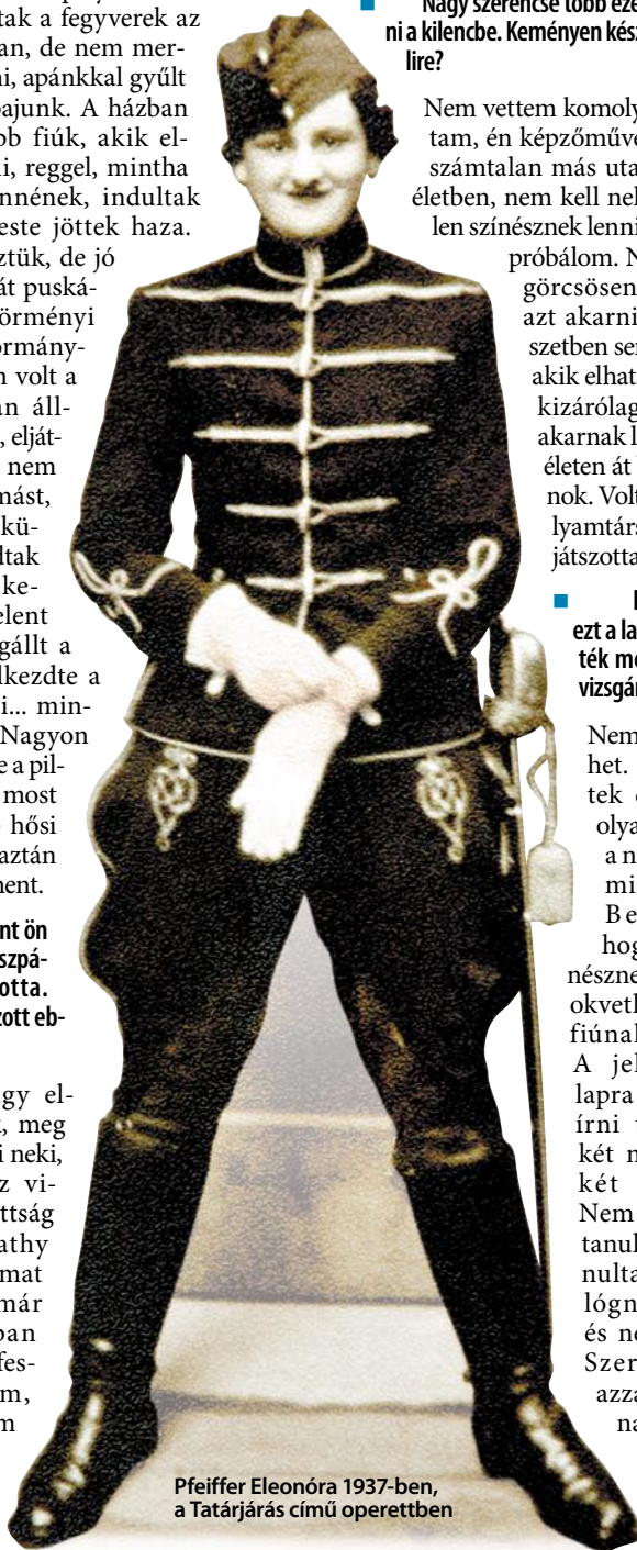
Pfeiffer Eleonóra 1937-ben, a Tatárjárás című operettben