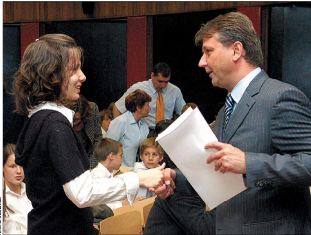
Molnár Gyula polgármester a legjobb diákokat és tanáraikat üdvözölte

A kemény versenyek után június 12-én a Zombolyai utcai TIT Stúdióban vehették át az ifjú sportolók megérdemelt jutalmukat. A díjátadó ünnepséget Molnár Gyula polgármester és Nagy József igazgató bevezette nyitotta meg. Kerületünk polgár-