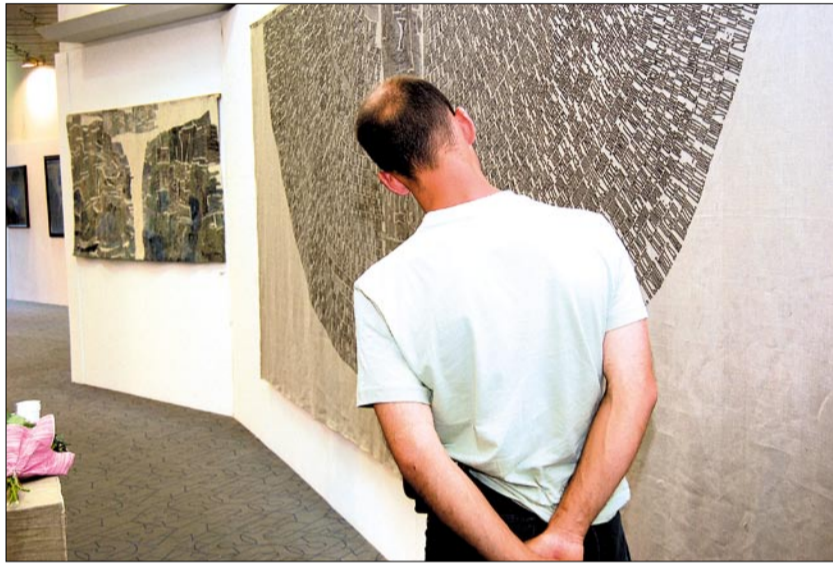
A textilbe szőtt szövegtörmelékek böngészésének csak a nyitvatartási idő szab határt