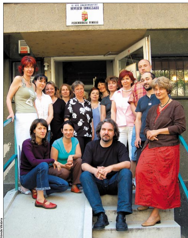
Itt mindenki jól érzi magát

pszichológusok segítségét igénylők száma. Persze az sem kizárt, hogy nem a problémák száma nőtt meg, hanem a felismerésük aránya javult. A mind korszerűbb eszközöknek és módszereknek köszönhetően manapság igen differenciáltan fel lehet állítani a diagnózist, így a gyógyítás is gyorsabbá és hatékonyabbá vált.