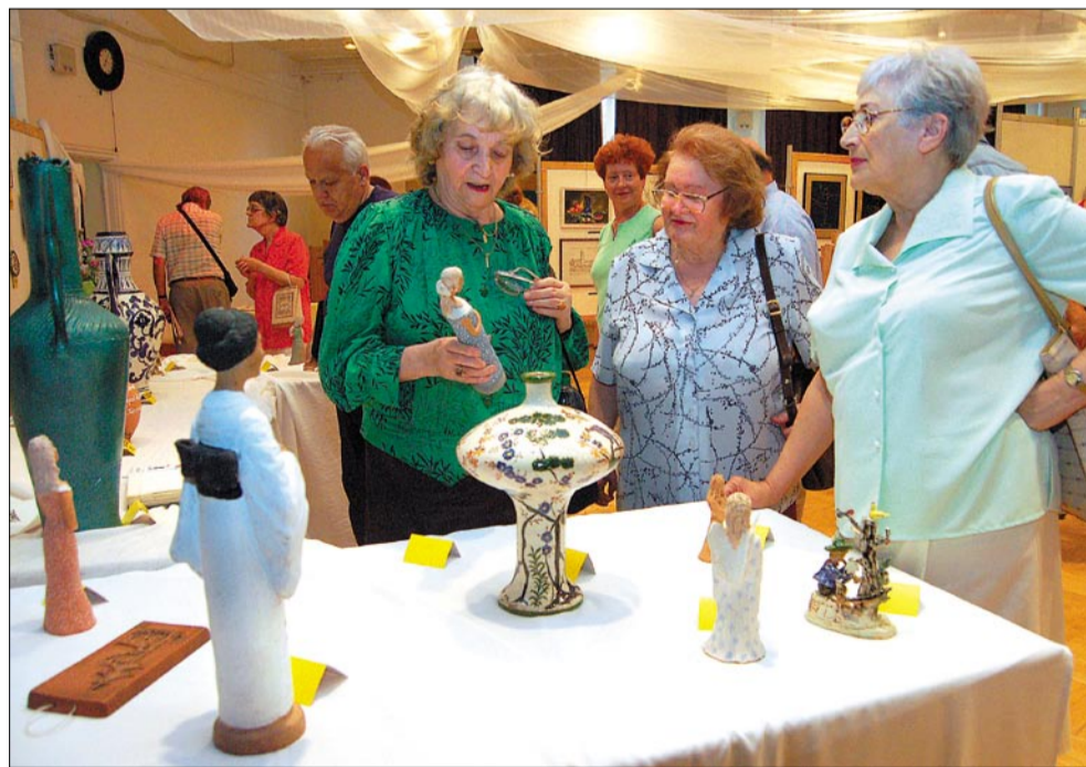
A látogatók néha nem tudták magukat túrtörtetni: kézbe vettek egy-egy tetszetős darabot