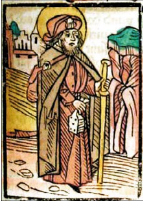
Szent Jakab (Illusztráció a Pannónhalmán őrzött Legenda Aurea Sanctorum című 1482-es augsburgi kiadásából)

it. Ő a bűnbánók, a megtért bűnösök, a foglyok, az eltévelyedettek, az asszonyok, a fodrászok, a fésűkészítők, a kertészek, a kádárok, a szőlészek, a borkereskedők védelmezője, aki óv a szembetegségektől, a féregtől és a szőlőt pusztító zivatartóktól.