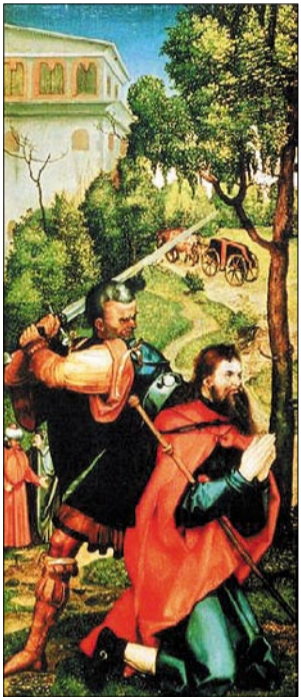
Albrecht Dürer: Szent Jakab vértanúsága (1508 körül)

JÚLIUS 25-E Jakab napja, aki az apostolok közül elsőként szenvedett vértanúhalált. Ő a búcsújárók, az utasemberek, s a hajósok védőszentje. Jakab zivatart hozó kedvére utal a néphagyomány, mely szerint ekkora le kellett aratni a zabot, mert ami a földeken maradt, az elvesz. A szőlőtermesztők úgy tartották, e napon abbahagyja a szőlő a növekedést, édesedni kezd. Időjárásjósló hagyomány is kötődik hozzá: a várható télre következtettek a Jakab-napi időjárásból. A délelőtti a karácsonyi, a délutáni a karácsony utáni időjárást mutatta meg. Ha sok felhő gomolyog az égen, akkor sok és nagy óra kell számítani a télen.