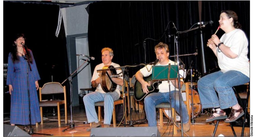
Az Édaín együttes névadója a királyi felségjog istennőjeként egész Írországot jelképezte