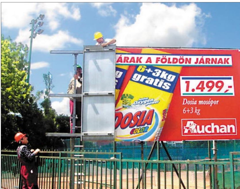
A szakszerű bontás legalább 100 ezer forintba kerül