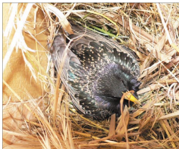
Odúellenőrzéskor az egyik tojó rendíthetetlenül kitarított a tojásán

A mesterséges fészkesodúkkal növelhető egyes énekesmadár fajok állománya, mivel a városi környezetben kevés a természetes fészkesodú. Az eddigi felmérések szerint még csak kevés odút foglaltak el madarak az öbölben, de az már látszik, hogy seregélyek is megtelepedtek némelyik faladikában. Ezek a vidám, zajos madarak, ha nem is látszanak a lombok között, hangjuk alapján mindig észlelhető jelenlétük. Nagyon változatos hangjuk van, amelyet énekek alig lehet nevezni, viszont az utánzásban nagymesterek.