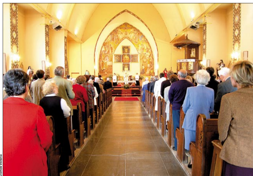
A templomépítő elődökre emlékeztek az ünnepi szentmisén