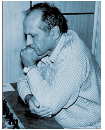
Örök kedvence a szimultán

Alapvetően igen. Örülök, hogy néhány év szünet után, a Postás-Matáv NB I-es gárdájával való fúziót követően most megint van sakkélet az MTK-ban. Bár engem is hívtak, én azonban már nem akarok versenyszerűen sakkozni. Élem a nyugdíjasok életét, június 13-án betöltöttem a 73.