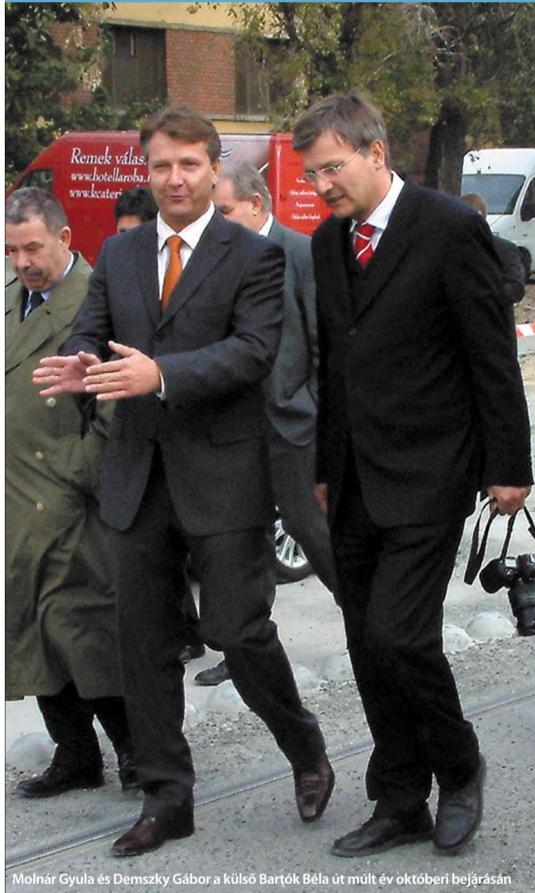
Molnár Gyula és Demszky Gábor a külső Bartók Béla út múlt év októberi bejárásán

Az öt parlamenti párt döntött, vagy lapzártá után dönt főpolgármester-jelöltjéről. Pénteken a Balatonörszödi kihelyezett kormányülésen bejelentették, hogy Demszky Gábor lesz az MSZP és az SZDSZ közös jelöltje az őszi önkormányzati választáson.