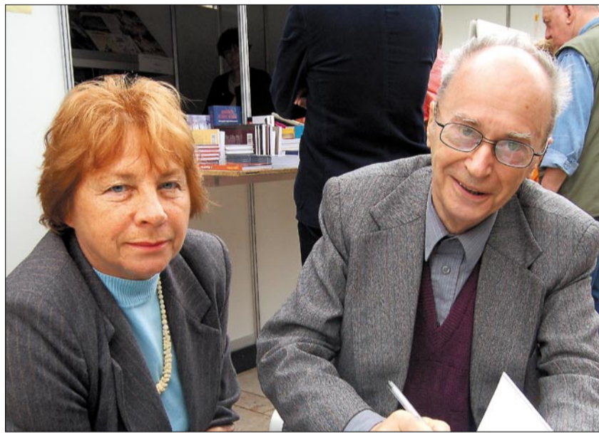
Domokos Máttyás vitákra okot adó kötetet állított össze Illyés Gyula és József Attila kötődéséről