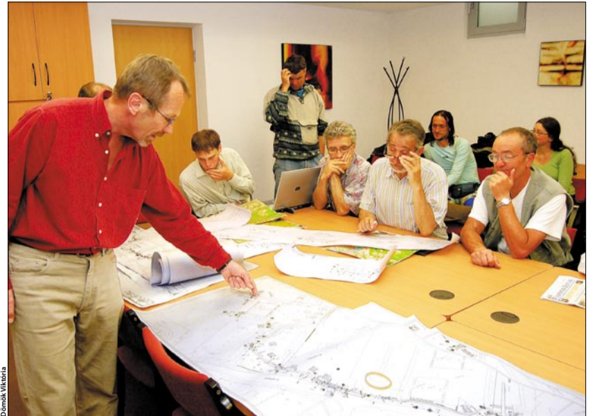
A tervező felfelé a Kaptató sétányt javasolja a kétkerekűeknek

Ezt a véleményt igyekeztek alátámasztani az egyeztetésen résztvevő kerékpárosok. Az egyik hozzászóló nemzetközi tanulmányok tapasztalataival érvelt. Ezek szerint az úgynevezett osztott, va-