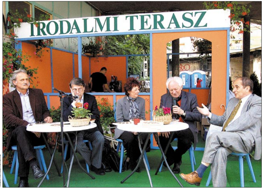
Az írók-művészek pódiumvitáit sokan követték nyomon