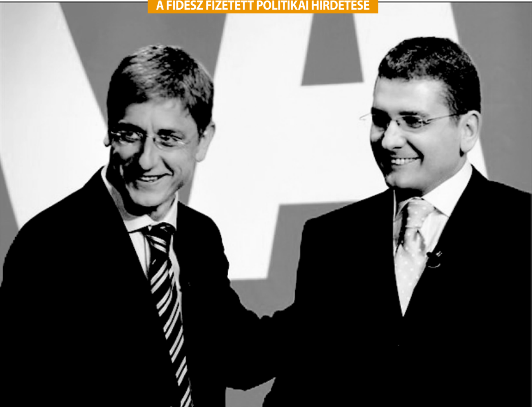
A FIDESZ FIZETETT POLITIKAI HIRDETÉSE