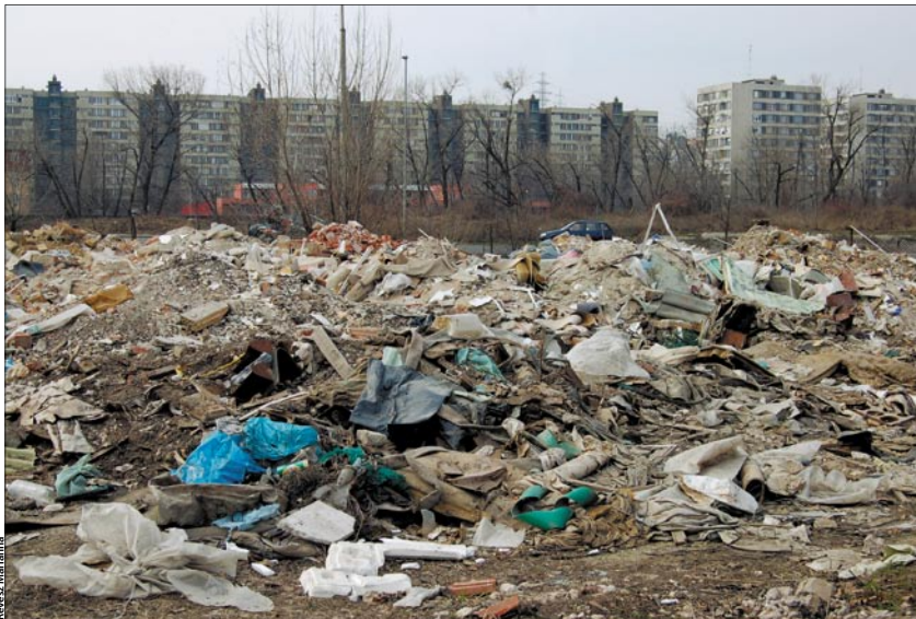
A szemétkupacban olyan dokumentumokat találtak, amelyek elvezettek a tetteshez