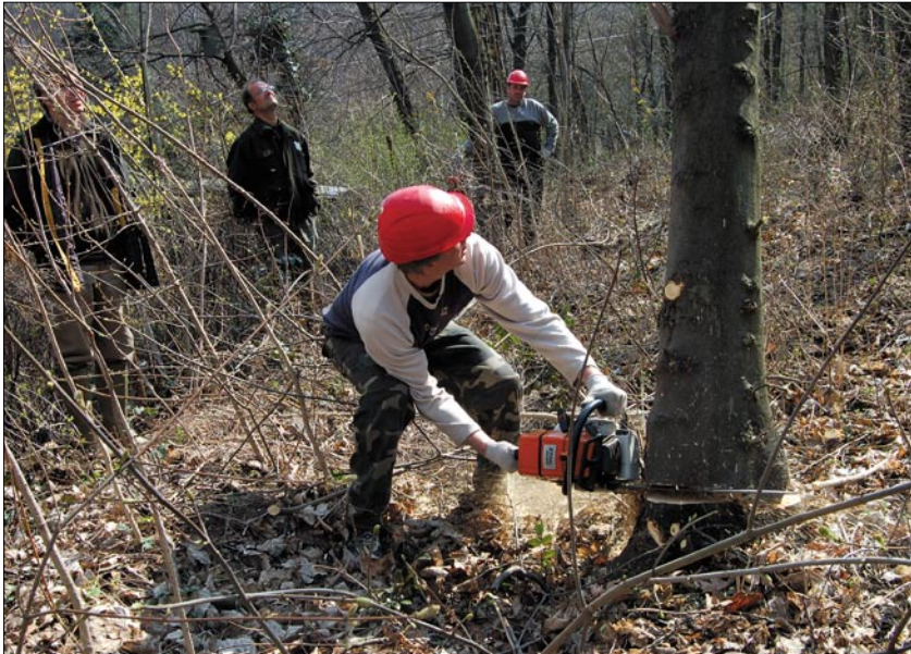
Nem várják meg, amíg a beteg fa magától kidől

Az erdészet elsődleges feladata, hogy fenn-tartsa az erdőt. Az öreg fák helyén újakat kell nevelni, ezt szolgálja a fakitermelés. Az erdészet kivágja az életkoruk végéhez