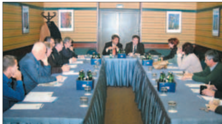
A kerület baráti köre támogatta a névadás ötletét

Az ünnepi események különleges időszaka a május 29-i évfordulótól a november 11-i Kerület Napjáig terjed, de az év minden napján történhet valami érdekes és jó. Fontos, hogy minél többen maguknak érezzék az ünnepségsorozatot, valamint, hogy annak során minél többen meg tudjanak nyilvánulni. A 2005. november 11-én