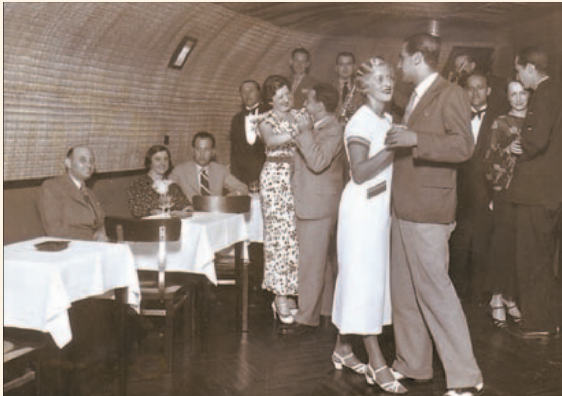
Táncmulatság a Szatyorban a harmincas évek közepén. Boldog, szerelmes békeidők, ki gondol már a Nagy háborúra...

A Hadik Kávéház – vagy a régi köznyelv szerint a Hadik – helyén, a Bartók Béla út 36–38. sz. alatt csak egy emléktábla emlékeztet Karinthy Frigyes egykori törzshelyére. Előző számunkban írtunk a helyreállítás terveiről, betekintettünk a kávéház történetébe, a kávéházi életbe. Cikkünk második része a Hadik kultúrtörténetéről szól.