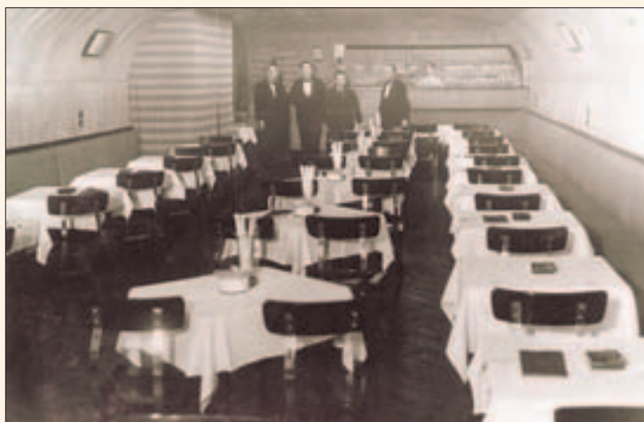
A Szatyor bár és pincérei. Első a vendég!