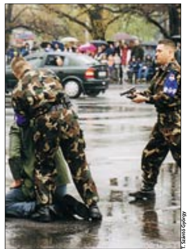
Látni lehet ilyet Budapest utcáin is

Az ezredestől Molnár Gyula vette át a szót. Újbuda polgármestere szerint a nyílt nap kiváló lehetőség arra, hogy a XI. kerület megmutassa magát, és a lakosokban is megerősödhet a városrész iránti kötődés, az összetartozás érzése. „A jó lovas