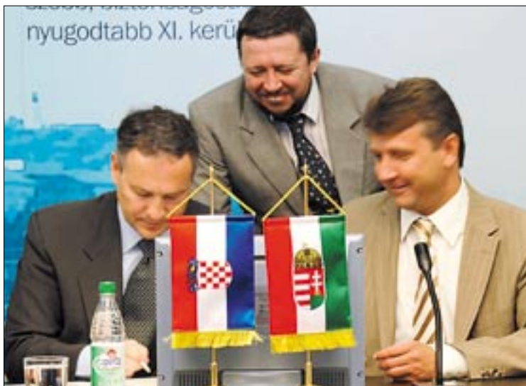
Vedran Rožić, Trogir város polgármestere és Molnár Gyula, Újbuda polgármestere

a képviselő-testület úgy döntött, az idei és a következő két évi költségvetésében fedezetet biztosít a Fehérvári úti Szakorvosi Rendelő felújításához mintegy 740 millió forint értékben.