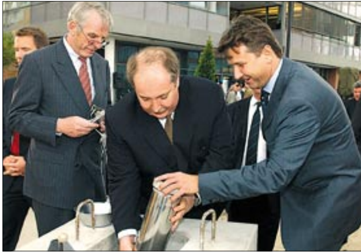
Jövő ilyenkorra már beköltözhetnek az új bérlők

A most épülő „C” irodaház kivitelezője, az első infoparkbeli épületet is létrehozó, Strabag Rt. A hateletemes „C” irodaházban 12 700 négyzetméternyi bérbeadható iroda lesz. A ház alatt 163 autó befogadására alkalmas mélygarázst építenek. A teljesen kli-