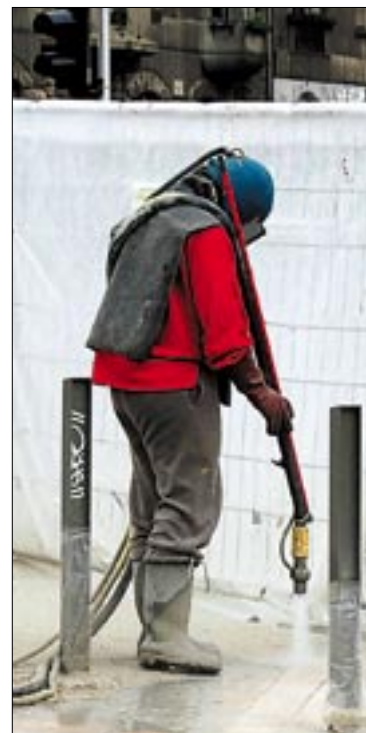
Síkos volt a Körtér kövezete. Az ígéretek szerint ezután nem lesz az.