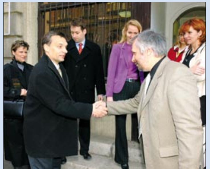
Kerületi programja során április 14-én a volt miniszterelnök meglátogatta szerkesztőségünket, és interjút adott az Újbudának. Írásunk az 5. oldalon olvasható.