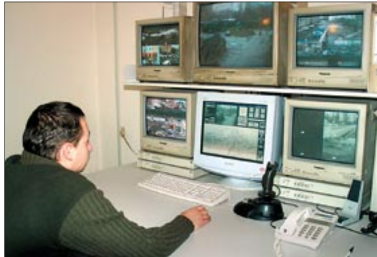
Folyamatos a felügyelet, ám a bűnözők jól tudják, hol a kamera

sajátos fúvós-gitáros-ütős-cimbalmos, nagyvárosi folklót játszik. A cigány mellett egyiptomi, libanoni, afgán és örmény tradíciókat éppúgy feldolgoz, mint balkáni, román, valamint magyar népzéneket. Tagsága sem roma eredetű. Talán ennek köszönhető, hogy koncertjük alatt a fellépett roma