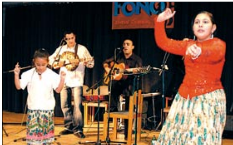
A táncot nem lehet elég korán elkezdni - és nem szabad abbahagyni

zsúfolásig töltötte a táncteret. A roma tánc és zene népszerűségét jelezte, hogy nemcsak cigányok táncoltak, hanem magyarok is, néha a cigányok