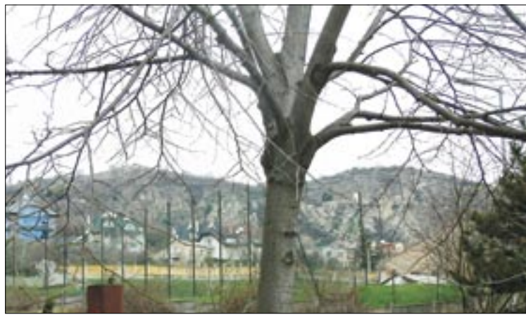
Rendezni fogják a kialakult lehetetlen állapotokat

balesetveszélyes a kisgyermekkel vagy babakocsival közlekedők számára. Ezért találkoztam sürgettem a Fővárosi Közterület-fenntartó Rt. vezetőivel, ahol kifejtettem a városrész lakóinak álláspontját. Indítványoztam, hogy ott, ahol a kukák az utcáról is elérhetőek, ne kelljen azokat kihúzni a járdára. Ugyancsak kezdeményeztem, hogy a természetvédelmi terület határában, közelében indokolt megoldani a személerakás és a nagy piszok gondját.