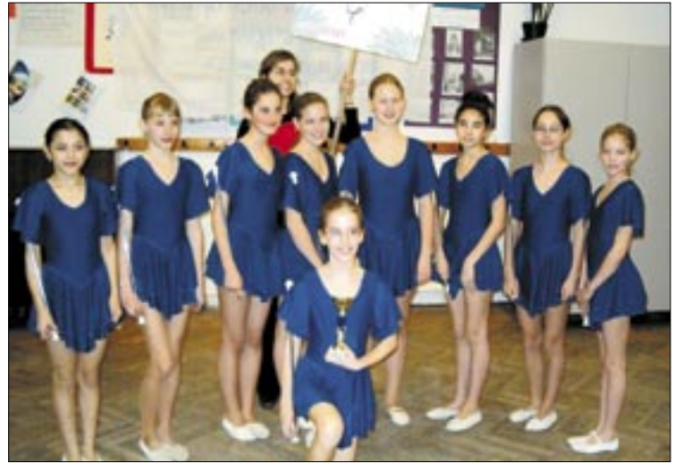
A lányok különösen akkor örülnek, amikor saját maguk találják ki új figurákat

gond a gyakorlás sem, senkit nem kell biztatni, otthon mindenki annyit gyakorolhat, amennyit szeretne, és ennek meg is látszik az eredménye.