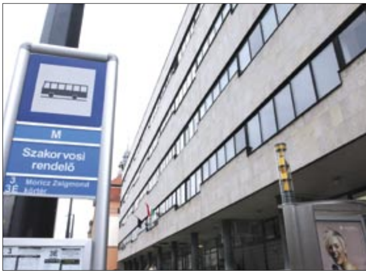
A helyi védettséget élvező szakrendelő épülete 2006-ra megújul

rendelő mint ingatlan, tulajdonjogilag ez év április elsejétől lesz a kerület birtokában, ezzel együtt kerül tulajdonba a Budafokon működő tüdőszűrő állomás is. A szakrendelő irányítását a Gyógyír Kht. akkor kezdheti meg, ha az Országos Egészségügyi Pénztár a finanszírozást megadja számára, ez előreláthatólag júliusra valósul meg. Az alpolgármester sajnálatosnak ne-