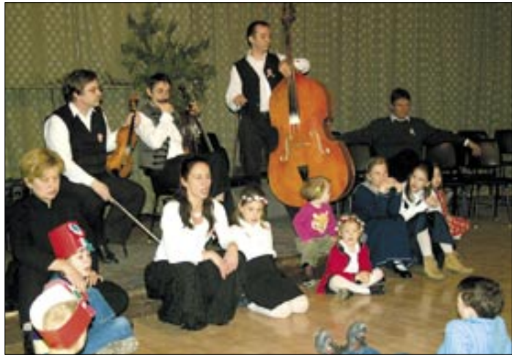
A Jánosi együttes teremtette forradalmi hangulatban gyorsan száll az idő