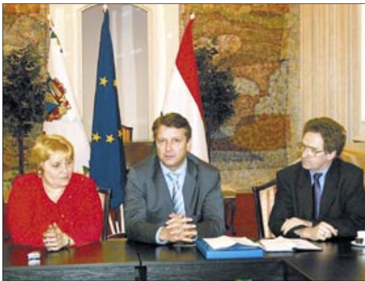
A versenyben nincsenek egyéni győztesek, csak közös célok és közös sikerek ...