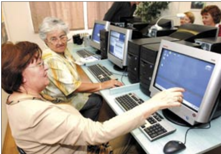
A tanfolyam elvégzéséhez nem szükséges semmilyen számítógépes ismeret

Új világ nyílik majd meg előttük az internet használatával. A polgármester minden vállalkozó kedvű kerületi nyugdíjast arra biztat, hogy menjen el