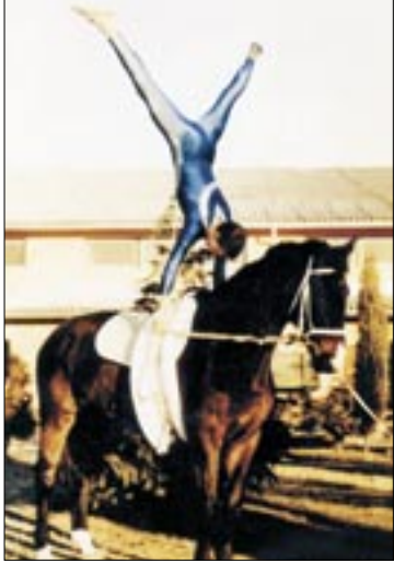
Ízületeit megviselte a tizennégy év

Az elmúlt évtized egyik meghatározó lovastornásza, Horváth Csongor befejezte versenyzői pályafutását. A 24 éves újbudai fiatalember a Budapesti Lovas Klub színeiben 6 egyéni és 4 csapat országos bajnoki címet szerzett, emellett egy Európa-bajnoki 4. helyezéssel is büszkélkedhet.