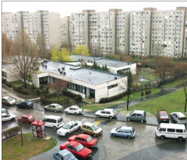
A gazdagréti parkolóhelyet találni