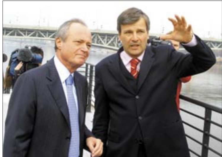
A szennyvíztisztító hosszú távon nagyobb jelentőségű, mint a metróberuházás

zalékát a fővárosi önkormányzat állja. Az építkezéssel párhuzamosan – a főváros saját beruházásában – bővül a főváros csatornahálózata, így az évtized végére Budapest teljes területe csatornázott lesz; s 3,6 kilométeres gerincút épül, amely megkönnyíti Csepel közlekedését. A szennyvízkezelő kivitelezési munkálatai jövőre kezdődnek, s a telep 2009-ben kezd üzemelni. A tervek szerint 2010-ig Dél-Budán is felépül egy szennyvíztisztító, mely a térségben és az agglomerációban keletkezett szennyvizet kezeli majd, így Budapest szennyvizeinek száz