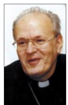
Erdő Péter bíboros

Ugyanakkor rendkívül erős a gazdaság igazságra való befolyása: gyakran előfordul, hogy semmitmondó műveket tesznek világszerte ismertté az erőteljes reklám révén, míg ennek hiányában a valóban értékes alkotásoknak alig van visszhangjuk. Napjainkban a rövid távú érdekek érvényesülnek, s ennek egyik legnyilvánvalóbb jele a környezet gyakran gátlástalan pusztítása, károsítása. Mindez úgy hat a társadalomra, hogy megszűnik az egységes világlépés, amelynek hiányában az emberek ki vannak téve mindenféle manipulációnak. A közösségek felbomlanak, a társadalom atomizálódik. A bizony-