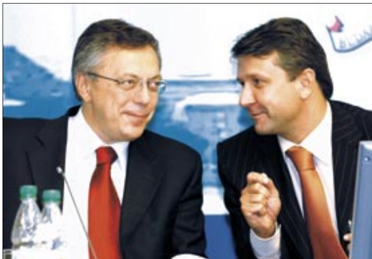
Lajos Imre alpolgármester és Molnár Gyula polgármester

Február 19-én a legfontosabb téma az idei költségvetés lesz, legtöbb napirend a gyermekvédelemmel, ifjúsággal, játszótérrel, oktatással és az egészségüggyel foglalkozik