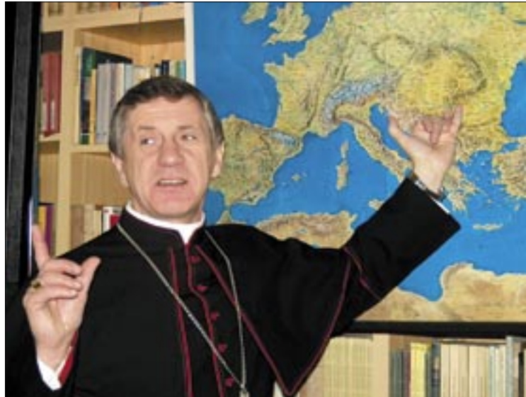
Közös volt a sorsunk a múltban és a jövőben is az lesz, itt Közép-Európában