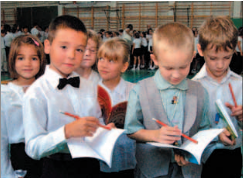
Az újdonsült elsősök nagy izgalommal várják, hogy teleírassák az első füzetüket.