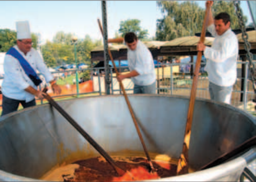
Pestlőrincen a Bókay-kertben szeptember 3-án Újbuda vezetői vendégek és versenyzők voltak a bográcsolásban. Helytálltak, persze nem ebben a 4200 literes rekorder edényben főztek.