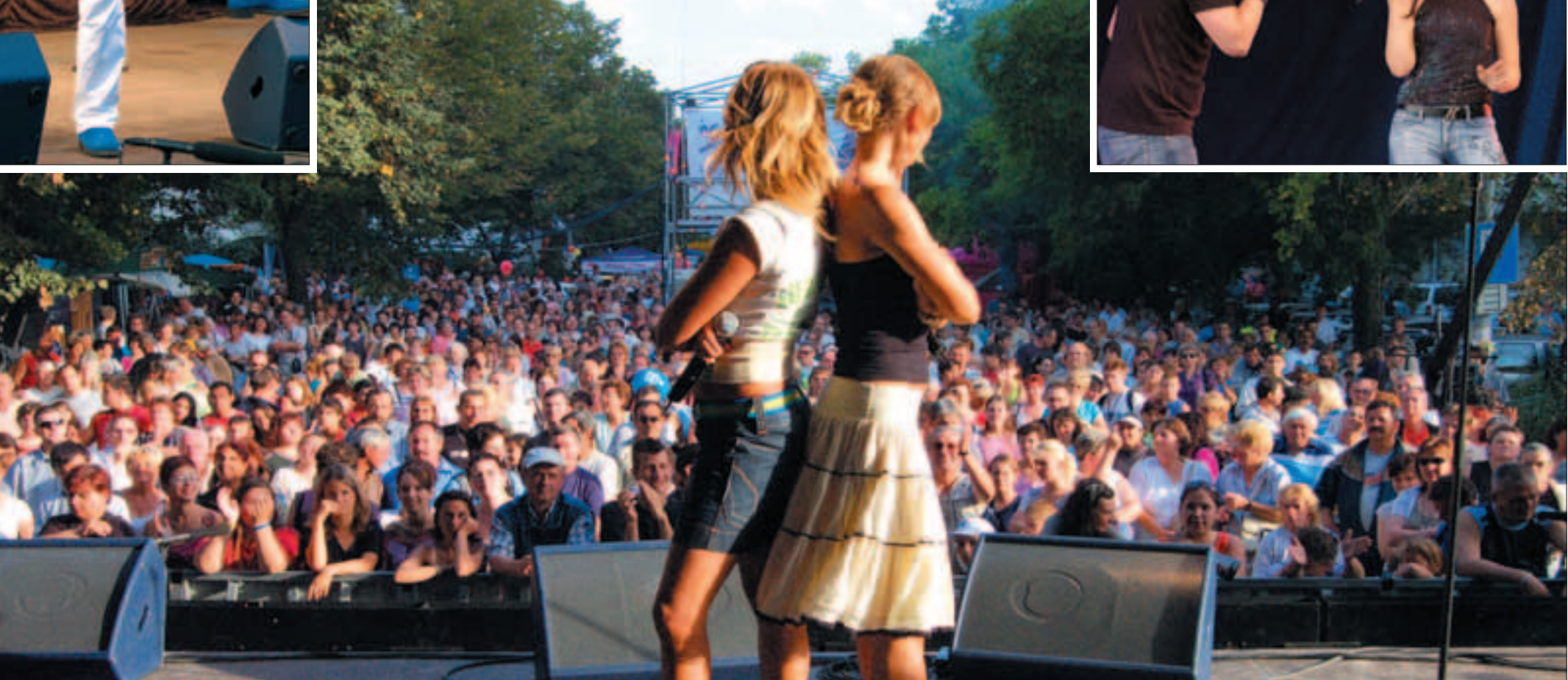
Fotó: Róbert Márton