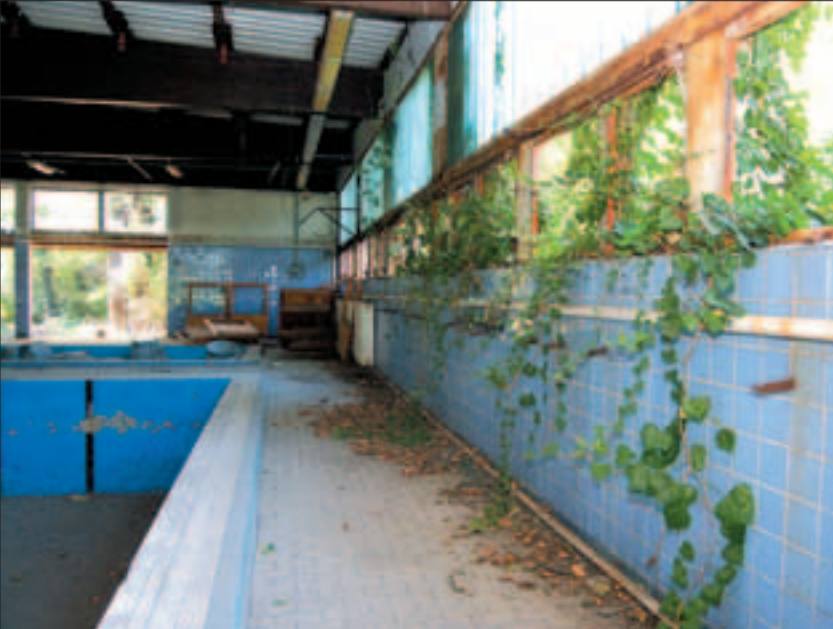
A Szent Imre Kórház bezárt uszodáját mára már a repkény is benőtte

ban hirdették. Neves vegyészek, híres orvosok igazolták a termék jótékony hatását, szakvéleményeiket aztán prospektusokban jelentették meg az összes világnyelven. Az első tíz évben kétmillió palackot állítottak elő, csak 1913-ban közel 10 milliót, aminek a nagy részét külföldön adták el. Az évek során mintegy 200 aknakutat ás-