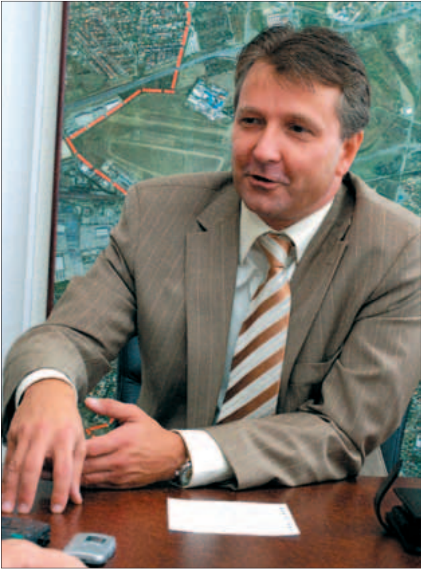
A legfontosabb, hogy Újbuda lakói együtt tudnak működni a közös helyi célok érdekében

szerint az a véleményem, hogy az öböl városképi szempontból is rendkívüli lehetőséget rejt magában. Gondoljunk bele, hogy Budapestnek a szimbólumai inkább a XX. század elejéhez, sőt a XIX. század végéhez kötődnek. Itt az alkalom, hogy a XXI. század fővárosi jelképét megalkossák az építészek, művészek. Számunkra különösen fontos, hogy ez egyben itt, nálunk, Újbudán történhet meg. Aki járt a világban, láthatja, hogy másutt is igyekeznek a múlt örökségét és a korszerűséget ötvözni, egymás mellett megteremteni.