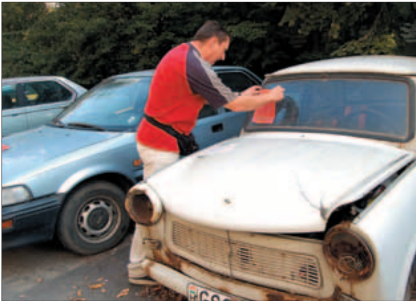
A kerületet meg kell tisztítani a roncsoktól: A felszólítások kihelyezése folyamatosan zajlik

Téved a tulajdonos, ha azt gondolja, rendszám van, parkolhat az idők végezetéig. Közterületen csak érvényes műszaki vizsgával és rendszámmal rendelkező gépjármű tárolható. És akkor nem beszélünk még a roncsokról. Hogy hány ilyen jármű van a kerületben, azt pontosan nem tudni, de akár több száz is lehet. Csak Gazdagréten, a Kérő utcában tizennyolcat számolhatunk meg, foglalják az amúgy is kevés parkolóhelyet, a lakók bosszúságára.