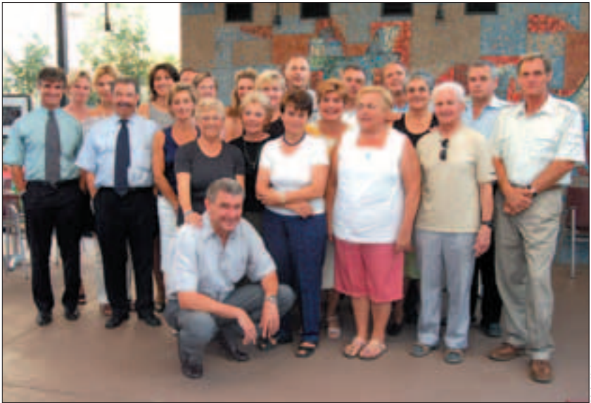
A magyarok csapatban bizonyultak erősnek.

nyertek. Ez a nem várt siker hatalmas lendület adott a folytatáshoz, ettől kezdve a szeniorokat nem lehet leállítani! Lét-számuk 120 főre duzzadt, a Nyéki Imre uszodában ideális otthonra leltek. A kerületi önkormányzattól is megkapták a támogatást, a záróra utáni uszodahasználati jogot. Az edzések újrakezdése nem volt könnyű feladat, de a sorozatos sikerek mindenkit kárpótoltak.