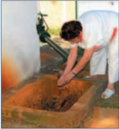
A gyógyforrás jelenlegi állapotában

az, hogy a víz hasznosítására gyógyszállót hozunk létre. Ez az elképzelés egyébként a kerület rendezési tervében