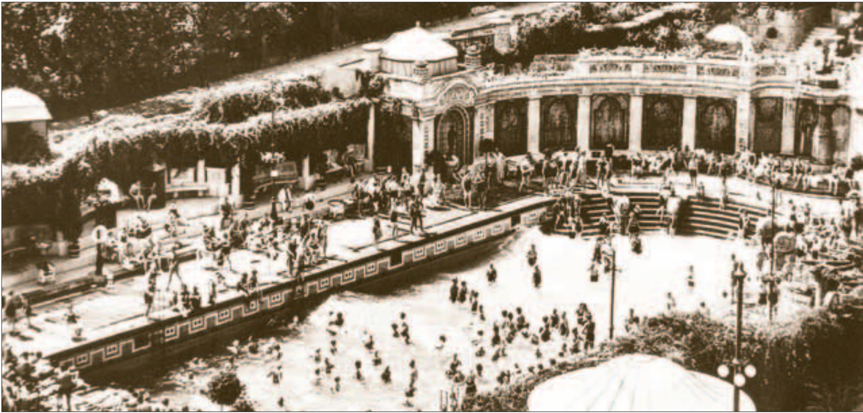
A Gellért hullámfürdője nyújtotta élvezeteket a gyógyulni vágyóknak többnyire nélkülözniük kellett

A XI. kerület keserűvizei egykor világhírűek voltak. A Hunyadi János és a Ferenc József vizet mind az öt földrészen forgalmazták, és gyógyhatásukról mindenhol felsőfokon nyilatkoztak. Mára a hírnevük talán kissé megkopott, ám gyógyerejük változatlan maradt. A Gellért fürdő hírneve azonban töretlen, a gyógyulni vágyók messzi földről is felkeresik.