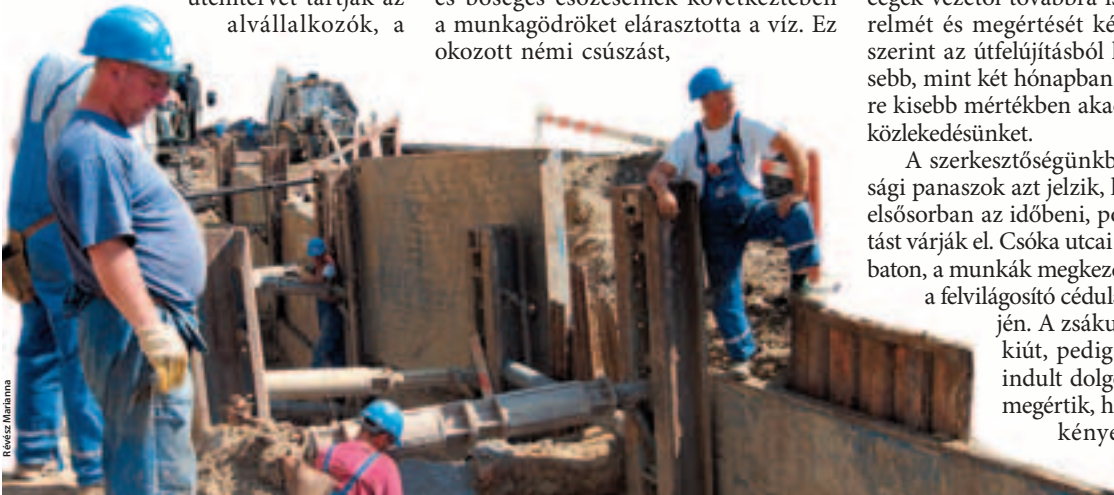
Az elárasztott munkagödrökből a munka folytatásához ki kellett emelni az esővizet

Leszáll az est, szorgos kezek hordják ki a pincékből, tárolókból az évek alatt felgyülemlett limlomot. Az utcán megkezdődik a bontás, válogatás, külön kerül a fém, a papír, a bútór és a könyv. Mindennek lesz új gazdája, hamarosan megjelenik a menetrendszerinti teherautó, hihetetlen magasságúra tor- nyozva, de a hűtő még valószínűleg felfér. És az üzlet megköttetik. A cucra vigyázni kell, minél több, annál nehezebb, elkél a család segítsége. Fényképezni, nyúlalni tilos, de minden eladó. A sürgés az utcán hajnalig sem csitul, felváltva virrasztanak, míg végre eljön a reggel – és vele a csúcsforgalom.