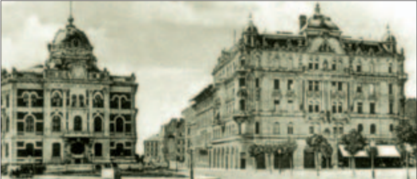
A Ch épület és az Eraviszkusz-ház, jobboldalt a Műegyetem kávéház.

A legismertebb felvételt a korabeli Eraviszkusz-házról a Múgyetem kávéházzal a híres fotós, Divald Károly készítette. Megörökítette rajta a Gellért tér