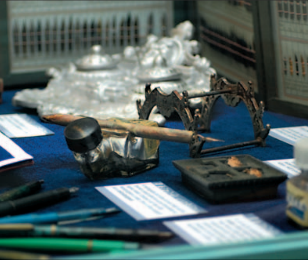
Acéltollat és fémhegyes töltőtollat először Nagy-Britanniában készítettek, Birmingham lett a tollhegykészítés központja.

Az Országos Műszaki Múzeum kiállításán az íróeszközök fejlődését kísérhetik végig a látogatók az egyiptomi írószerszámoktól a modern kori tollakig. A kiállítás egyben emléket állít a golyóstoll magyar-argentin feltalálójának, Bíró Lászlónak.