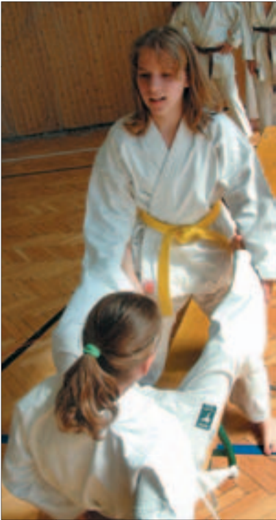
Karateedzés a Budai Sport Iskolában

A sportiskolák eddig nem kaptak kiemelt állami támogatást, ezért május végén a Nemzeti Utánpótlásnevelési Intézet és a Nemzeti Sporthivatal pályázatot írt ki. Országosan huszonégy-huszonöt iskolát körzeti sportiskolaként jelölnek ki. Megyéenként egy-egy ilyen iskola lesz, Budapesten öt régiót terveznek: észak-budai, dél-budai, dél-pesti, közép-pesti, észak-pesti; tehát öt erre alkalmas iskolát fognak győztesnek kikiáltani. Ezek kiegészítő állami támogatást kapnának, melynek összege – a tervek szerint – tanulónként körülbelül harmincezer forint. A program jövő év szeptemberétől indulna és a belépő elsőöket, illetve középiskolák esetében a kilen-cedik évfolyamosokat érintené. A sikeres pályázat egyik feltétele – az infrastruktúra meglétén túl –, hogy legyen olyan pedagógiai programja, kezdeményezése az iskolának, amely nagyobb területi egységet átfogóan mintaként szolgálhat. Június 20-án