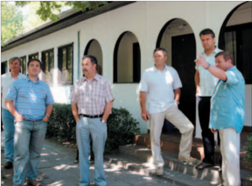
TÁBORMUSTRA Újbuda vezetői a nyitás előtt megsemlélték a táborhelyszínek állapotát

ri Hivatal művelődési osztálya intézi. A kerületi iskolák delegálhatják tanulóikat a 8-16 óráig fogadóképes napközis táborba, ahol zömmel alsó tagozatos iskolások nyaralnak, de szívesen látják a felsősöket is. A tábor nagy parkjában sportpályák és medencék várják a gyermekeket, valamint változatos programokat biztosítanak