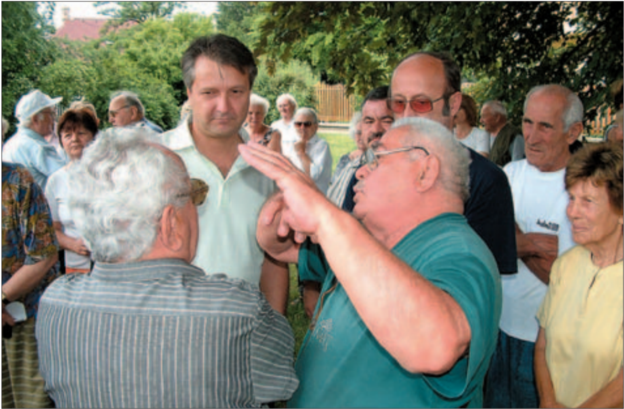
A sajtótájékoztató hamar átalakult lakossági fórummá. Végre egyszer mindenki szerette volna elmondani a saját sérelmét.

tartásban szereplő tulajdonos a Kincstári Vagyoni Igazgatóság. A 2004. december 6-án kiváltott tulajdoni lapokon már egy újabb tulajdonosváltás szerepelt. Eszerint a Kincstári Vagyoni Igazgatóság